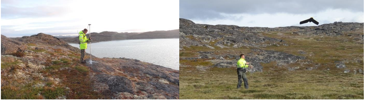
Silaannakkut assiliortuinissamut nalerassaq inissinniarneqartoq. Assilisaq: MRN. Drone-mik qangattartsineq. Assilisaq: MRN.

Nuummi immap naqqanik aammalu sumiiffimmi sarfap ingerlaasianik misissuillutillu uuttortaaitat kuuffiit imaanut aniffissaanik pilersaaruisuussipput.