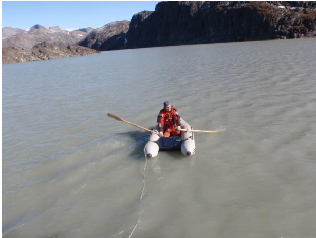
Uttortaat nutaaq tasermut inissinneqartoq.

Nukissiorfiit taassaavoq imeqarneq pillugu paasissutissanik atuinerpaajusoq. Paasisallu katersukkat aamma aatsitassarsiorfinnit annernit minnernillu aamma soqutigineqaqaat kiisalu aamma ilisimatusarnissaanik pilersaarusiortunit.