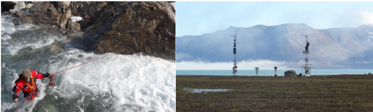
Kangerluarsunnguani erngup kuunneranik uttortaaneq (saamerleq) aammalu Zackenberg-imi silaannarmik uttortaaviit (talerperleq).

Kangerluarsunnguami sermit uukkaaffiata alaatsinaanneqarnera 2012-imi aallartinneqarpoq 2015-imilu ingerlanneqaqqilluni. Taamatut malittarinninnermi paasiumaneqarput issittumi nunami pukkitsumi oqimaaqatigiissutsit qanoq ittuuneri. Sermersuartaani uttortaavik, taassuma assiliivittaa kuuffinnillu uttortaavik misissorneqarlutik alakkarterneqarput. Assigiinngitsutigut nukit sinerissami sermersuartaasumilu ataqatigiinnerat misissorneqarput paasisallu AGU-p San Fransisco-mi ataatsimeersuartitsinerani oqalugiaatitut saqqummiunneqarlutik. Aamma NuukBasis-imit aningaasalersorneqartumik Qaanaami Nunattalu Kujataani nunap qaavani pissutsit uttortaaviit marluusut atorlugit uttortarneqarneri 2015-imi ingerlateqqinneqarput.