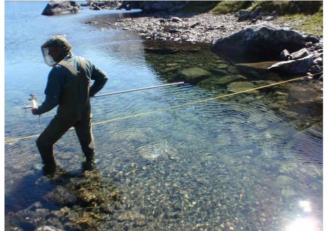
Paamiut eqqaani Nigerlermi engup aqquserfissanik uuttortaaq

Takujuttaaq imm. 5. Allanik suleqateqarluni ingerlanneqartut, uummaarissumik ingerlasut.