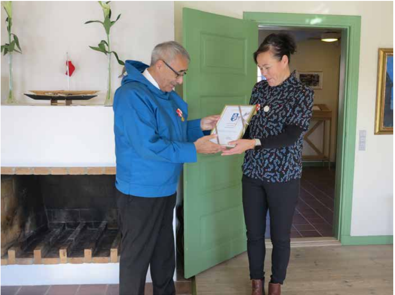
Formanden for Inatsisartut Hans Enoksen har den 23. september tildelt Nersornaat i guld til tidligere formand for Inatsisartut Vivian Motzfeldt i Hans Egedes Hus.

beskrive nærmere i historiebøgerne i årene fremover og hvor du vil have denne vigtige rolle i fortællingen.”