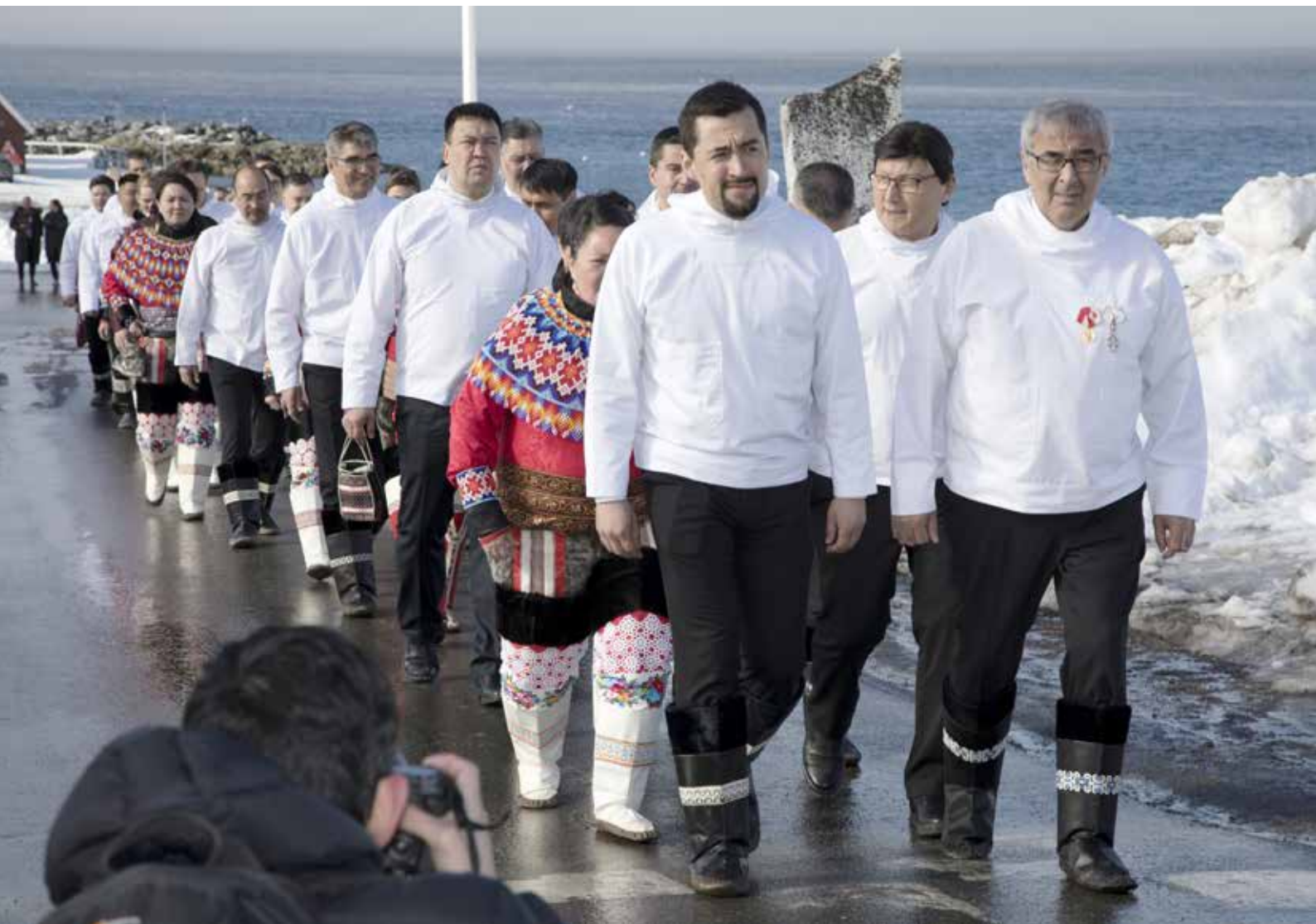
Procession til konstituerende samling efter valget 6. april 2021