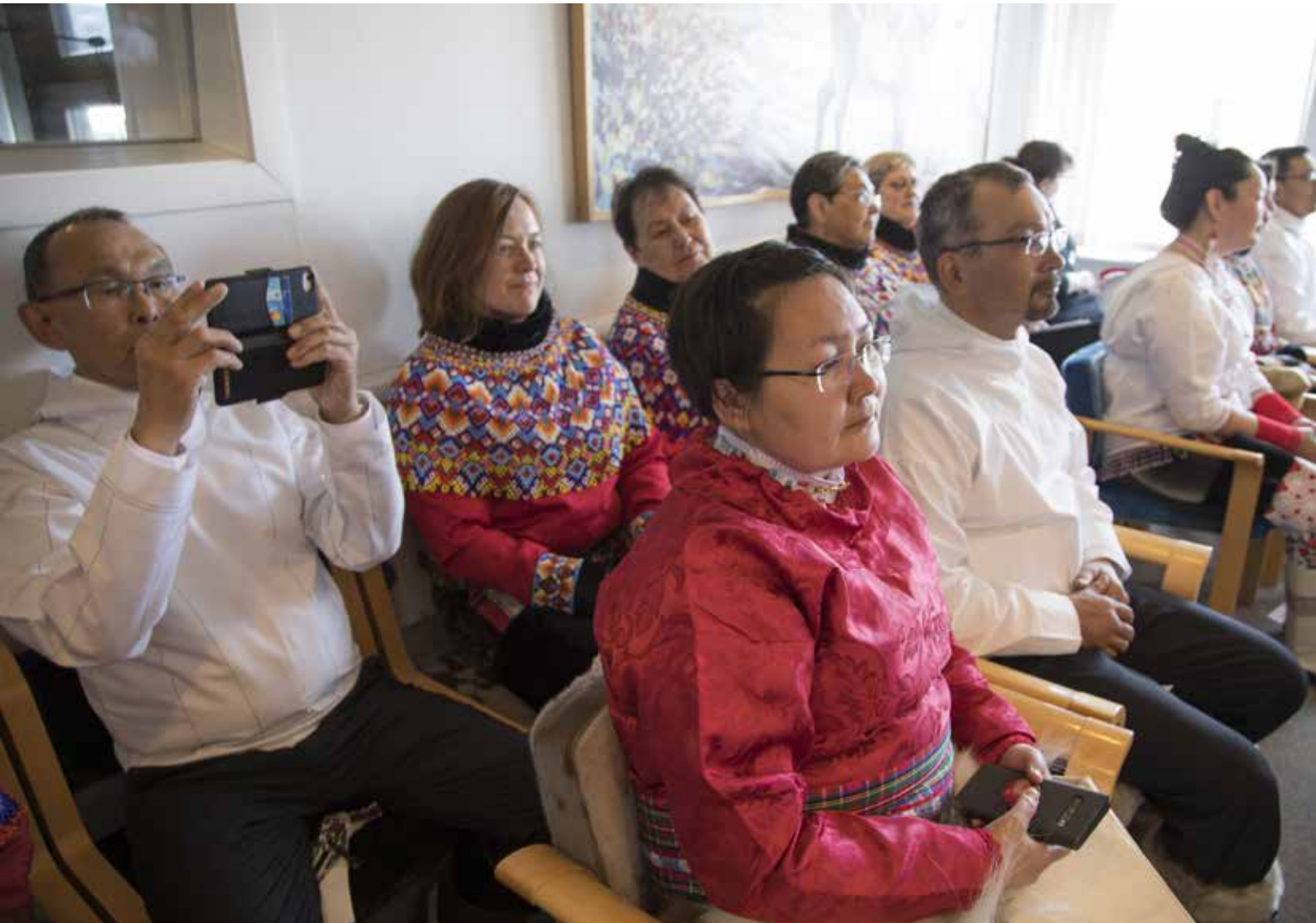
Suppleanter til medlemmer af inatsisartut der tager orlov og som sidder klar til at blive godkendt til at indtræde i Inatsisartut