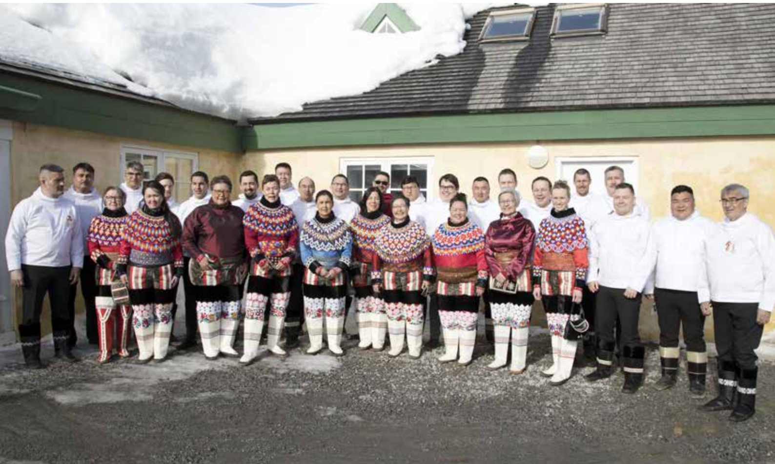
Inatsisartut og Naalakkersuisut 23. april 2021