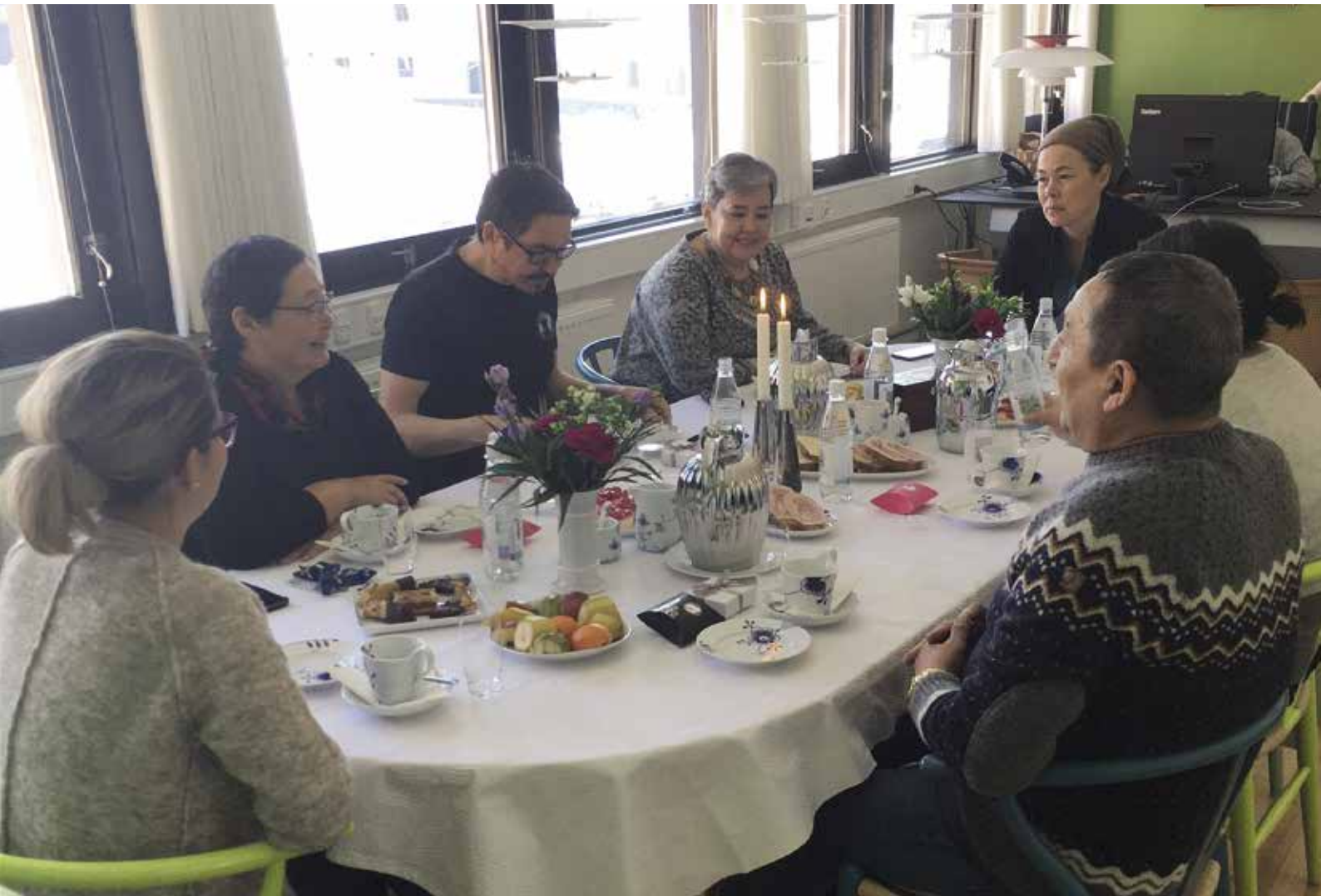
Formandskabets sidste kaffemøde i februar efter udskrivelsen af valget