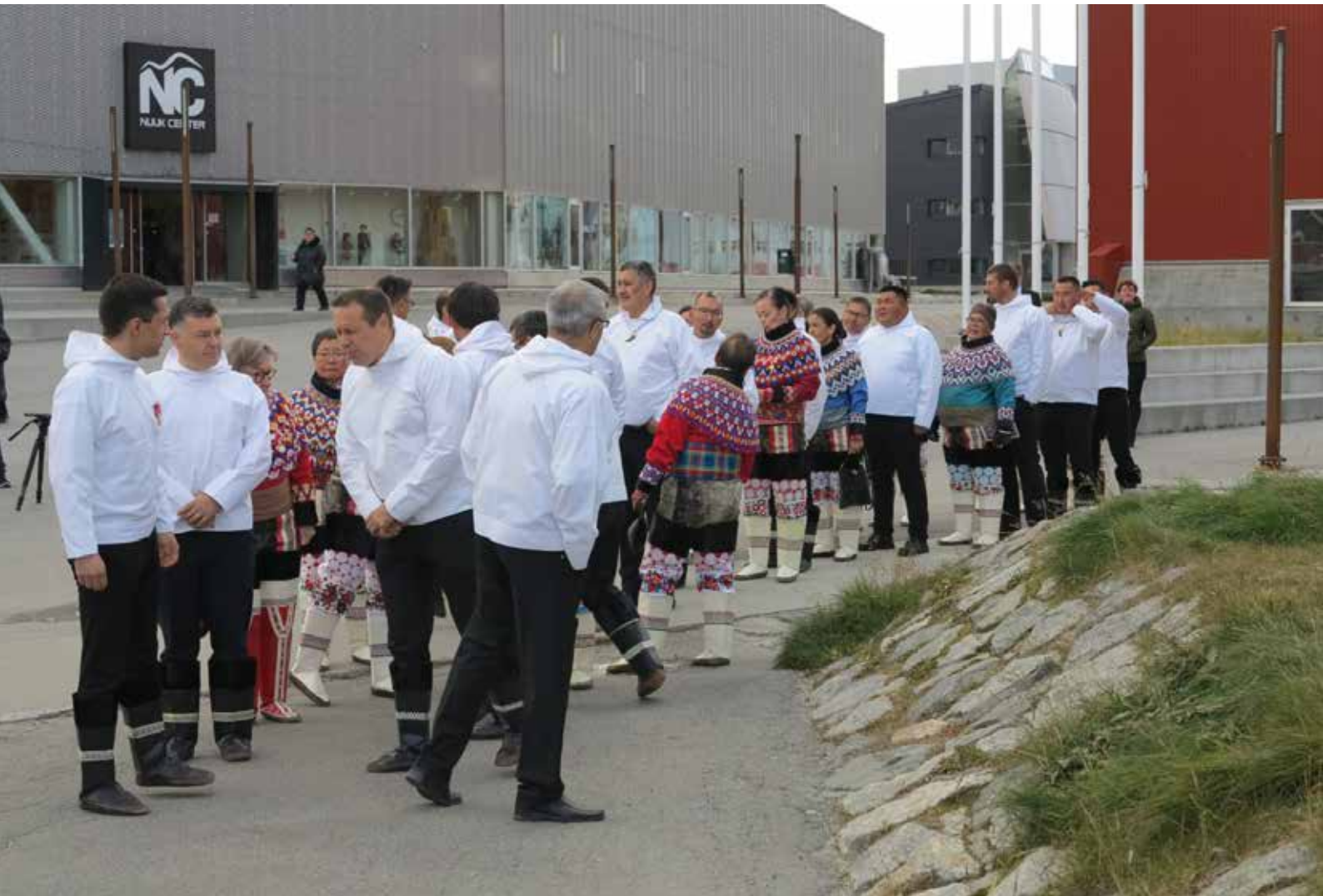
Opstilling til procession ved EM21, som startede fra Inatsisartut