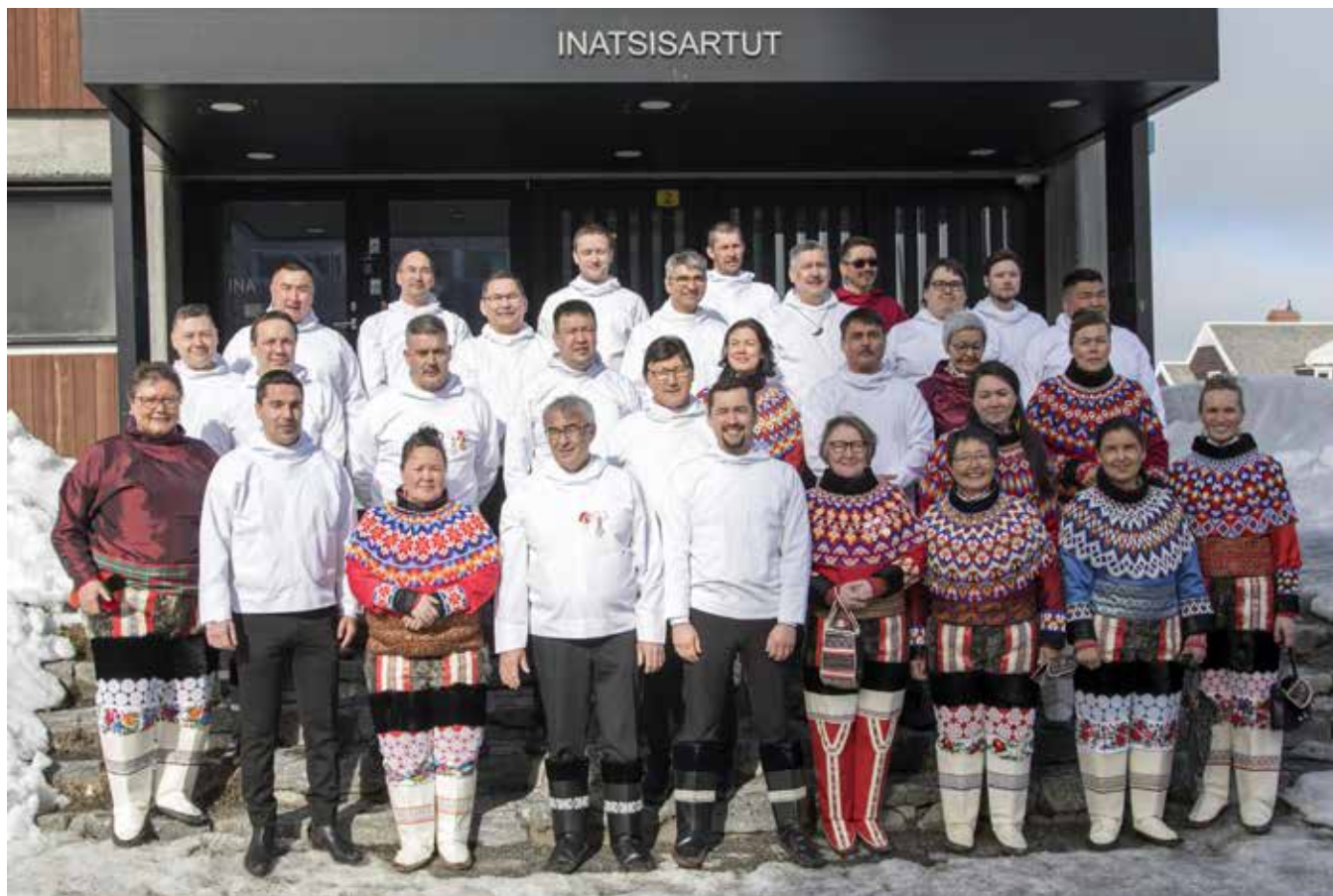
Konstituering af Inatsisartut den 23. april efter valget til Inatsisartut den 6. april 2021

De særlige begivenheder i årsberetningen for 2021 indeholder således kun valget i 2021 da arbejdet i Inatsisartut også bar præg af den sidste tid med corona og restriktionerne omkring dette.