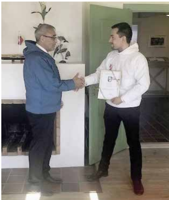
Formanden for Inatsisartut Hans Enoksen har den 23. september tildelt Nersornaat i guld til nyvalgte formand for Naalakkersuisut Mute B. Egede i Hans Egedes Hus.

Formanden for Inatsisartut Hans Enoksen har den 23. september 2021 tildelt Nersornaat i guld til Formanden for Naalakkersuisut Mute B Egede i Hans Egedes Hus, Nuuk.