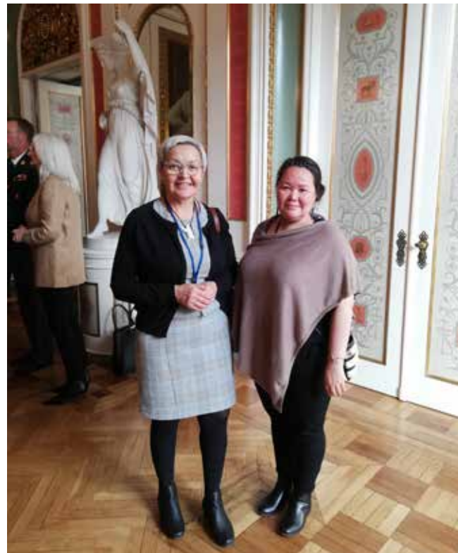
Til frokost hos Dronningen