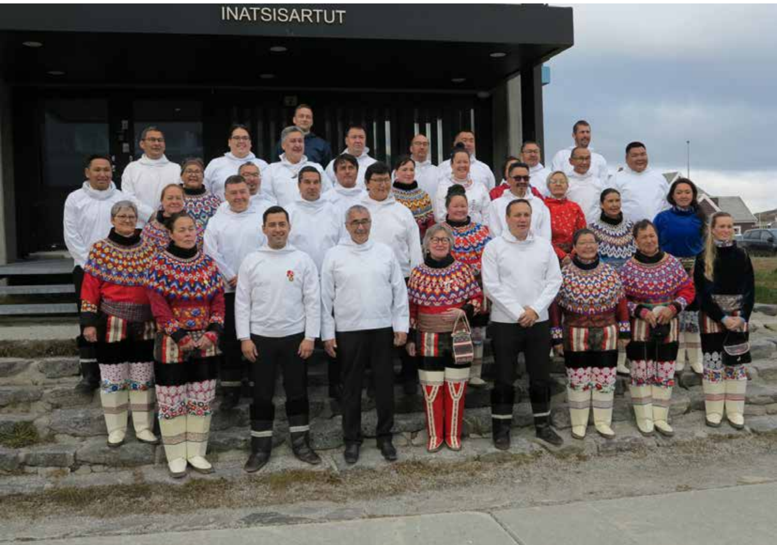
Inatsisartut til EM21 ved trappen foran Inatsisartut