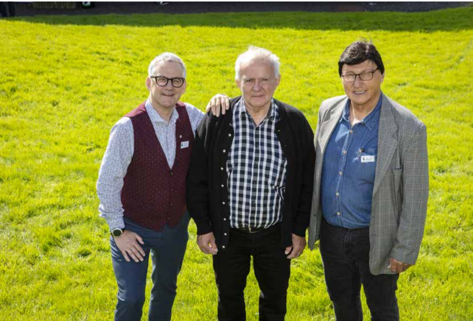
Afgående præsidi ved årsmødet 2021