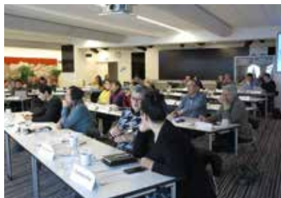
Seminar for nyvalgt Inatsisartut 28. og 29. april 2021