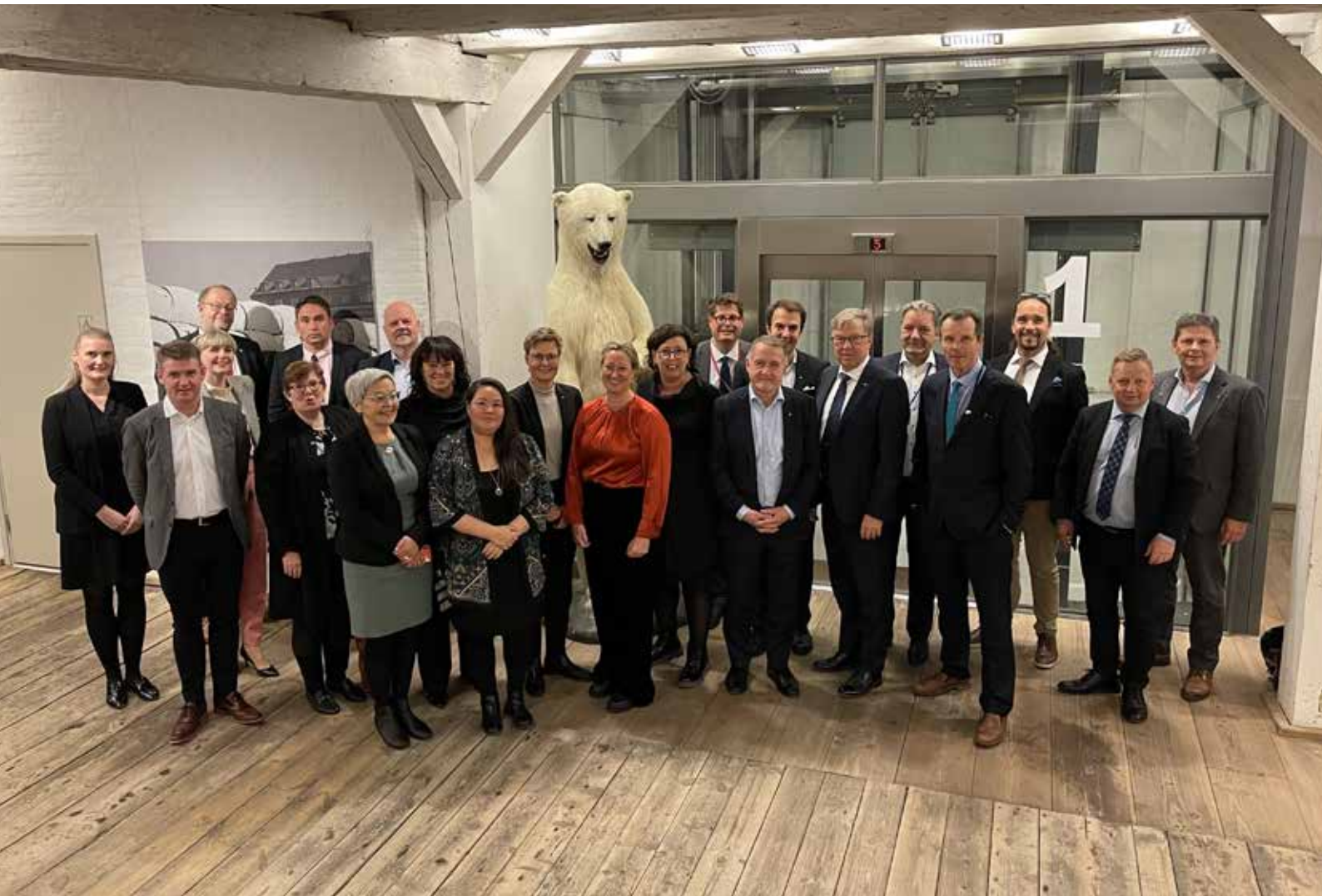
Mødedeltagere fra Grønland, Færøerne og Åland på Grønlands repræsentation efter mødet den 3.11.