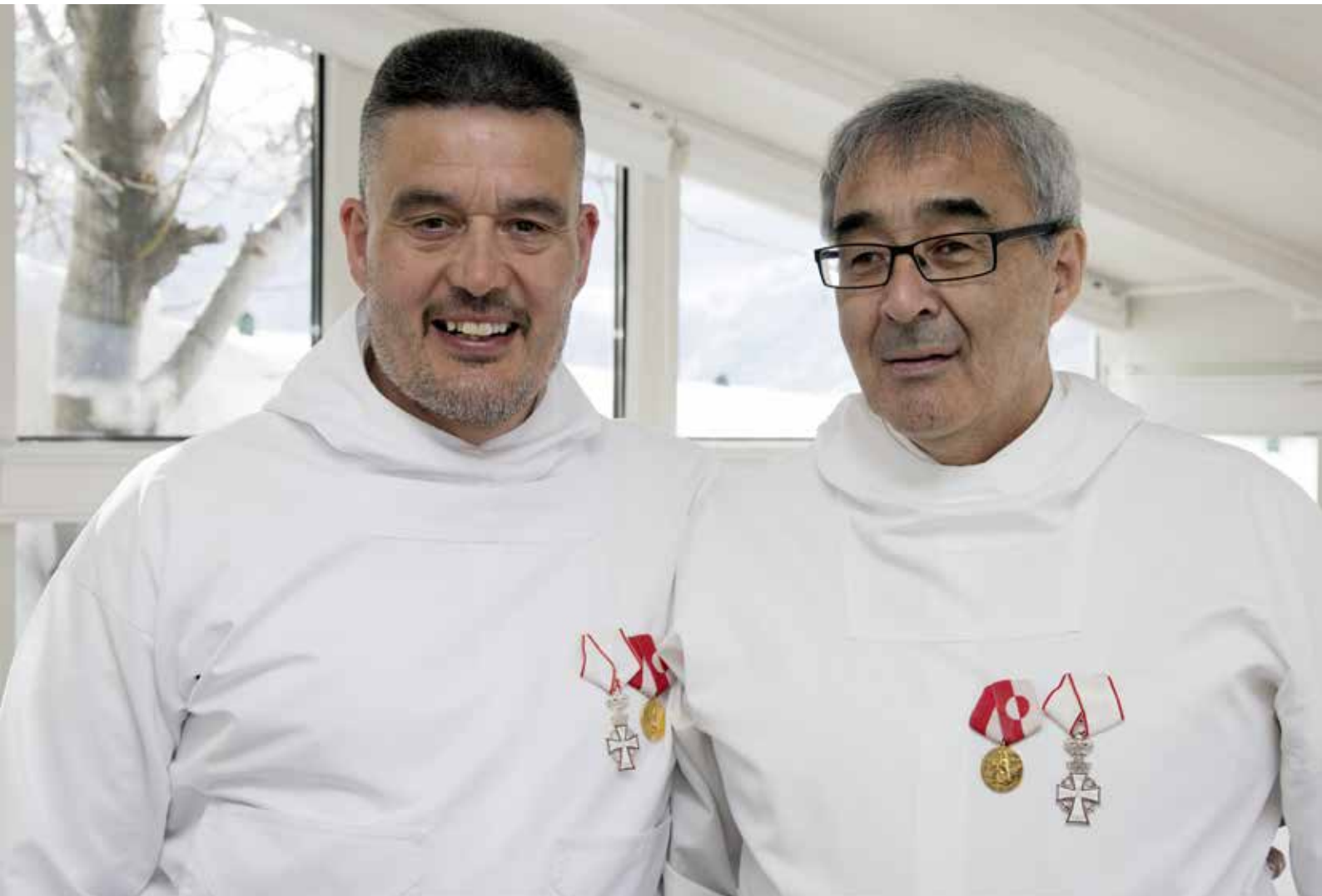
Fratrædte formand for Inatsisartut Hans Enoksen (th), med ny formanden for Inatsisartut Kim Kielsen (tv) fra 5. april 2022