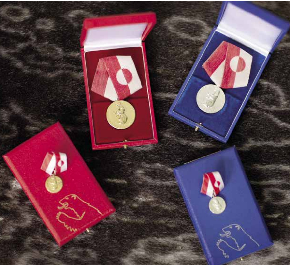
Nersornaat i guld og sølv