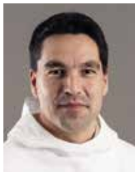
Aqqaluq B. Egede