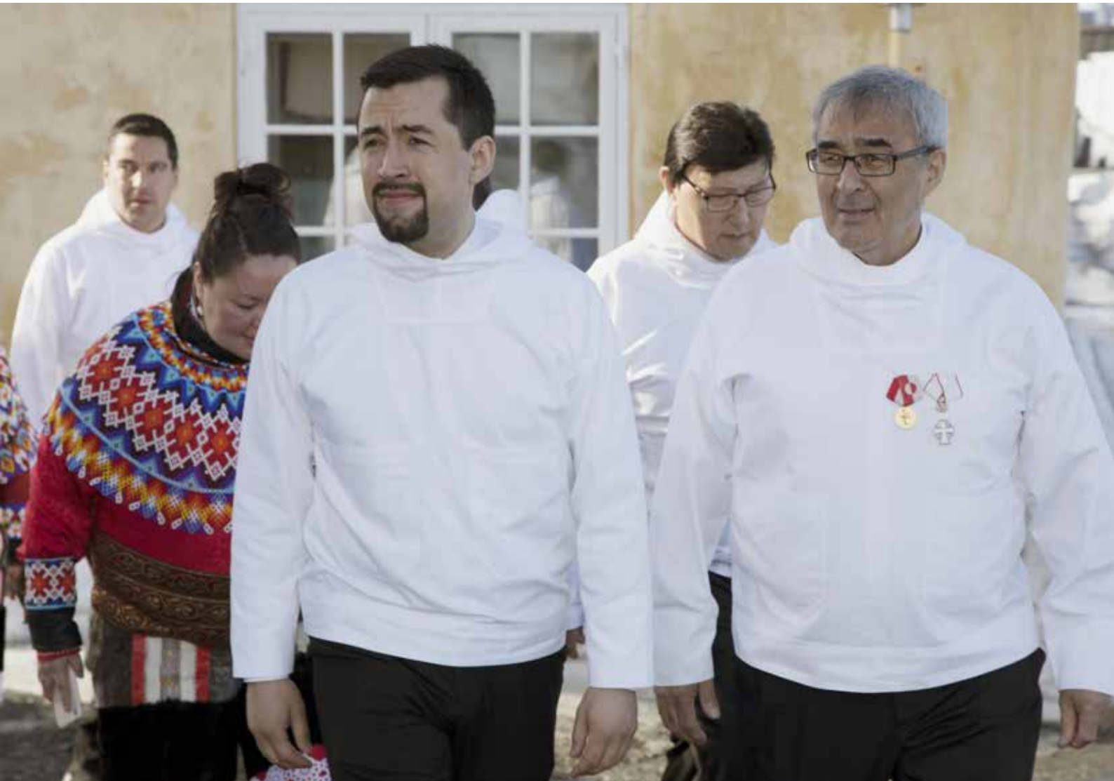
Procession fra Hans Egedes Hus til konstituerende samling efter valget. Medlemmer går i rækkefølge efter anciennitet efter et valg - undtagen de 2 forreste som er den kommende formand for Naalakkersuisut og den anden er aldersformand i Inatsisartut