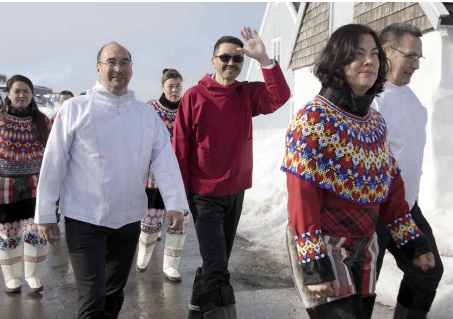
Procession til konstituerende samling efter valget 6. april 2021