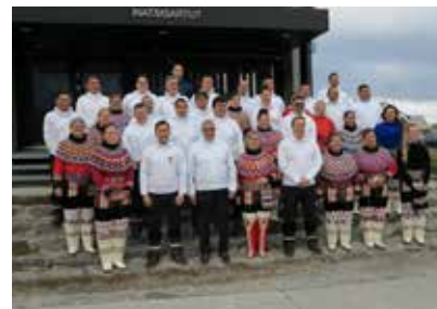
Inatsisartut til EM21 ved trappen foran Inatsisartut