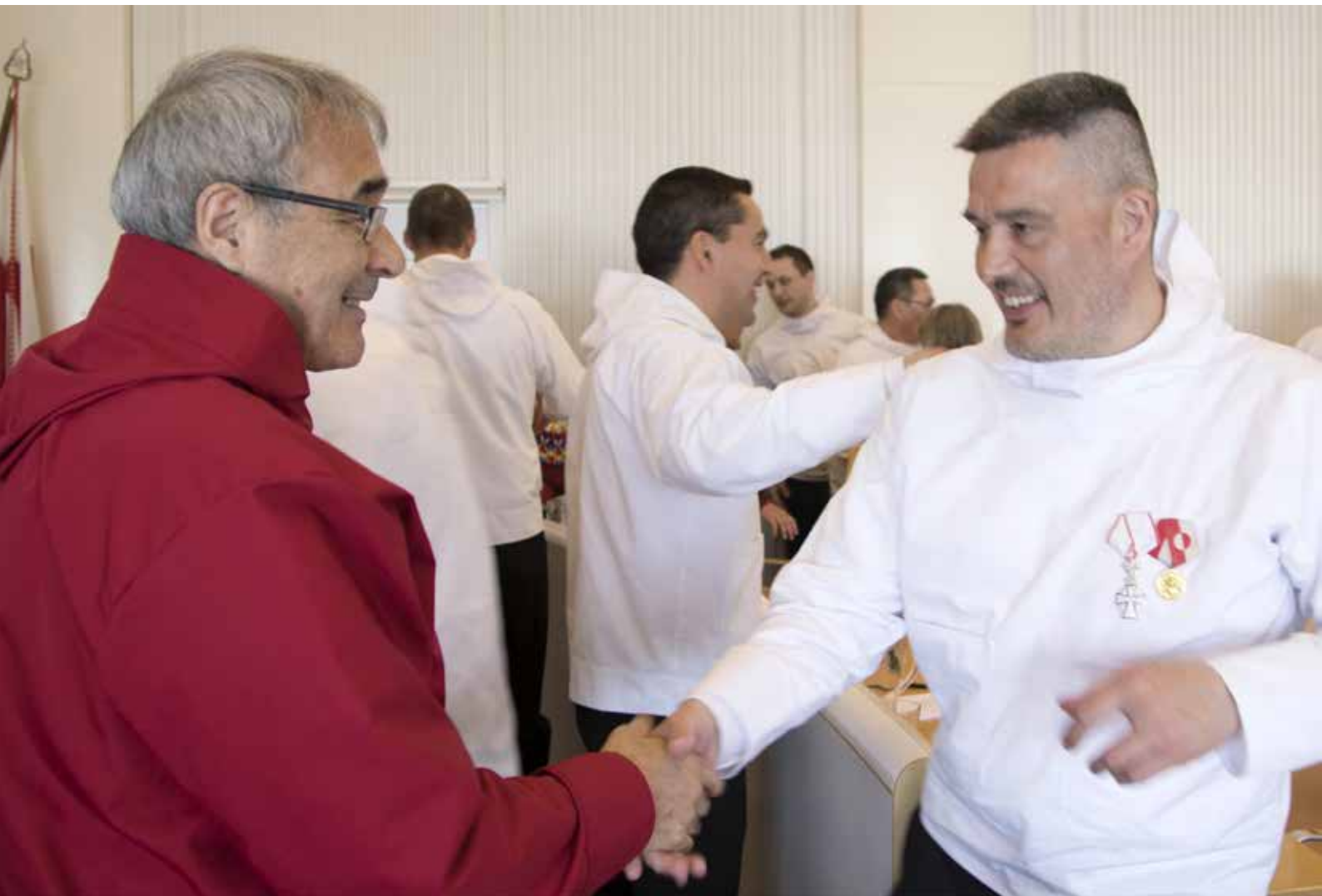
23. April 2021 Konstituerende samling. Nyvalgt formand for Inatsisartut Hans Enoksen (tv) og fratrådte formand for Naalakkersuisut Kim Kielsen (th)