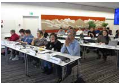
Seminar for nyvalgt Inatsisartut 28. og 29. april 2021