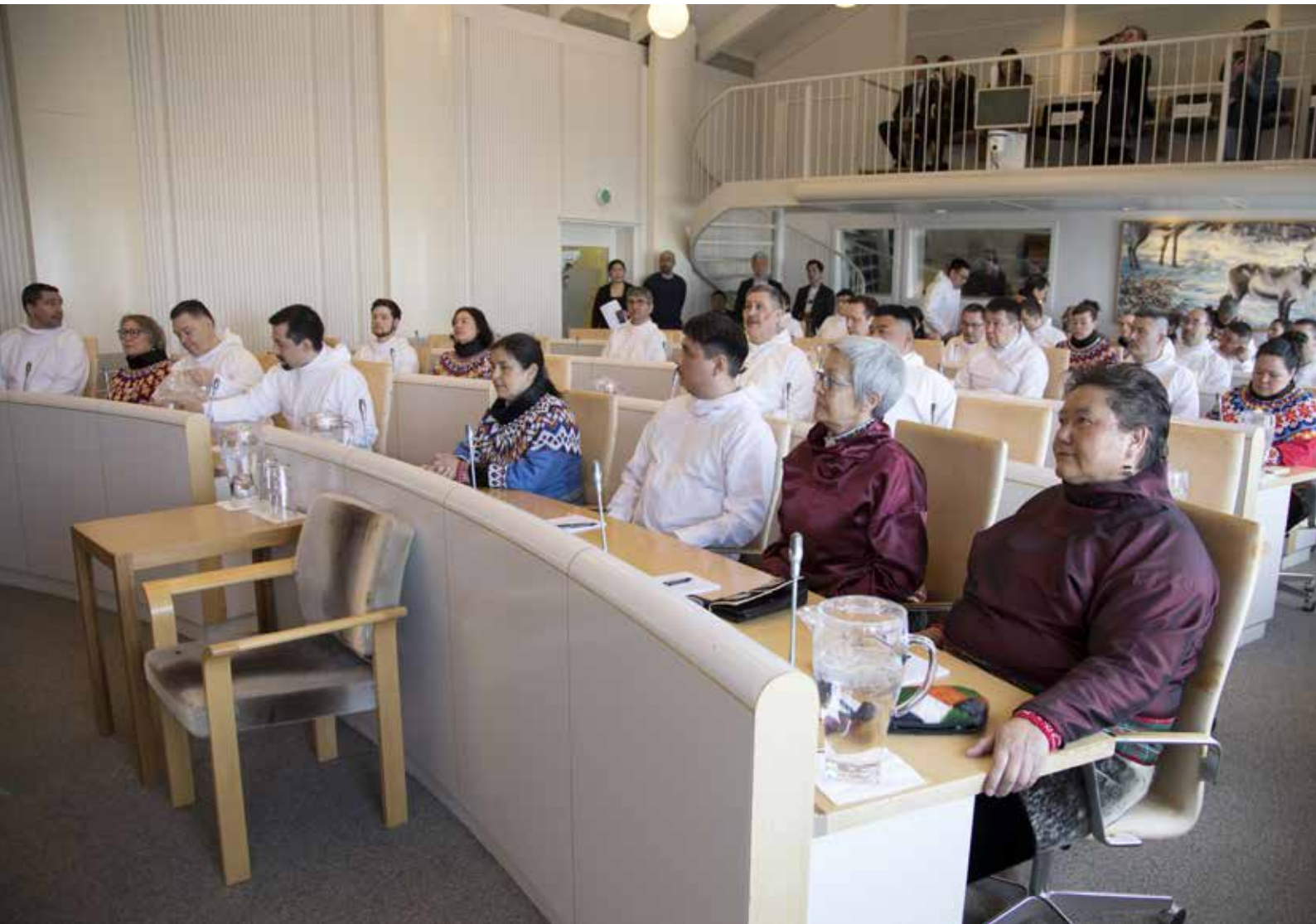
Nyvalgte medlemmer til Inatsisartut i salen