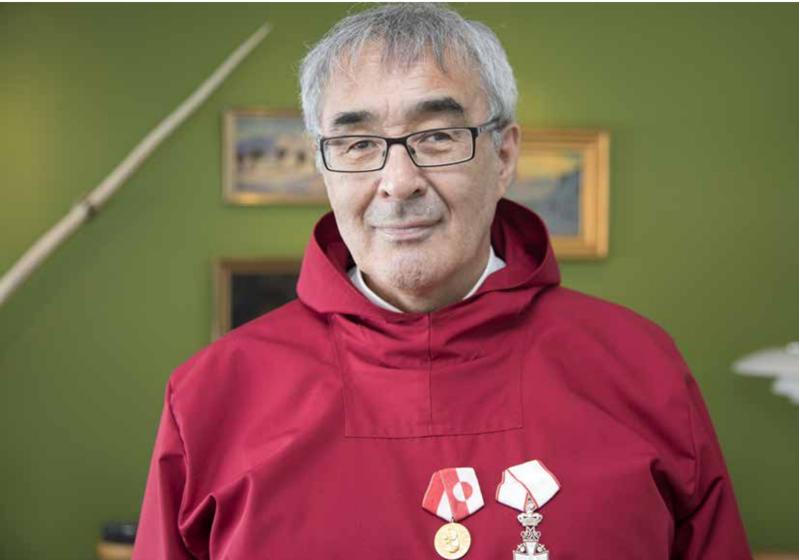
Nyvalgt formand for Inatsisartut Hans Enoksen ved konstituerende samling af Inatsisartut efter valget