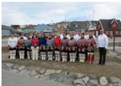
Inatsisartut til EM21 efter kirkegang ved Kaassaasuk statuen