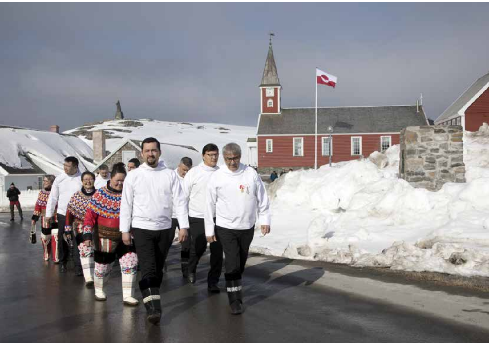
Procession fra Kirken til Inatsisartut