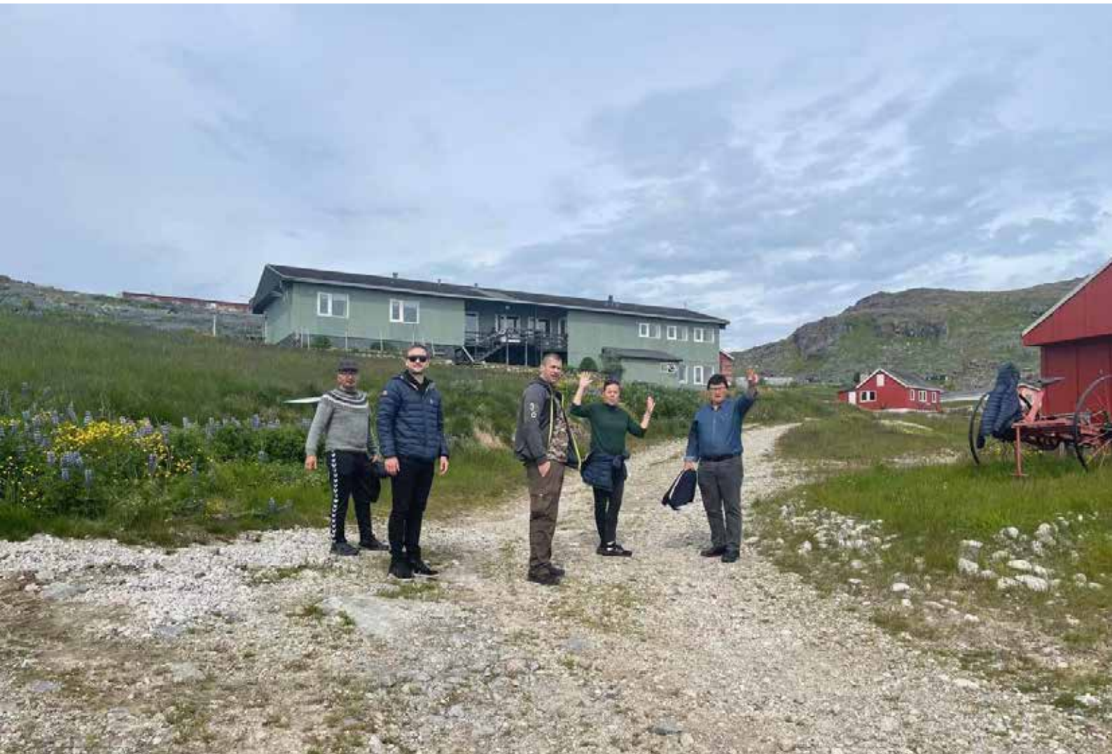
Udvalgsmedlemmer på tur