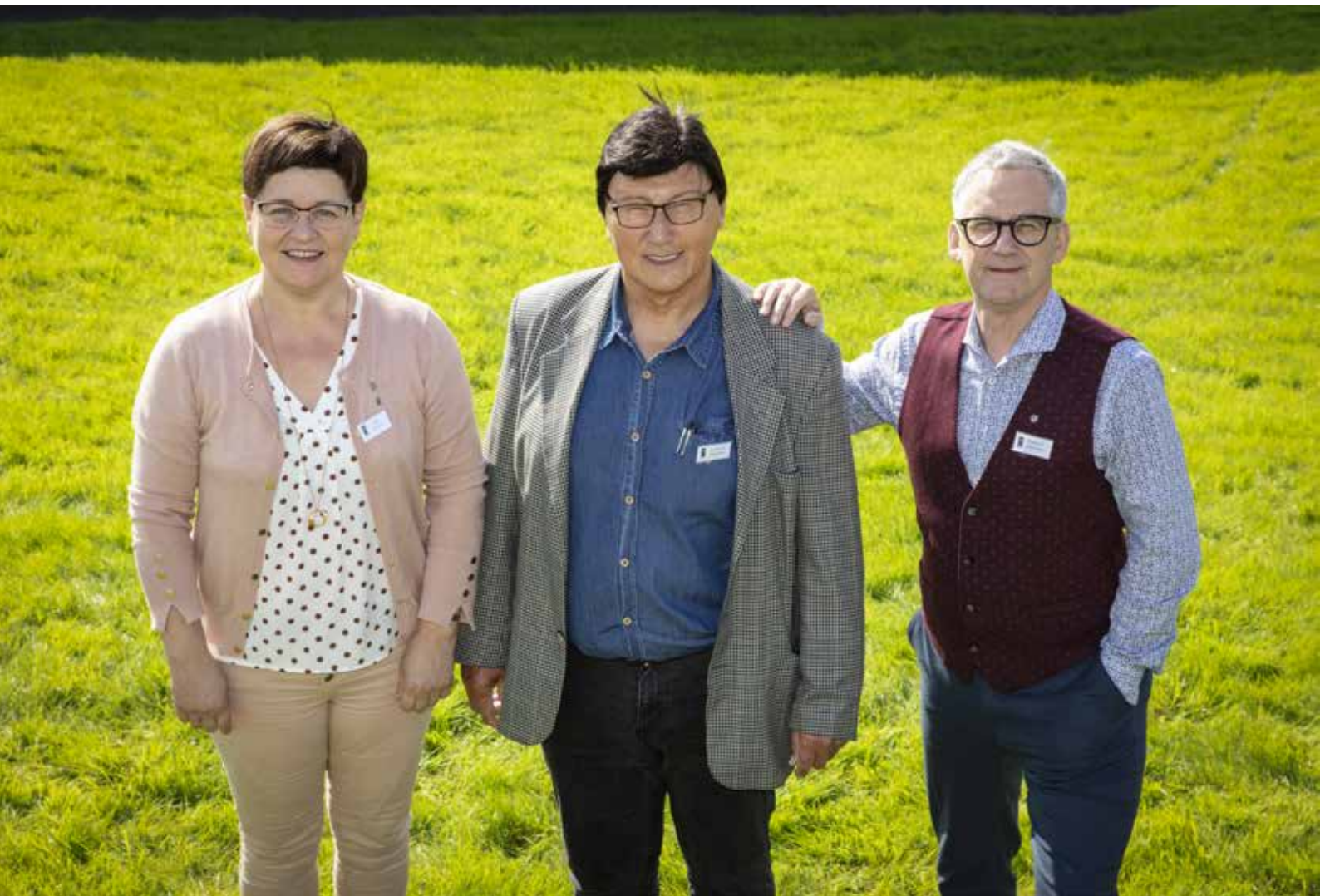
Nyt præsidié efter årsmødet 2021