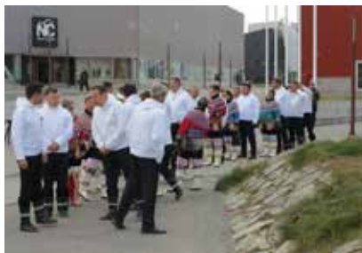
Opstilling til procession ved EM21, som startede fra Inatsisartut