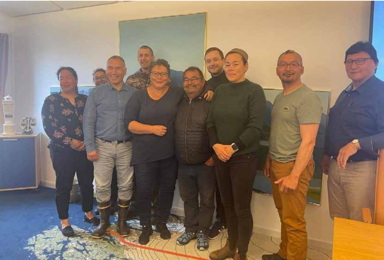
Møde med erhvervsudvalget og borgmestren i Kommune Kujalleq