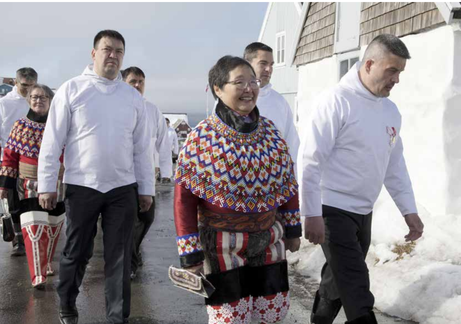
Procession til konstituerende samling efter valget 6. april 2021