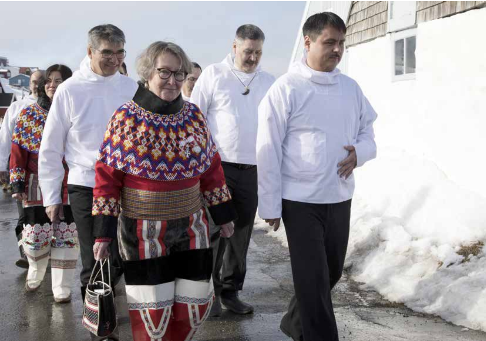
Procession til konstituerende samling efter valget 6. april 2021