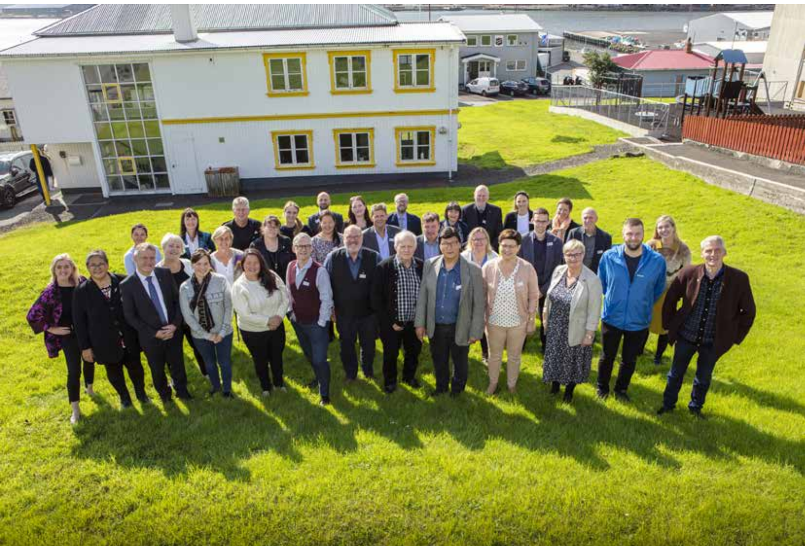
Vestnordisk Råd 2021