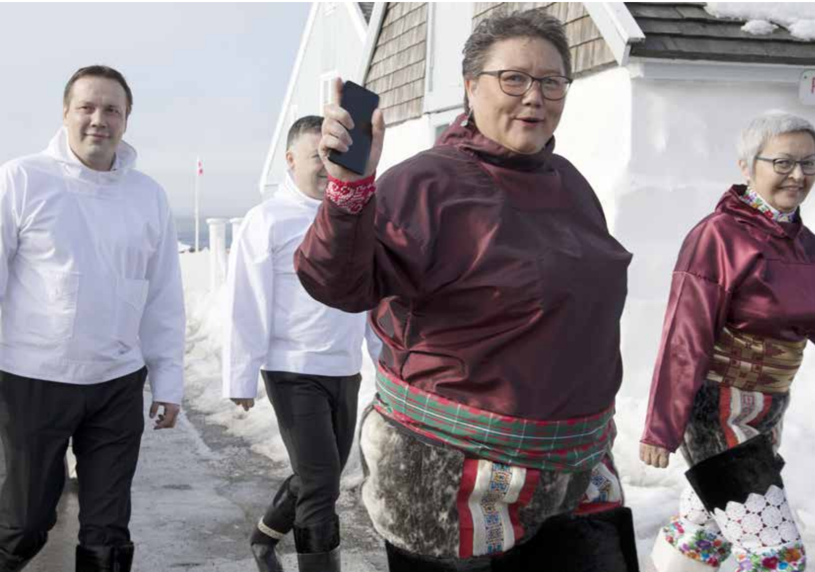
Procession til konstituerende samling efter valget 6. april 2021