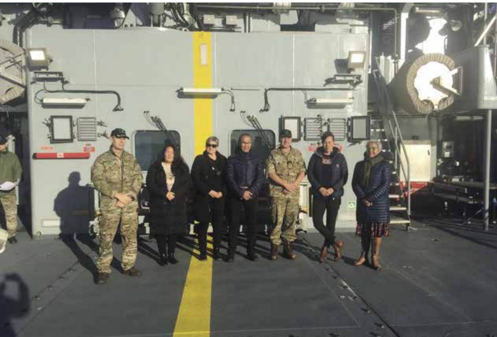
Udenrigs- og Sikkerhedspolitisk Udvalgs besøg hos Arktisk Kommando, 18. oktober, 2021