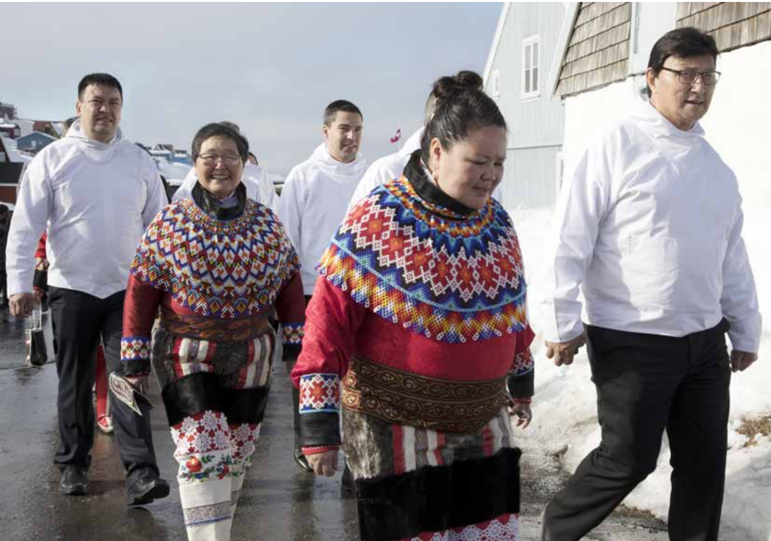
Procession til konstituerende samling efter valget 6. april 2021