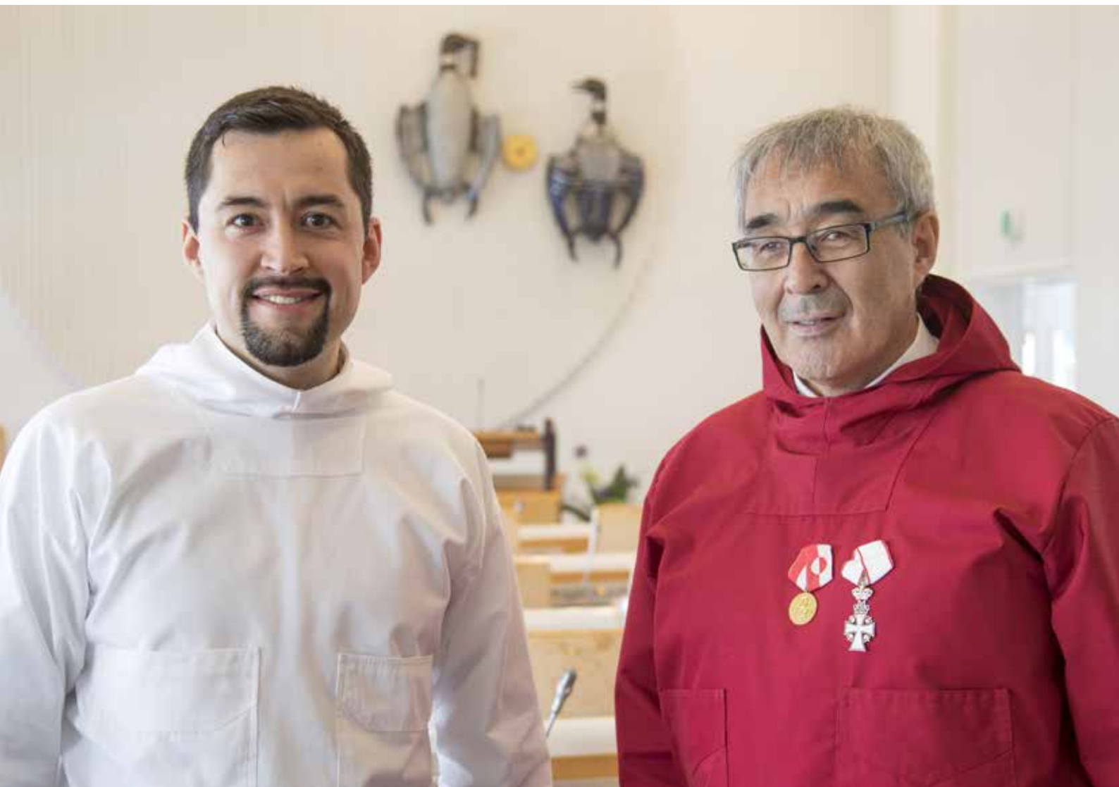
Nyvalgte Formand for Inatsisartut Hans Enoksen (th) og Formand for Naalakkersuisut Mute B Egede