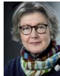
Asii Chemnitz Narup