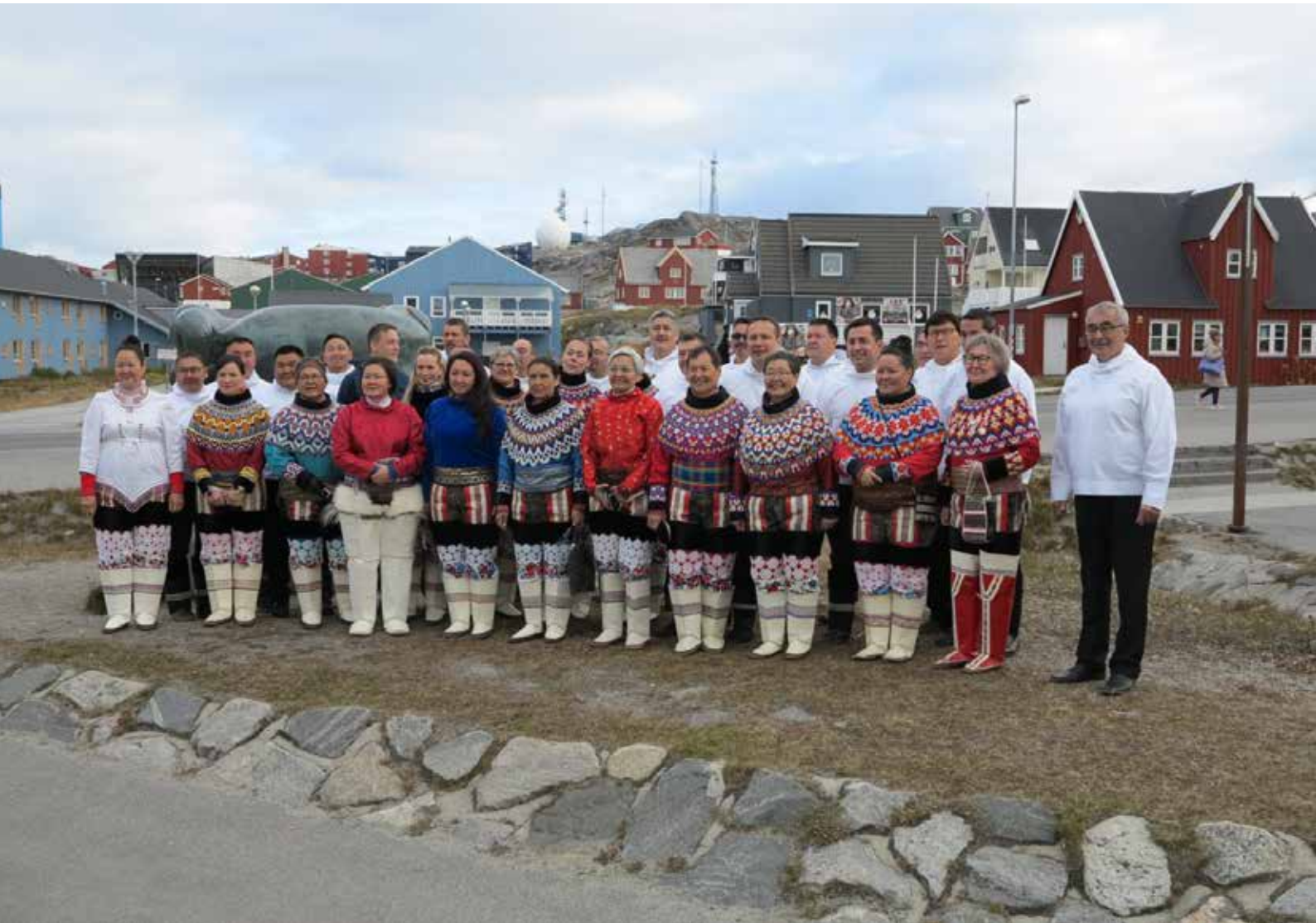
Inatsisartut til EM21 efter kirkegang ved Kaassaasuk statuen