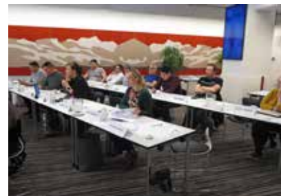
Seminar for nyvalgt Inatsisartut 28. og 29. april 2021