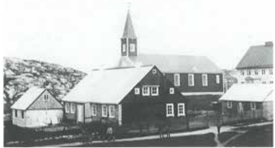
Nakkutilliisup illua 1872-imi allanngortiterlugu sananerata kingorna. Saamiatungaaniippoq illu ujaqqanik qarmagaq tassanilu Nuummi naalagarsuit ataatsimiittarsimapput.

Naalagarsuit aqutigalugit kalaallit peqataanerisigut isumaginnikkut isumagissat eqqissilluni ingerlanneqalersimagaluartut oqaatsit akimmiffiupput, tamannalu atuagassiamik ajornartorsiutitnik tamanik kalaallit oqaasii atorlugit oqalliffiusinnaasumik saqqummersitsisarnikkut aaqqiivigineqarsinnaasoq, taamaallunilu oqaatsit oqallinnikkut ineriartortinneqarsinnaassasut Rinkip neriuutigaa. Atuagagdliutit naqitat siulliit 1861-imi januaarimi saqqummerput aviisillu aqqisuisua siulleet tassaavoq ajoqiuneq ilinniartissuarmilu ilinniartitsisoq Rasmus Berthelsen.