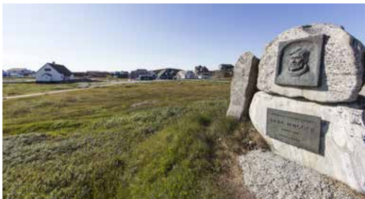
Lars Møller, "Aqqaluk" (1842-1926). Atuagagdliutini aqqissuisoq, ujaqqanik assilialortartoq assiliartassanillu titartaartoq aammalu Aqqaluup Aneerasaartarfianut atsiunneqartoq.

Taamaattumik Aqqaluup Aneerasaartarfia kulturikkut ineriartornermik aal-lartitsinermut Kalaallit Nunaannut annertuumik sunniuteqartumut attuumas-suteqarpoq. Taamaalilluni nunatsinni tamat oqartussaaqataanerat Aqqaluup Aneerasaartarfiani pinngorpoq, tassanilu nunatta Inatsisartuisa inissisimanis-saat pissusis-samisoorluni.