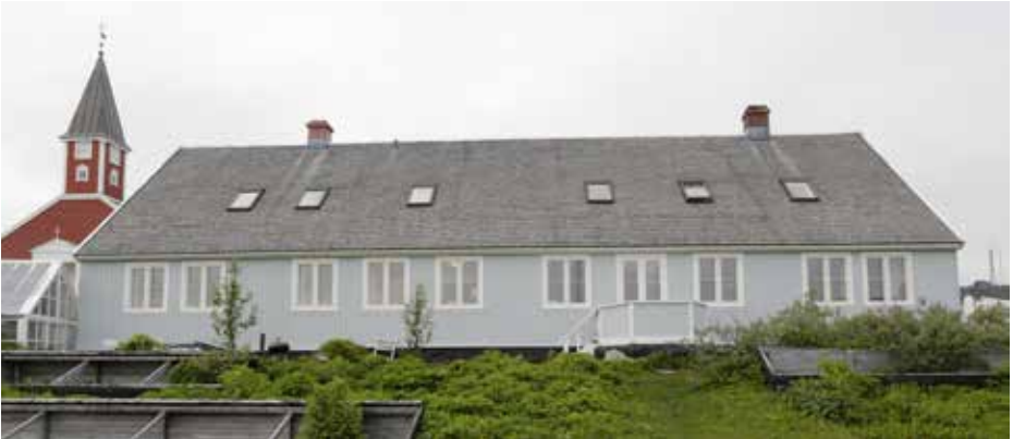
Naalagaaffiup sinniisuata maanna illua Nuummi naalagarsuit siunnersuisoqatigiivisa aammalu Kujataata Landsrådiata ataatsimiittarfittut atuussimavoq (ukiuni 1831-33-mi sananeqarpoq).

Kalaallit Nunaata inatsisartoqarnikkut oqaluttuarisaanera 1857-imi aallartip-poq, tamatumani naalagarsuit siunnersuisoqatigiivi siullit Nuummi pilersinneqarlutik. Naalagarsuarnut tunngavigineqarpoq siunnersuut ilaatigut nakkutilliusup Rinkip ilinniarfissuarmilu ilinniartitsisup Kleinschmidt 1856-imi nunami namminerministeriaqarfimmut nassiusaat – ukiullu tamatuma kingorna Kujataani misigutaasumik aallartinneqarput. Naalagarsuit ajoqersuiartortitaq siulittaasoralugu atorfilittanik danskinik aammalu nunap immikkoortuani najugaqarfinit tamanit piniartumik ataqqisamik ataatsimik inuttaqarlutik siunnersuisoqatigiittut atuuttussatut pilersinneqarput. Nunatsinni nunap immikkoortuini ingerlatsisutut najukkami aaqqiagiinngissutit isumaginninnermilu ajornartorsiutit isumagisassaraat, taamaalillutillu nunatta imminut aqunnialersaalernerani tunngavissiusaallutik. Rinkip taamaalilluni neriutigaa kalaallit politikikkut inerikkiartormikkut innuttaasut inuuniarnikkut atukkamikkut qaffariaateqassasut, taamaalillunilu namminersulernissamut tamallu oqartussaaqataanerannut ineriartorneq aallarnerneqarsinnaassasoq.