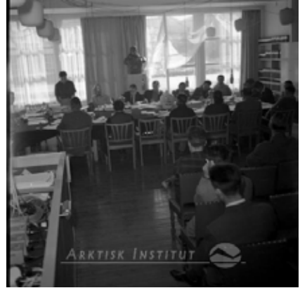
1961-imi Landsråði Indaleeqqap Aqqutaani illu aappaluttumi ataatsimiittoq.

Landsråði 1953-imit Indaleeqqap Aqqutaani illumi barakimut assingusumi ataatsimiittarpoq, tassani inissaqartinneqarlutik landshøvdingi, kæmnerip allaffia (illoqarfimmi aqutsisut) aammalu Landsråði. Ataatsimiittarfik eqqartuussivittut aamma atorneqarpoq.