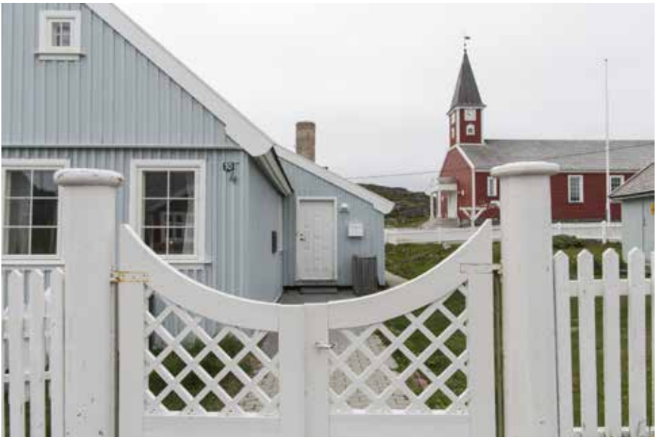
Landfogedip illuanut isaariaq.

Landsrådip ataatsimiittarfia nutaaq illullu allissutaa 1925-mi nalliuttorsiorpa-laartumik atoqqaarfissiorneqarput aammalu landsrådip illumi ataatsimiinnera siullesq ukiuni tullermi ingerlanneqarpoq. Illumi landsrådip ataatsimiittarfia ukiuni 11-ni atuuppoq. 1937-mi Kujataata Landsrådia aqquserngup illuatungani illumut nutaamik sananeqartumut nuunneqarpoq.