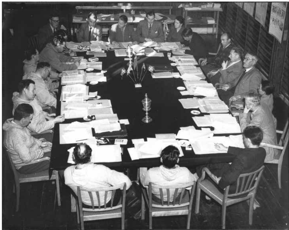
Landsrádi innuttanit 1951-imi siullerpaamik qinerneqartoq Ilinniarfissuup eqaarsaartarfiani.

Landsrádi ataatsimoortinneqartoq maanna 13-inik ilaasortaqalerpoq aammalu 1953-imi Indaleeqqap Aqqutaani illutanut barakinut assingusunut nuunnissani tikillugu ataatsimiinnini siulliit Ilinniarfissuup eqaarsaartarfiani ingerlappai.