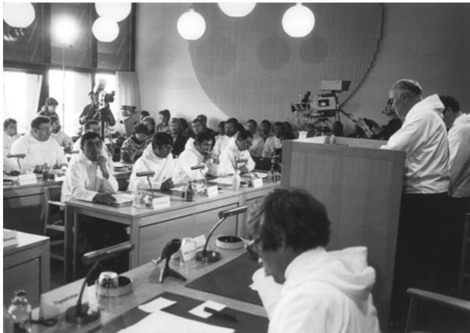
Inatsisartut ataatsimiittarfiat 1984-imi.

Inersuaq ullumikkut inissaaleqiffiuvoq aammalu oqallinnerit nalaani assut inisakillioortoqartarluni, oqallinnerit ukiut ingerlanerini avataaneersunit eqqu-maffiginerujartuinnarneqarlutik, taamaalillunilu tusagassiortunit, tikeraanit nunanit allaneersunit innuttaasunillu piffimmi toqqaannartumik malinnaasin-naasariaqartunit soqutigineqaleraluttuinnarluni.