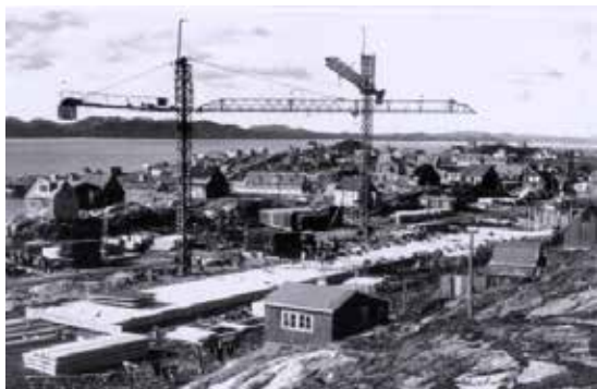
1966/67-imi allaffeqarfimmik ilaatigut Landsrådip illutassarisaanik tamakkiisumik sananeq aallartinneqarpoq. Asseq: Ilisimaneqanngilaq.

Ukiumi tassani allaffeqarfimmik nutaarluinnarmik sananissaq aallartinneqarpoq, taanna naammassillugu sananeqareeruni landsrådimut ataatsimiittarfeqarluni landsrådip allattoqarfianut kiisalu landshøvdingeqarfiup nuna tamakkerlugu allaffeqarfianut inissaqartussa. Sanaartortitsisuuvoq Ministeriet for Grønland. Illu siulleq taaguuteqartinneqartoq "Bygning B" nunatami Nuup saavata Nuullu nutaap tungaanut ikaarsaararfiusumi inissinneqarpoq. Illu allaffeqarfimmi 2012-imi Nuuk Centerip illutaata sananeqarnissaata tungaanut Namminersorlutik Oqartussat qitiusumik allaffeqarfiata illutaasa siullersaraat.