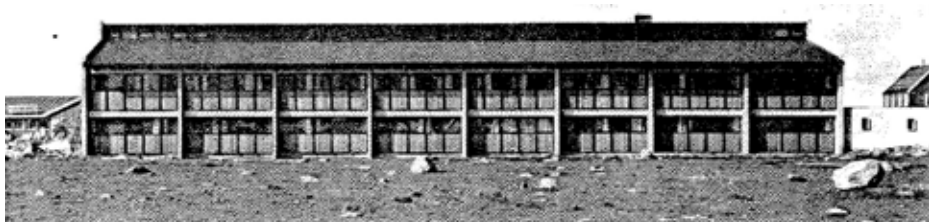
1966/67-imi allaffeqarfimmik tamakkiisumik sananeq aallartinneqarpoq, siullerlu tassaalluni "Bygning B".

Taamaakkaluartoq Landsrådip allaffeqarfimmi nutaami inissinneqarfissaminut nuussinnaanissaata tungaanut ukiut arfineq pingasut ingerlapput. Isumaginninnermut Suliffeqarnermullu Pisortaqarfimmi suliassat 1970-imi Landsrådimut tiguneqarmata Mestervejimi allaffeqarfimmi inissat amerlanerusut pisariaqartinneqalerput, taamaattumillu ilaasortat illoqarfinnit allaneersut Hotel Godthåbimi inissinneqartalerlutik aammalu Landsrådip ataatsimiittarneri illoqarfimmi sumiiffinni assigiinngitsuni, Landsrådip 1975-imi Mestervejimit Landsrådip ataatsimiittarfianut ("Bygning G") nuunnginnerani ilaatigut Hans Egedep oqaluffiani ilagiiit ataatsimiittarfianni aammalu atuarfiup ASK-ip (Atuarfik Samuel Kleinschmidt) eqaarsaartarfiani ingerlanneqartarlutik.