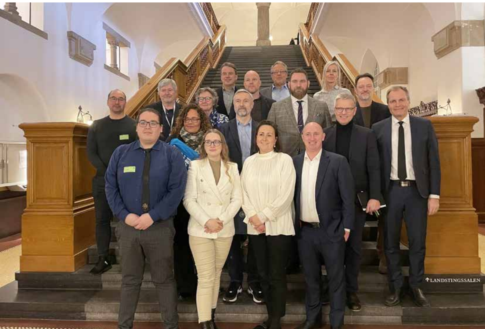
Christiansborg den 31. januar 2023: Inatsisartuts Lovudvalg sammen med Folketingets Grønlandsudvalg og Retsudvalg. Medlemmer af Erhvervs- og Råstofudvalget sammen med 3 medlemmer af lokaludvalget.