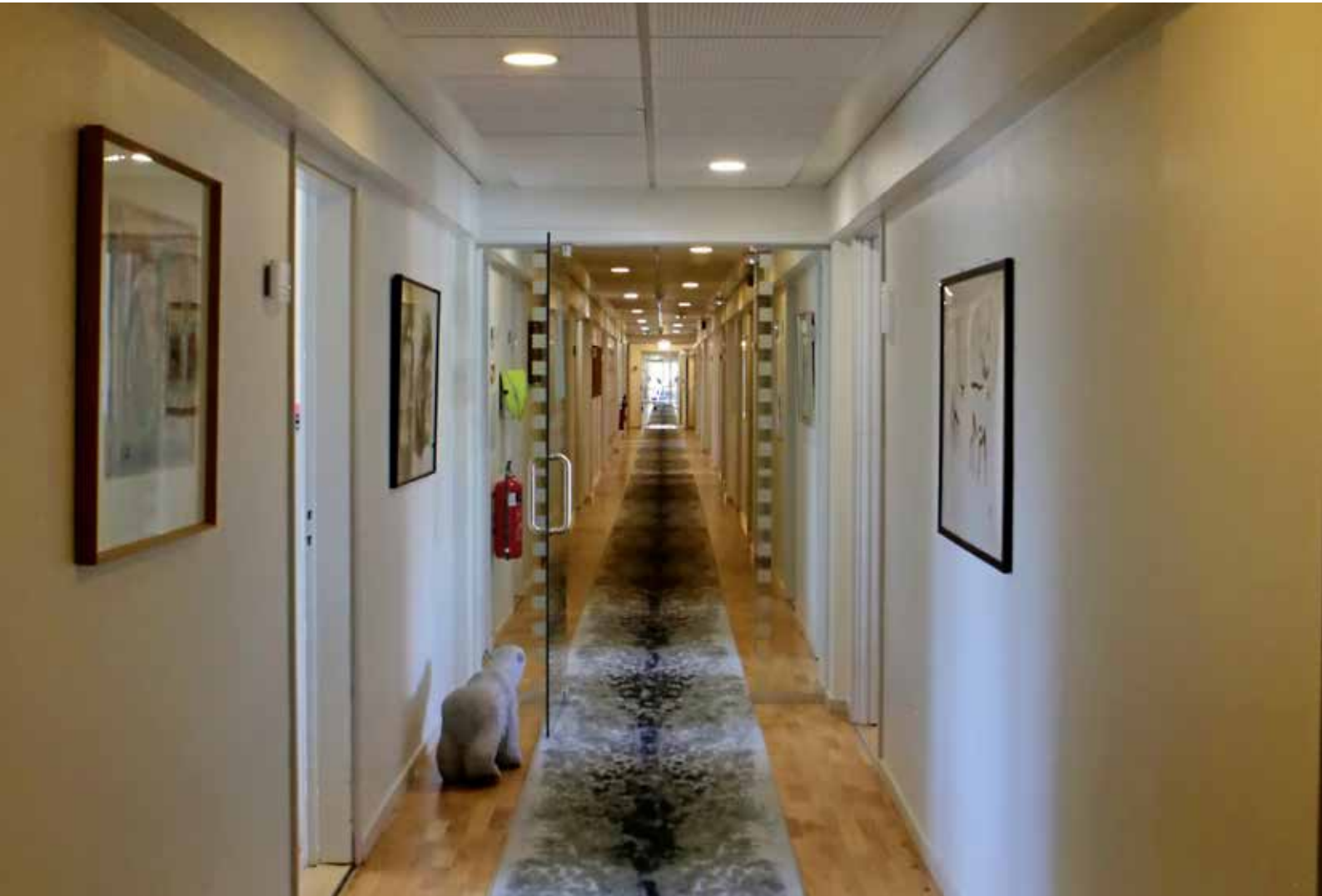
Bureauet for Inatsisartut, administrations kontorer.