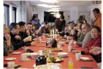
Inatsisartuts og Naalakkersuisuts julehygge.