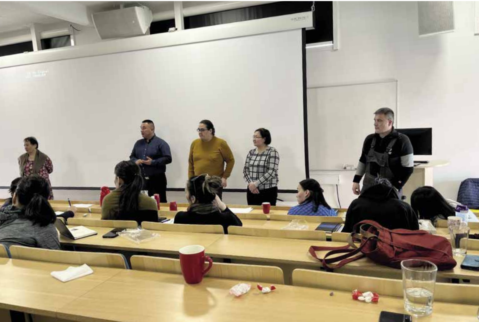
Oplæg ved formandskabsseminar i auditorium i Socialpædagogisk Seminarium (SPS) i Ilulissat.