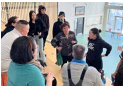
Demokratidag i Ilulissat.