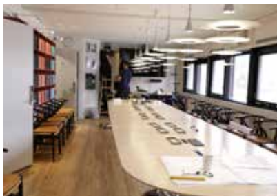
Udskiftning af tolkeudstyr i mødelokalene.