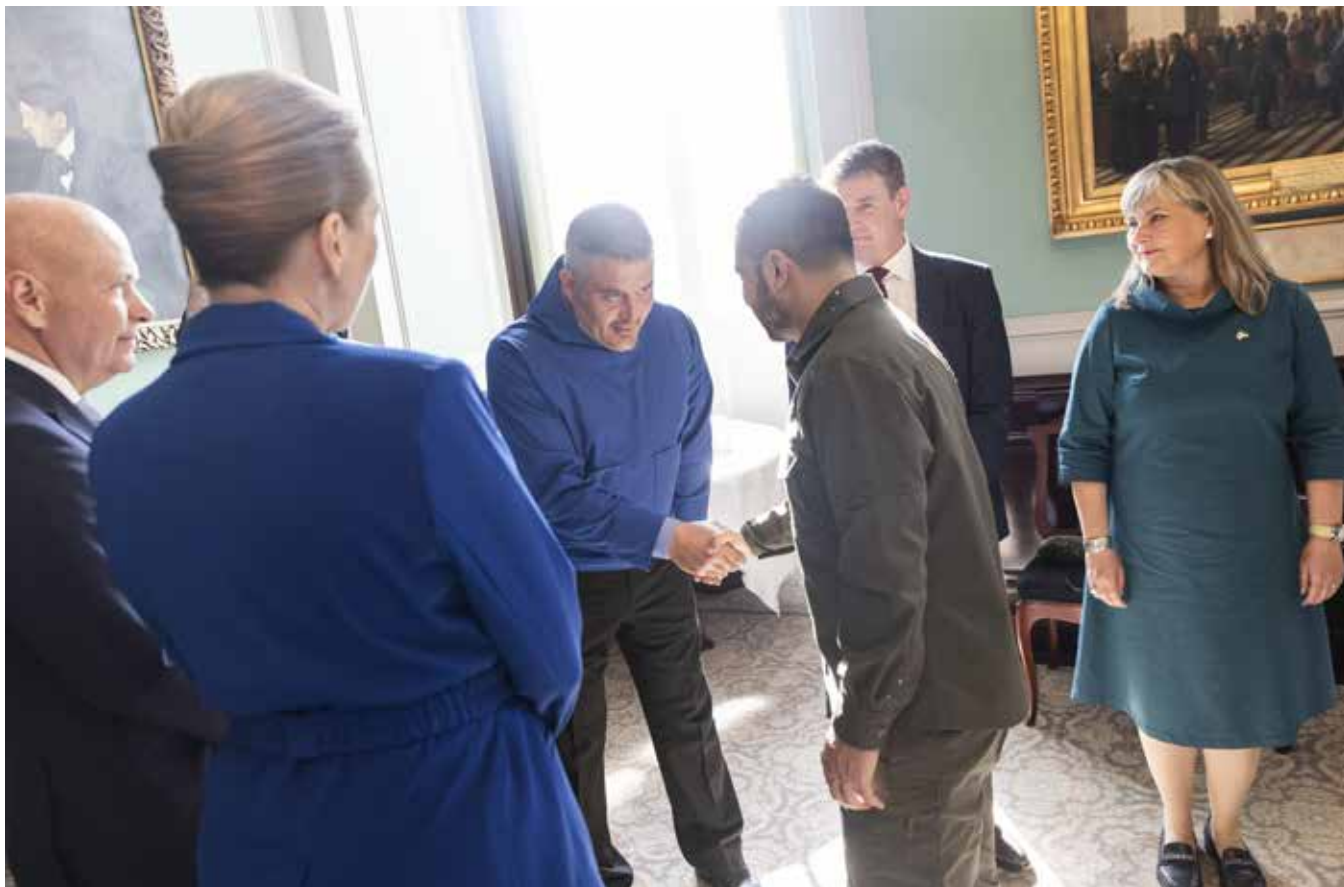
Formanden for Inatsisartut Kim Kielsen møder Ukraines Præsident Volodymyr Zelenskyy.

Formanden for Inatsisartut Kim Kielsen deltager ved Ukraines Præsident Volodymyr Zelenskyy's besøg i Folketinget.