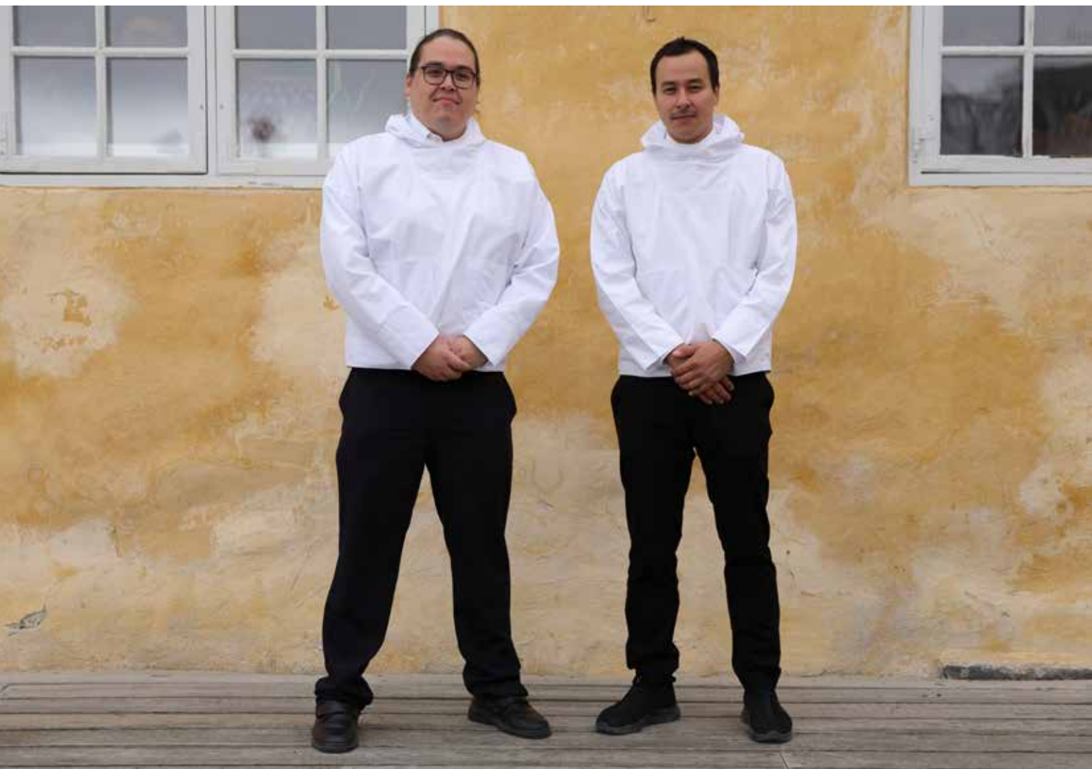
Atassut partigruppe 22. september 2023.