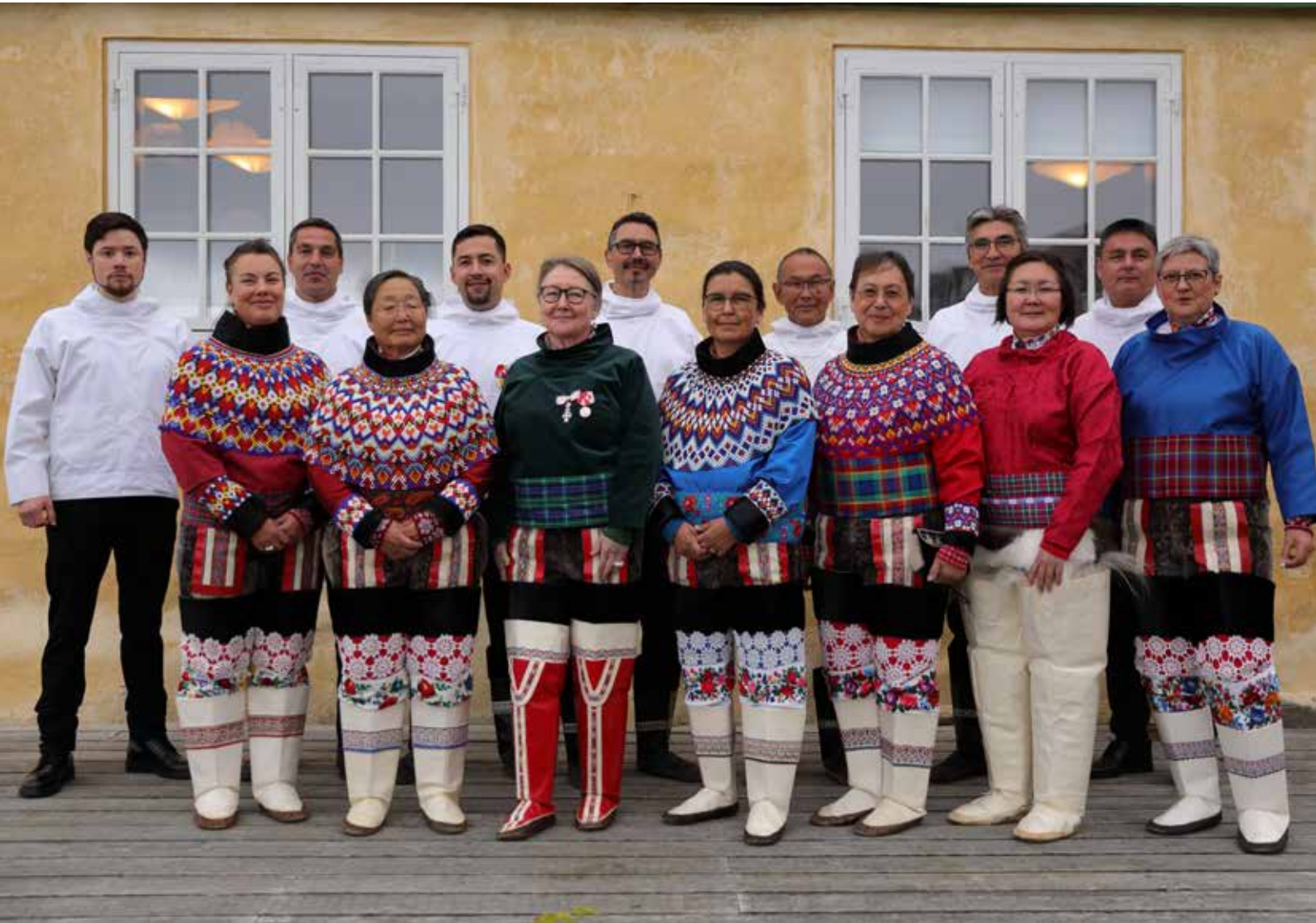
Inuit Ataqtigiit partigruppe med medlemmer af Naalakkersuisut 22. september 2023.