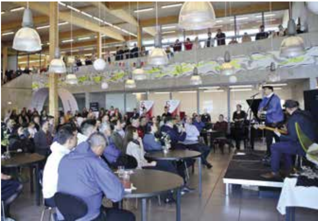
Tunggavik 28. april 2023