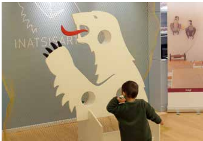
Kulturnat 21. januar 2023