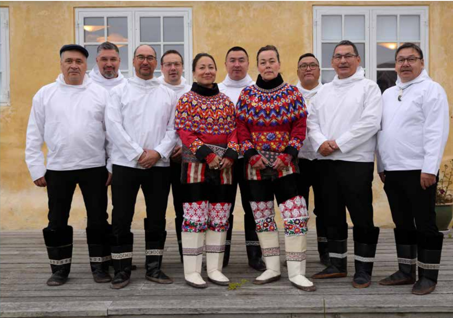
Siumut partigruppe med medlemmer af Naalakkersuisut 22. september 2023.