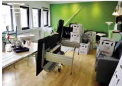
Formandens kontor flyttes.