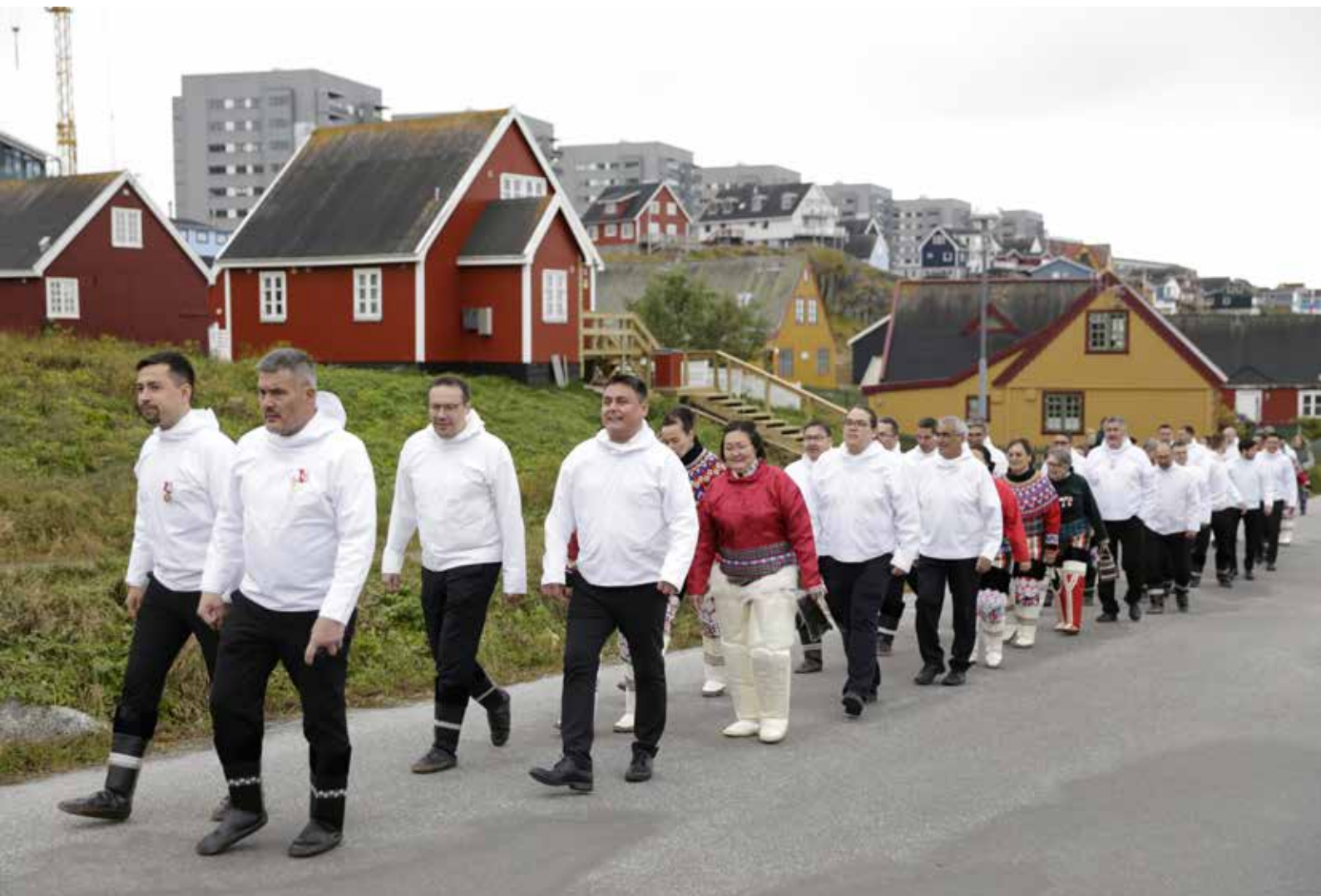
Inatsisartut ved åbningen EM 2023.