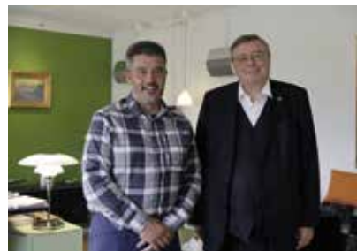
Formanden for Inatsisartut Kim Kielsen sammen med Tysklands ambassadør.