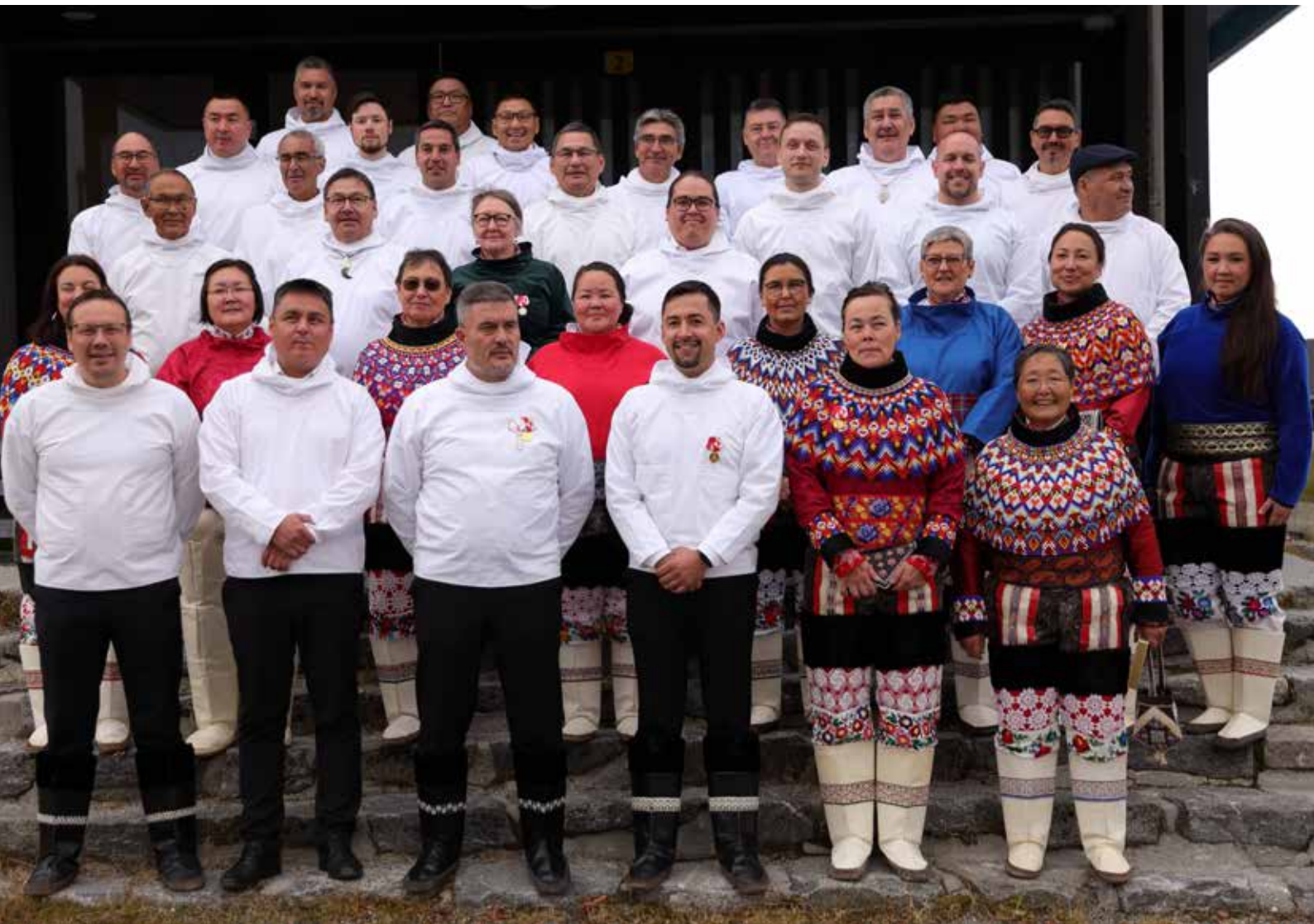
Inatsisartut og Naalakkersuisut 22. september 2023.