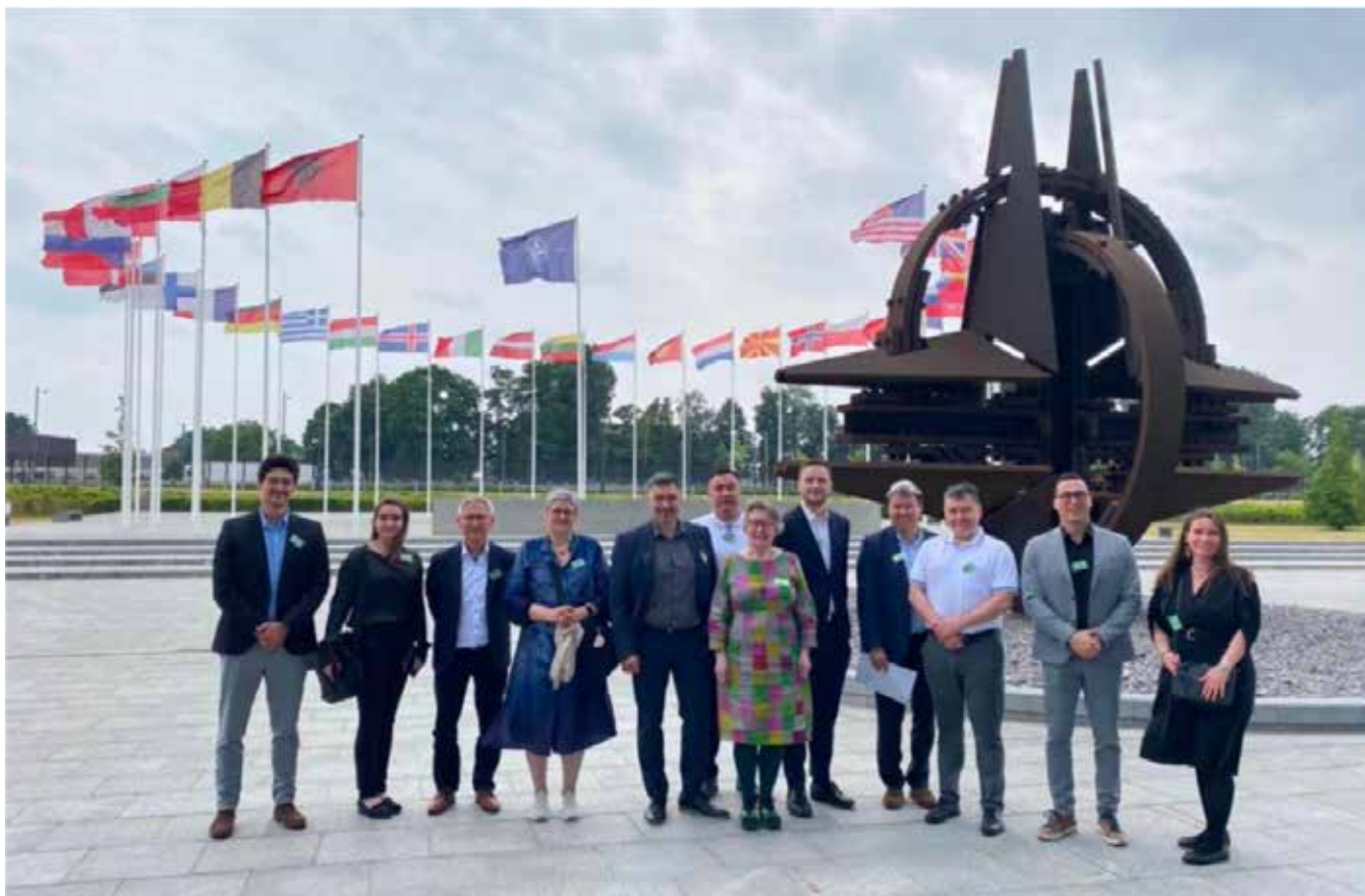
Finansudvalget ved NATO's hovedkvarter.