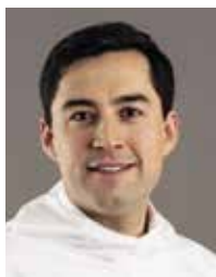
Múte Bourup Egede