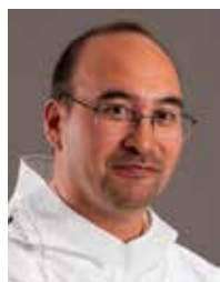
Mala Høy Kúko