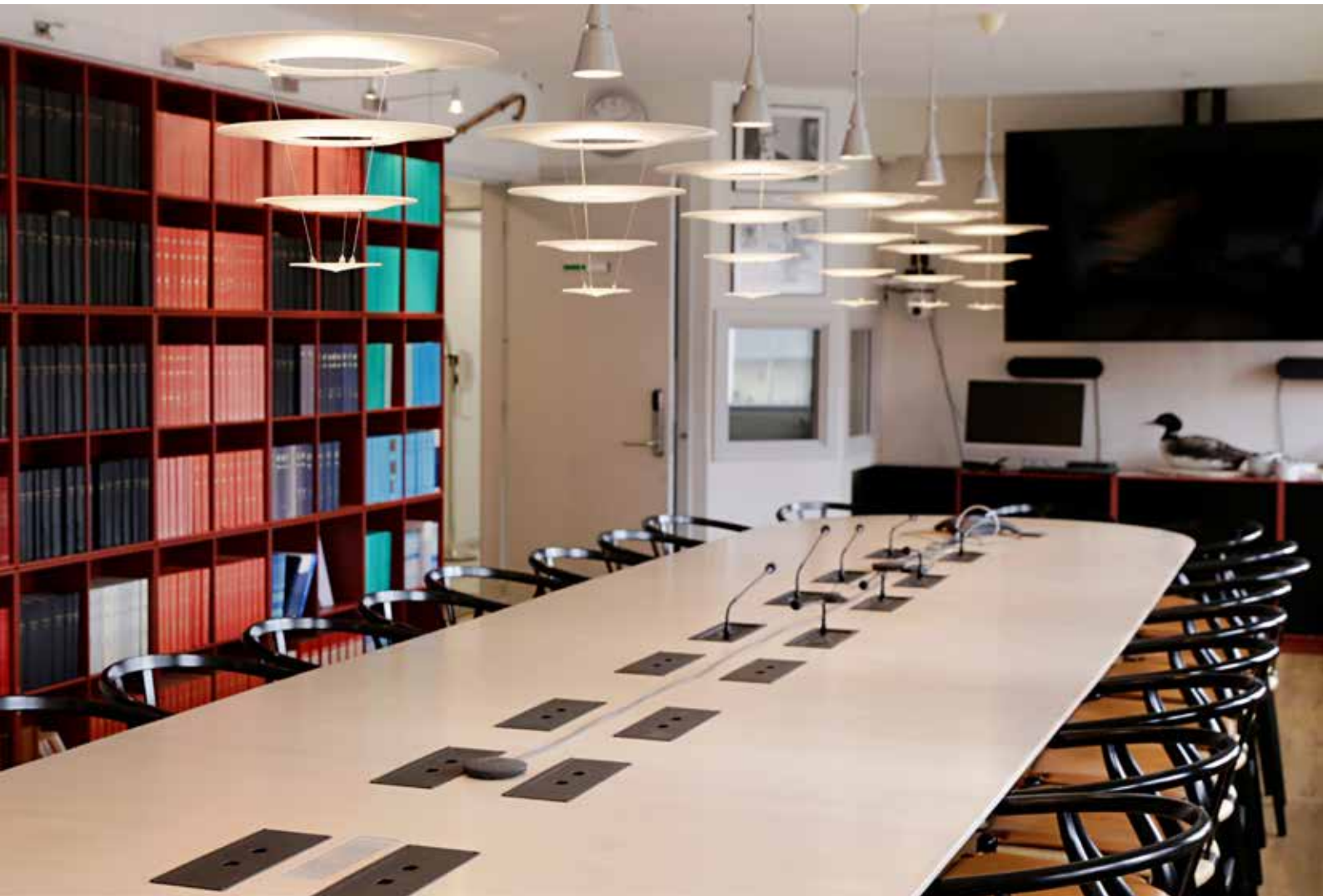
Nyt tolkesystem i Erling Høegh mødelokalet.