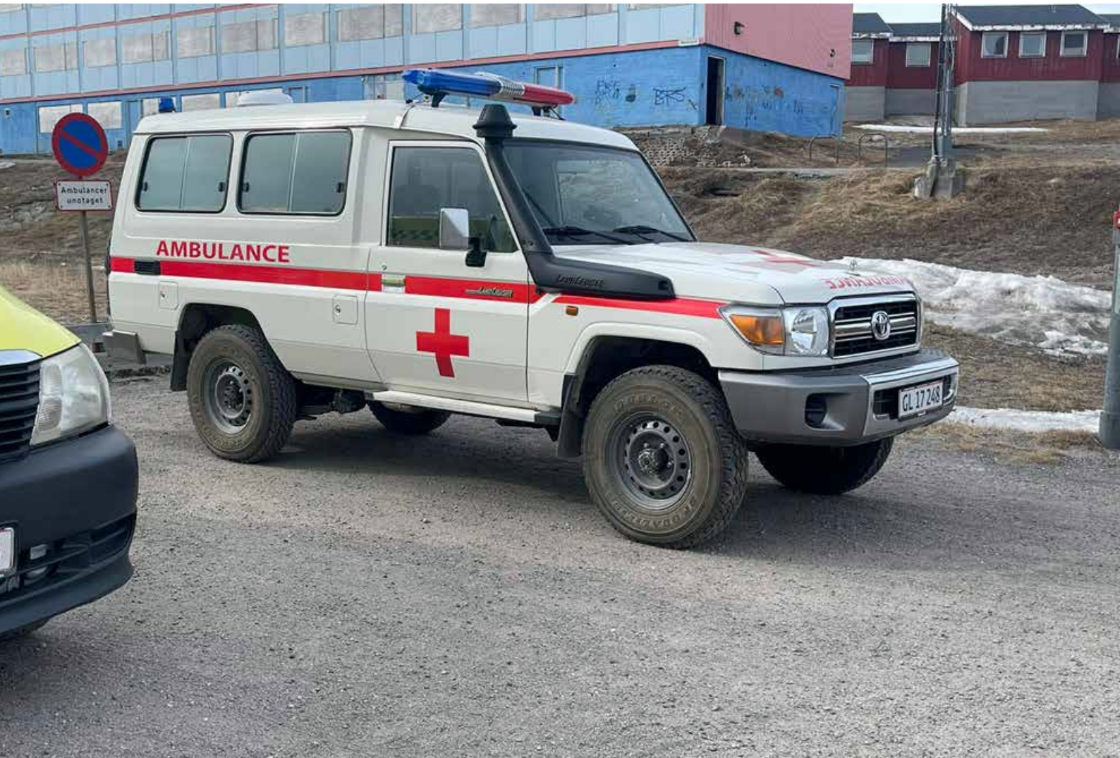
Ambulance i Narsaq.