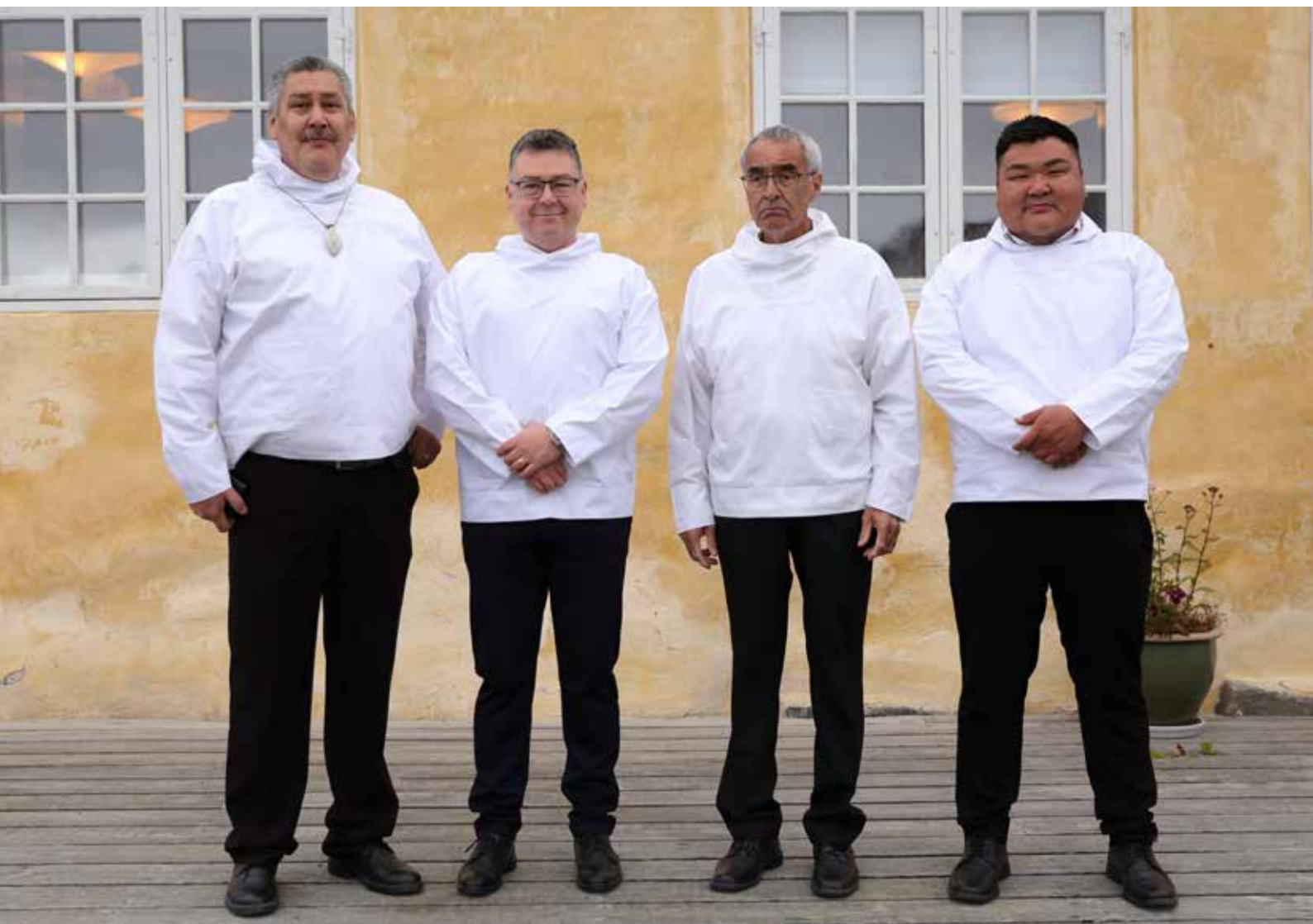
Naleraq partigruppe 22. september 2023.