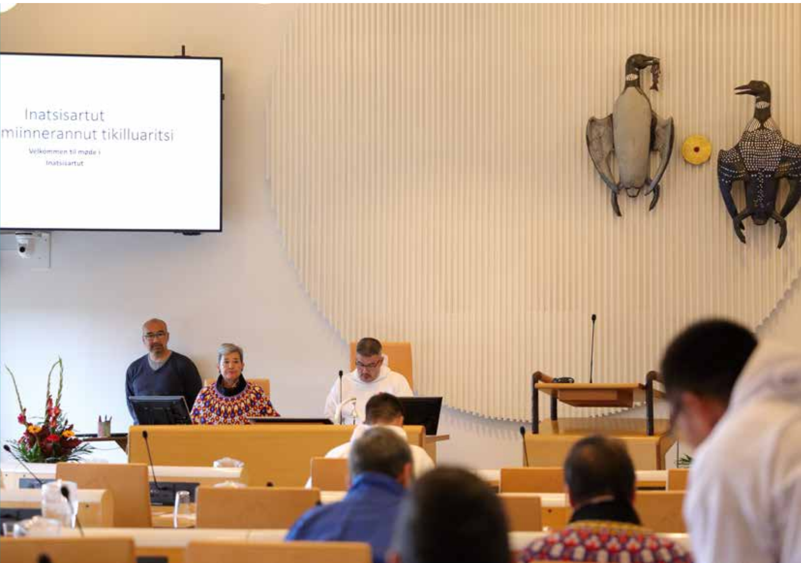
Mødets åbning i salen 22. september 2023.