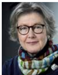
Asii Chemnitz Narup