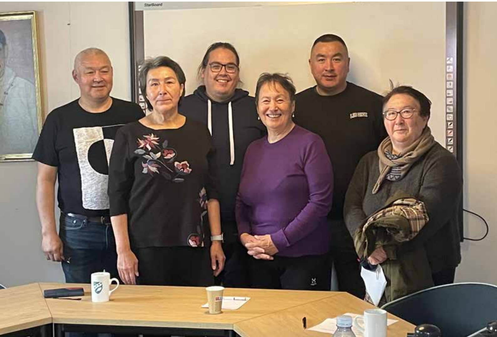
Medlemmer af Erhvervs- og Råstofudvalget på besøg hos Uummannaq Børnehjem