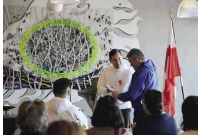
Tunggavik 28. april 2023