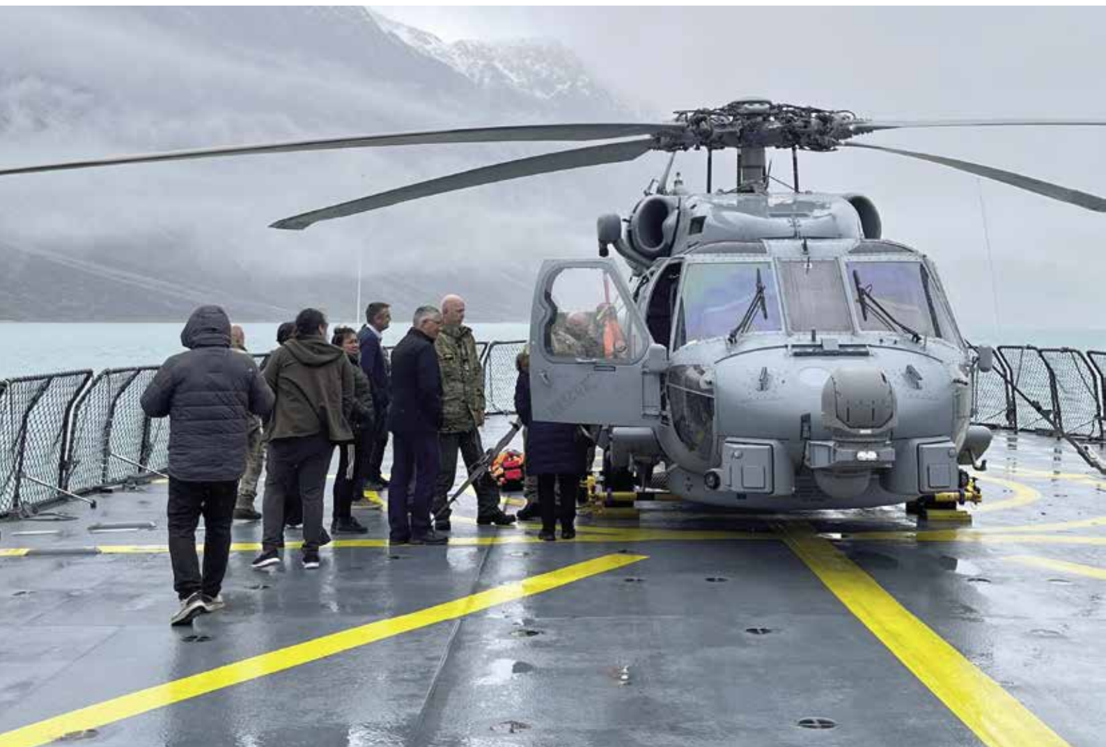
Formandskabet med Folketingets præsidié på dækket af skibet Vædderen.