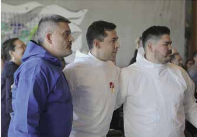
Tunggavik 28. april 2023