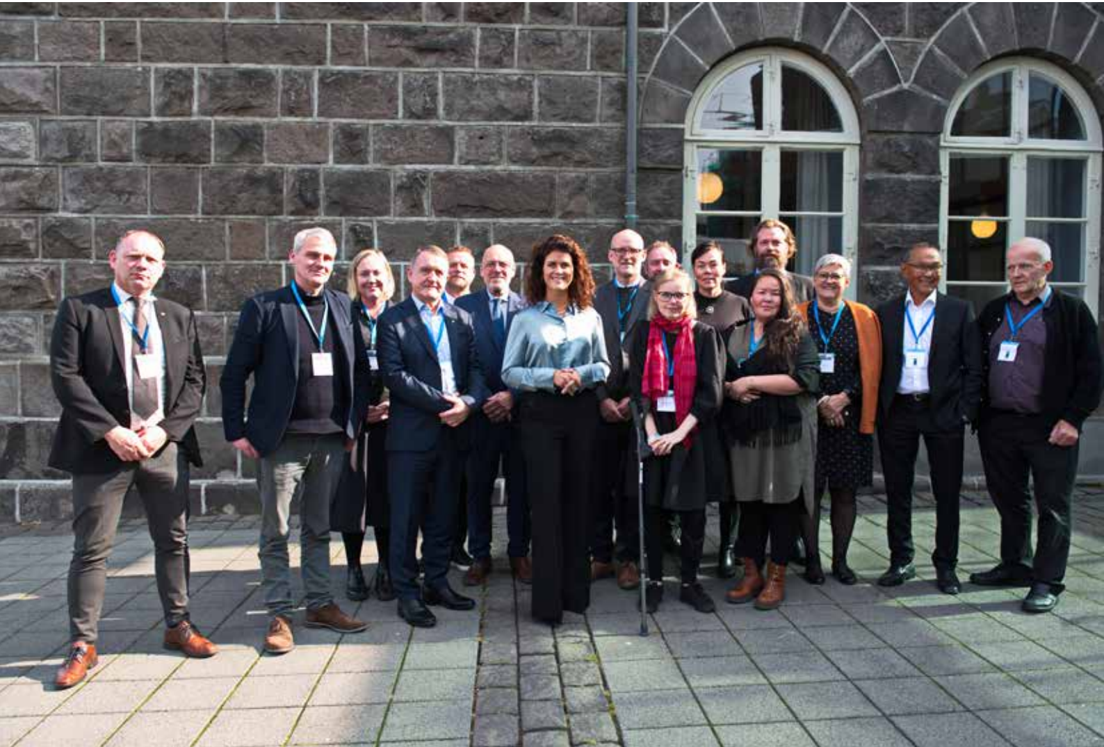
Vestnordisk Råd medlemmer og de vestnordiske udenrigsministre til Vestnordisk Råds 39. årsmøde i Reykjavík.