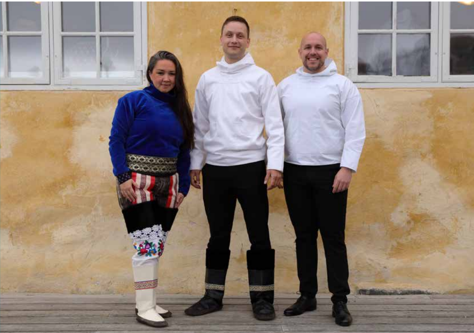
Demokraterne partigruppe 22. september 2023.