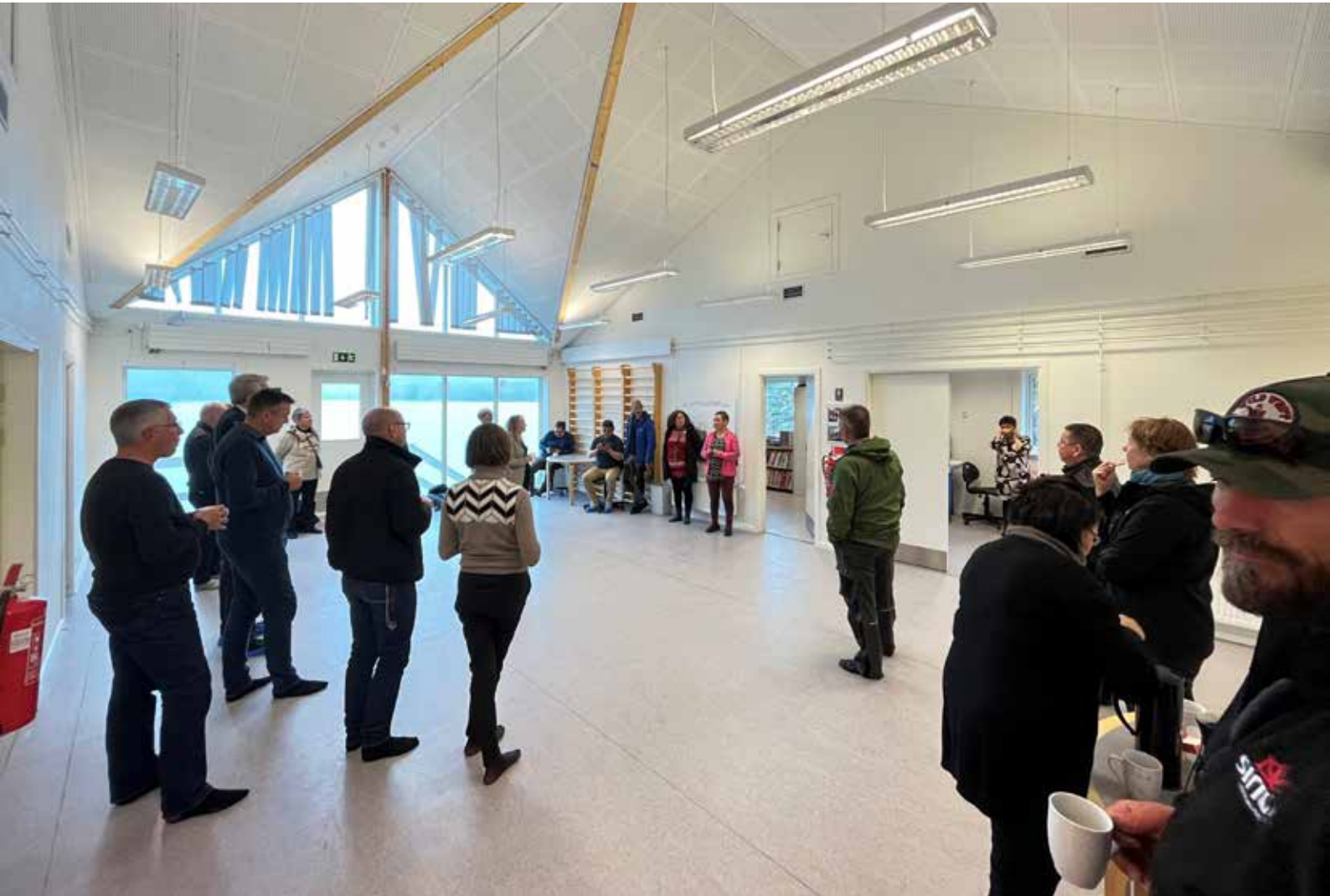
Formandskabet og præsidiets besøg på folkeskolen i Sarfannguit.