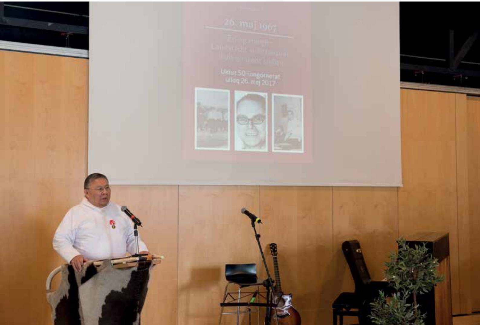
Inatsisartut siullittaasuata Lars-Emil Johansenip nalliuttorsiuallaarneq ammarlugu oqaaseqarnermini Erling Høeghip siullittaasutut innuttaasut qinigaattut siullertut maligassiuusiusimanera erseqqissarpaa.