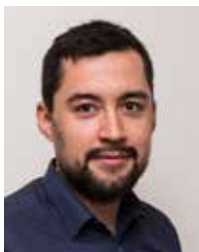
Múte Bourup Egede