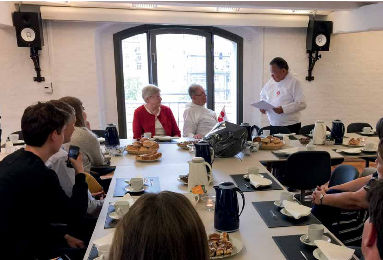
Ulloq 5. september Landsráðimi ilaasortasimasooq Oluf Høegh Kalaallit Nunaanni naalakkersuinnikkut piffissami sivisuumi tunnusi-malluni suliaqarsimanagera pillugu Københavniimi kuultiusumik Nersornaaserneqarpoq.