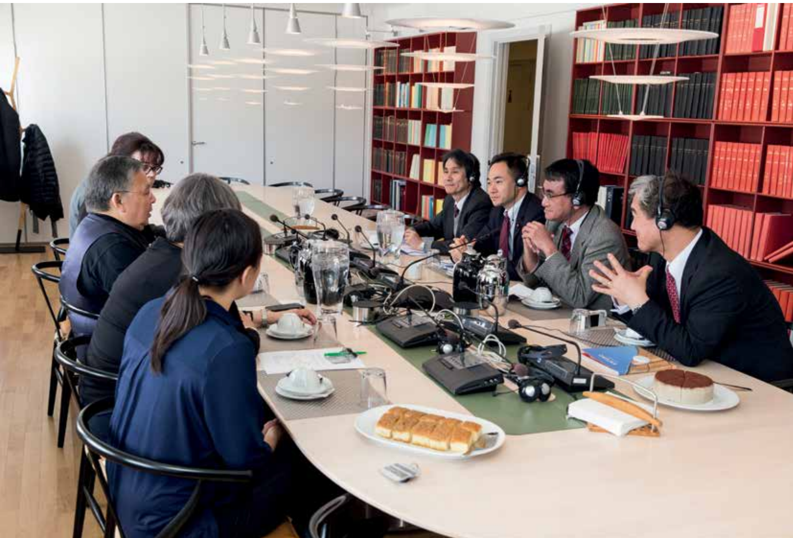
Ulloq 1. maj: Japanimi inatsisartunut ilaasortaasunik Tarō Kōnomik aamma Keisuke Suzukimik ataatsimeeqateqarneq.