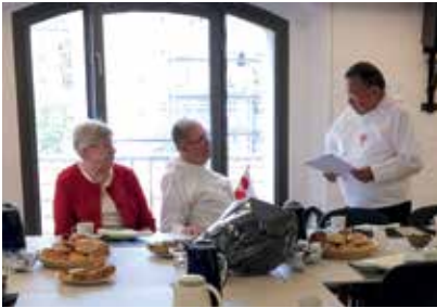
Landsrådimut ilasortaasimasoq Oluf Høegh kuultiusumik nersornaaserneqartoq