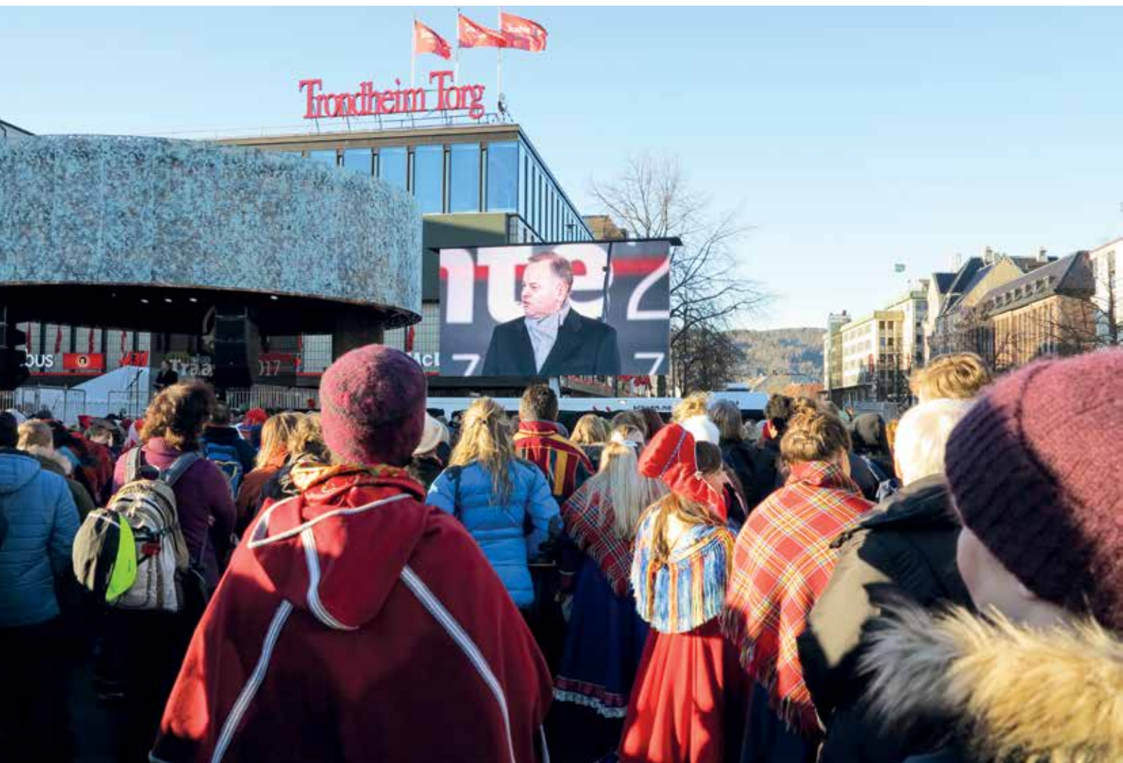
Ulloq 6. februar: Norgemi Trondheimimi Saamit ukiut 100-nngortorsiorlugit nalliuttorsiornerannut "Tråante 2017"-imut Siulittaasoqarfik peqataavoq.