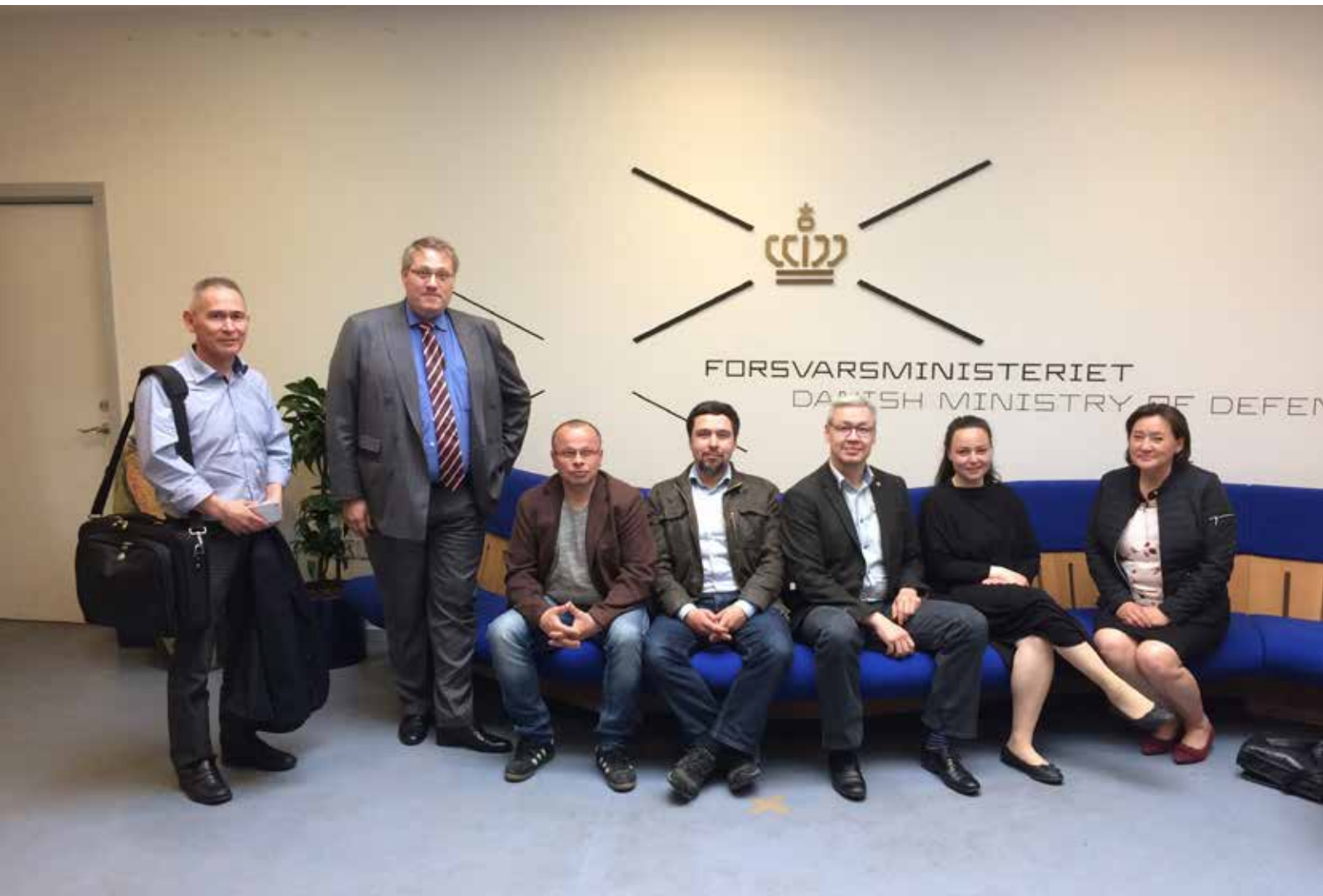
Ulloq 16. Juni Sanaartornermut Ataatsimiititaliamit aallartitat pingasut Aningaasaqarnermut Akileraartarnermullu Ataatsimiititaliamit aallartitat marluk peqatigalugit illersornissamut ministeriaqarfimmi ataatsimiinnermi peqataanissamut qaaqusaapput.