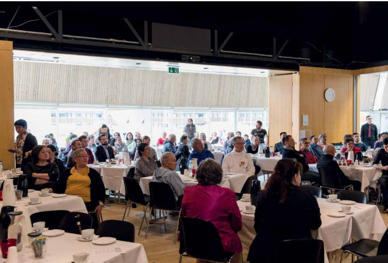
Ukiunik 50-inngortorsiornermut inuit untritillit missaat takkupput.