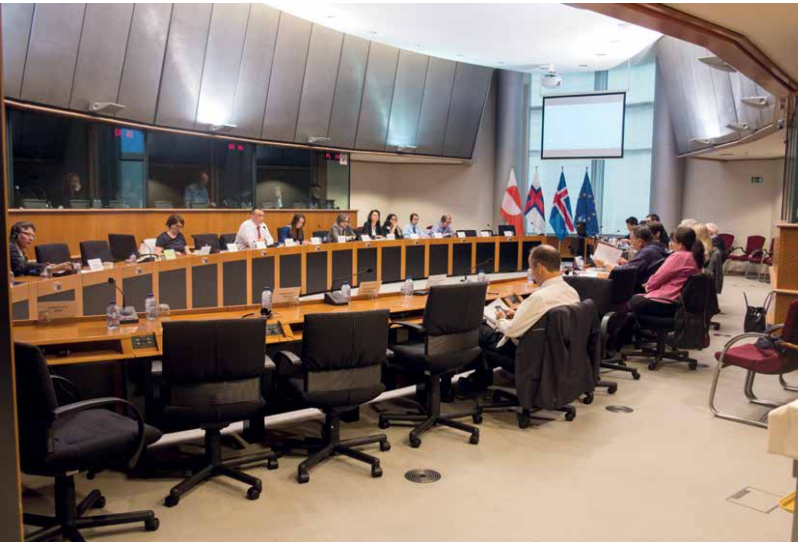
Ulloq 28. Juni: Nunat Avannarliit Killiit Siunnersuisoqatigiiffiata siulittaasoqarfia Bruxellesimi ataatsimiippoq Europa- Parlamentilu ataatsimeeqatigalugu.