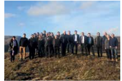
Nunat Avannarliit Killiit Siunnersuisoqatigiiffiat Reykjavíkimi ukiumoortumik ataatsimiittoq