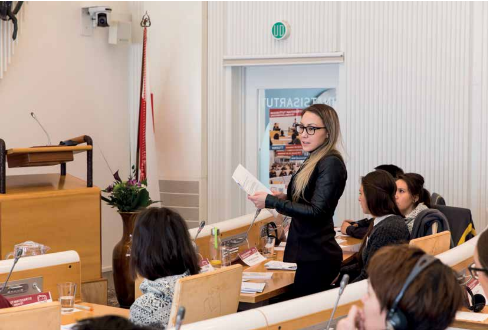
Inuusuttut Inatsisartui ulluni pingasuni eqimattakkaarlutik suliaqareerlutik Inatsisartut ataatsimiittarfianni katersuupput.