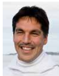
Aqqaluaq B. Egede