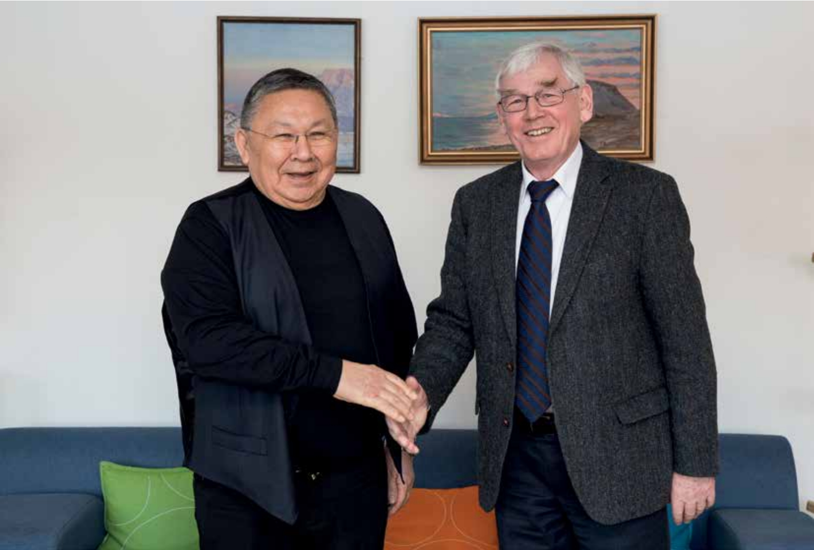
Ulloq 22. februar: Danskít EU-kommisærerisimasaannik Poul Nielsonimik ataatsimeeqateqarneq.