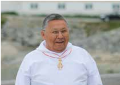
Inatsisartut Siulittaasuut Lars Emil Johansen