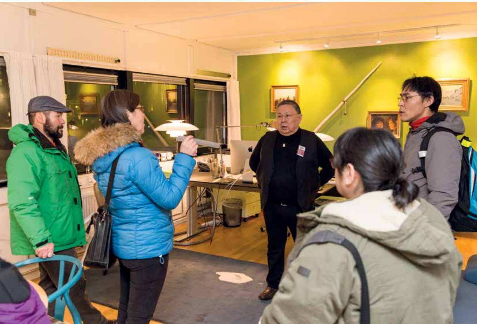
Siulittaasup allaffiani pulaartut.