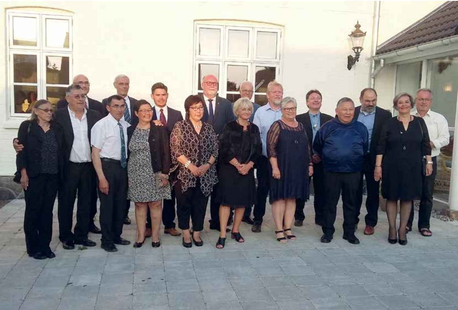
Ulloq 29. august: Siulittaasoqarfiup Folketingillu Siulittaasoqarfiata akornanni attaveqaatitut ataatsimiititaliap Samsømi ataatsimiinnera.