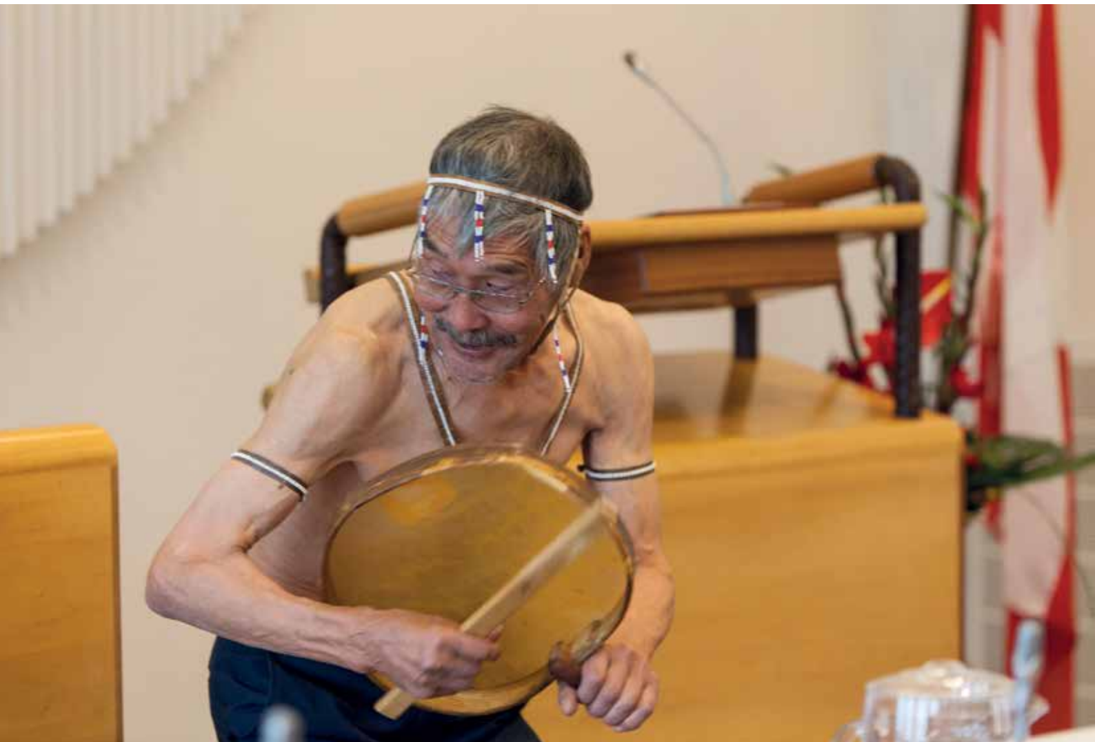
Ulloq 22. september: Ukiakkut ataatsimiinneq qilaatersornermik siullerpaamik aallarnerneqarpoq.