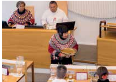
Ukiakkut ataatsimiinneq qilaatersornermik siullerpaamik aallarnerneqarpoq