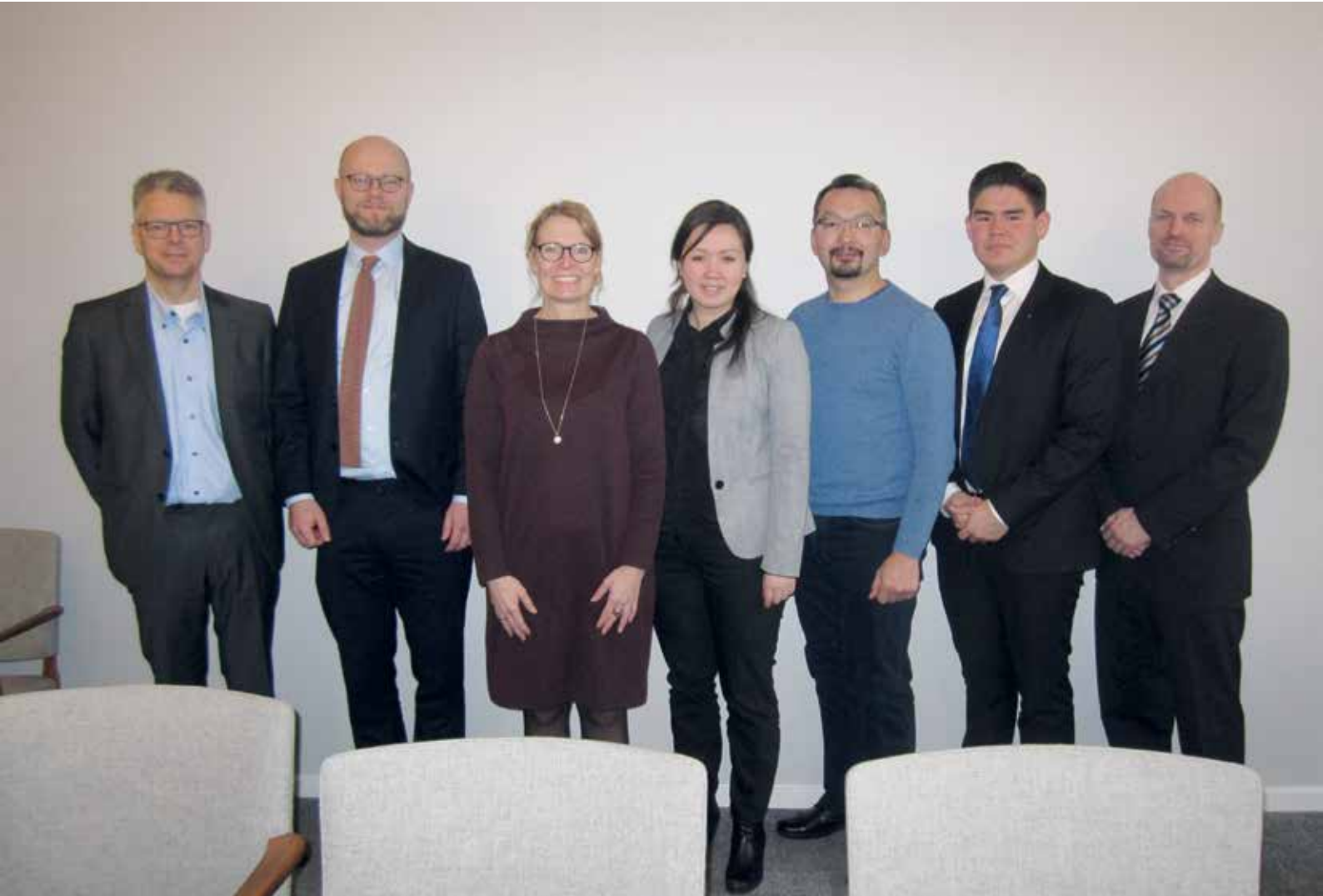
Ulloq 31. januar: Kukkunersiuinermut Ataatsimiittitaliaq K benhavnimi naalagaaffiup kukkunersiuuinut pulaarpoq.