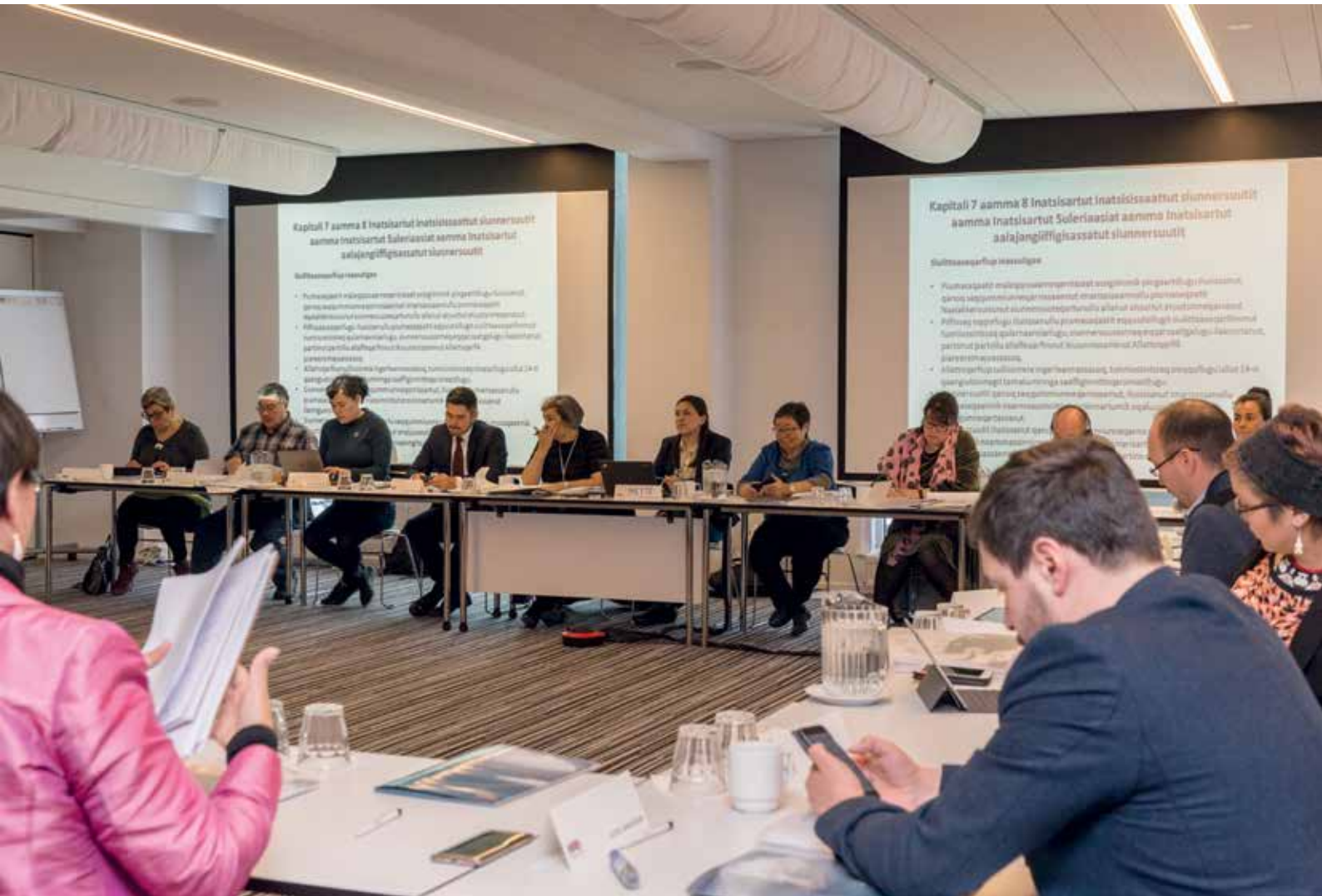
Ulloq 10. november: Siulittaasoqarfik Inatsisartunut ilaasortat peqatigalugit Inatsisartut suleriaasiat pillugu Hotel Hans Egedemi isumasioqatigiissitsivoq.