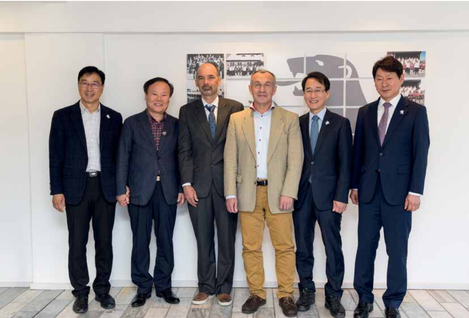
Ulloq 24. juli: Inatsisartunit aallartitat Koreamiut Inatsisartuinut ilaasortanik ataatsimeeqateqarnerat.