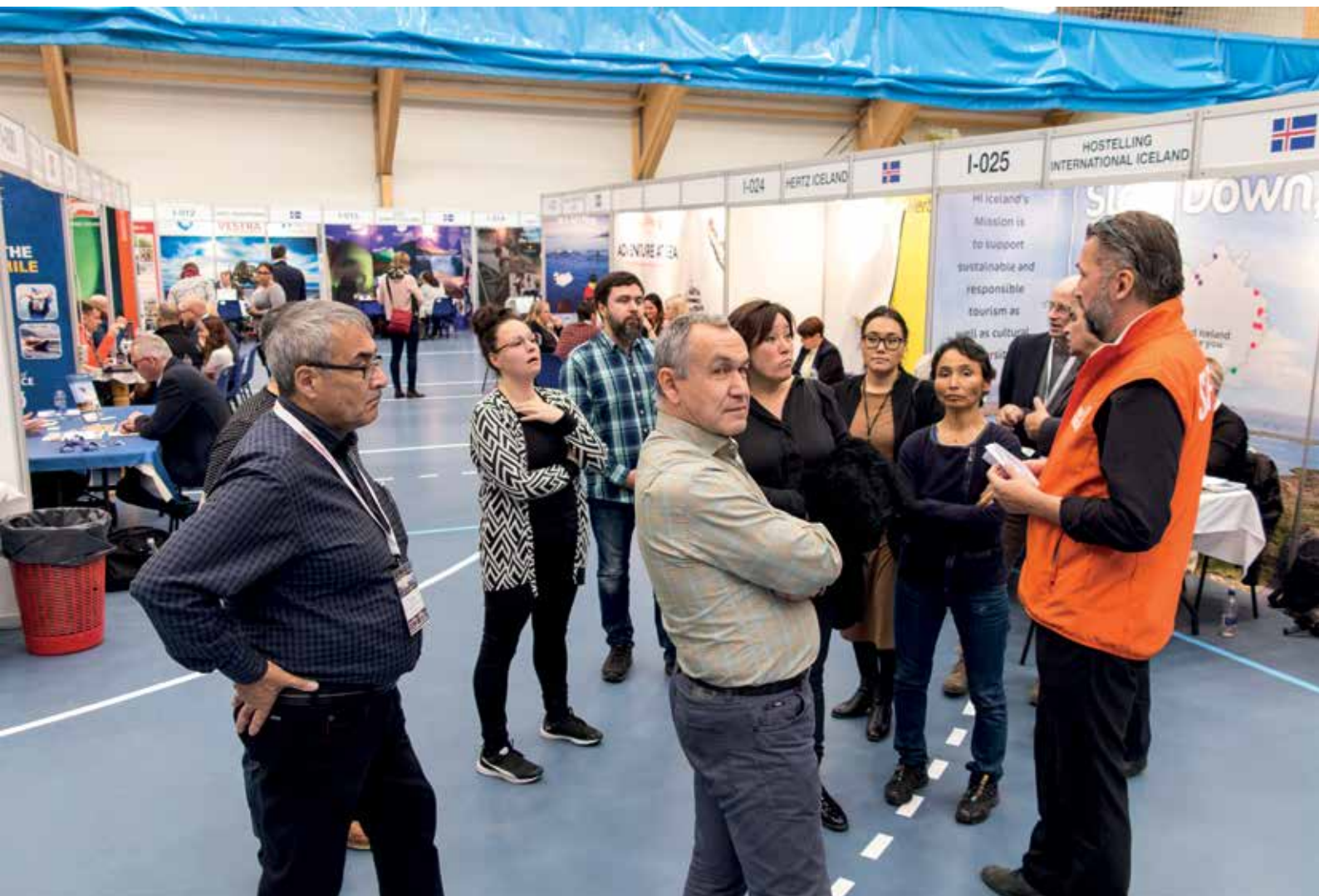
Nummi ulloq 20. september nunani avannarlerni killerni takornariartitsineq pillugu ataatsimeersuarneq Travel Mart Inuusutissarsiornermut Aatsitassanullu Ataatsimiititaliap peqataaffigaa.