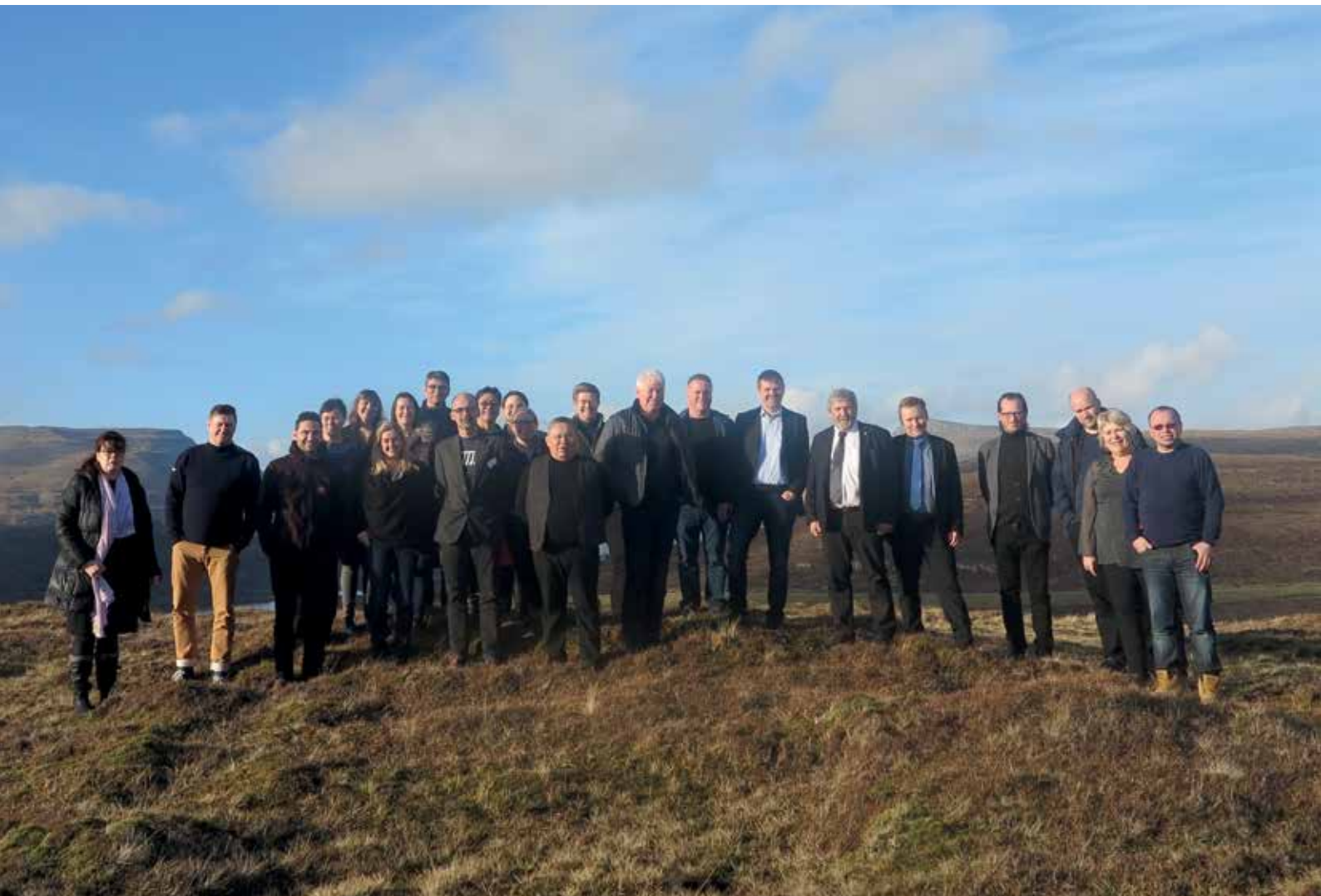
Nunat Avannarliit Killiit Siunnersuisoqatigiiffiata Tórshavnimi ulluni 25.-27. februar aalajangersimasumik qulequtaqarluni ataatsimeersuarnera.