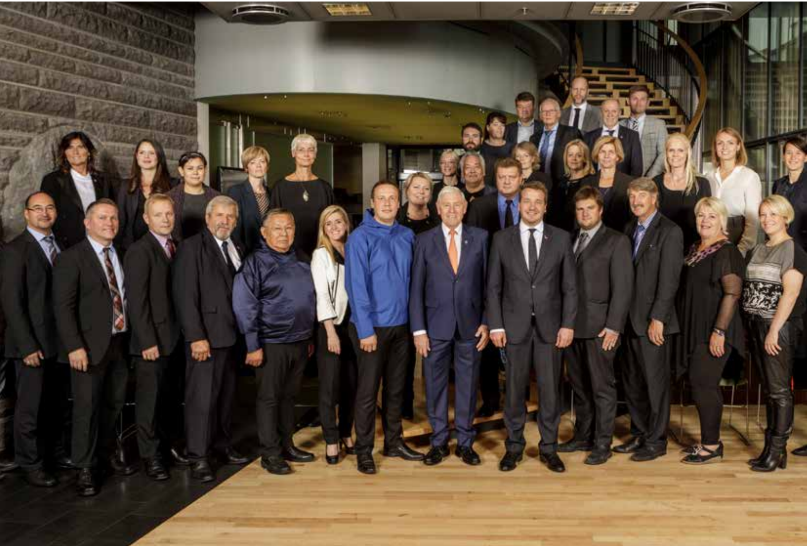
Nunat Avannarliit Killiit Siunnersuisoqatigiiffiat ulluni 31. aggustimiit 1. septembarimut Reykjavíkimi ukiumoortumik ataatsimiippoq.