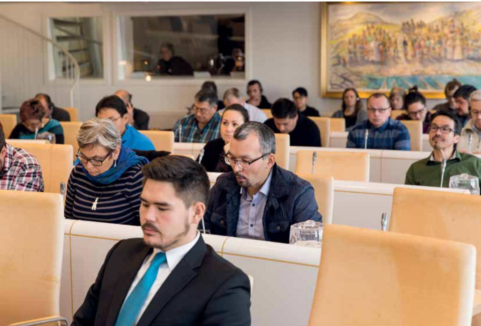
Ulloq 16. november: Ukiaanerani ataatsiminnermi ullut ataatsimiiffiusut 30-ssaat.