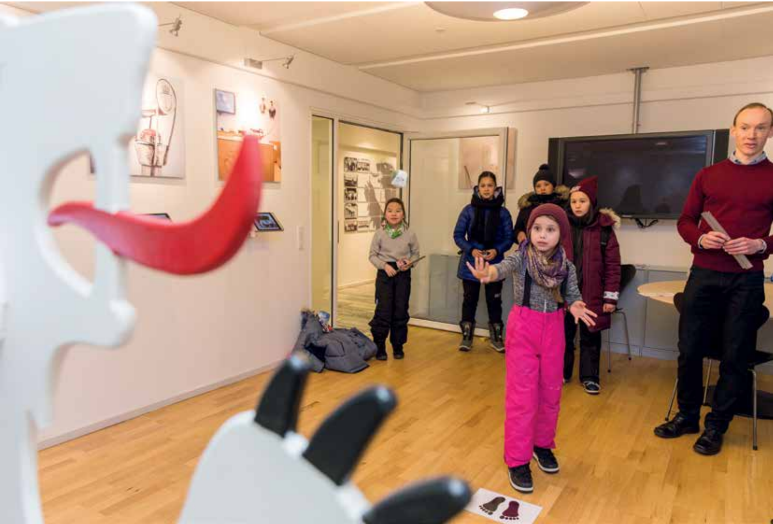
Meeqqanut, arsaqqanik nakatarneq.