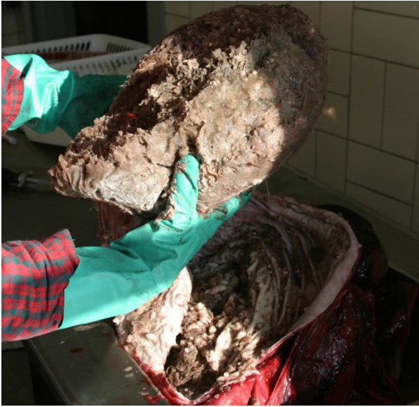
Fig. 2. Qeqertarsuup tunuani ukiuunerani qilalukkap qernertap aqjaruata imai.

Ukiuunerani aqajaqqut qaleralinnik tamatigut imaqarnerusarput, tamannalu qilalukkat qernertat Davis Strædemi (aamma Qeqertarsuup tunuani) sumiiffigisartagaannut naqqanullu aqqaamasarnerinut naapertuuttuuvoq. Aalisakkat allat aamma takussaapput, kisianni qaleralinnut sanilliullugit pingaaruteqarneri ilimanarani.