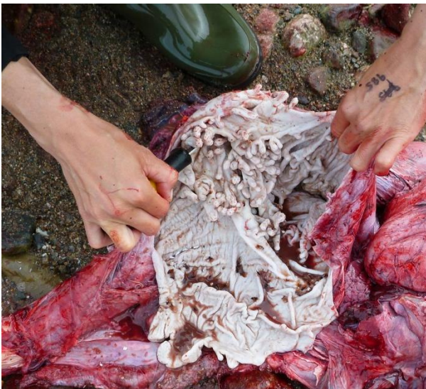
Fig. 3. Aasaanerani qilalukkap qernertap aqjarua imaqqanngitsoq tamatumani Tunumeersaq.

Tunumi qilalukkat qernertat aasaanerani amikut aamma istorsk eqalukkallu kiisalu kinguit ataasiakkaat nerisaraat. Tunumi Kangerlussuarimi aamma qaleraleqarpoq, kisianni qilalukkat qernertat taakku nerisarneraat uppersineqanngilaq. Ukiuunerani nerisaat ilisimaneqanngilaq, kisianni nunavissuup killeqarfia 500 - 1000 m ungasitsigalugu qaleraleqarfimmi uninngasarput, taamaattumik ilimanarluinnarpoq qalerallit aamma nerisarigaat. Tunumi isotopinik aalaakkaasunik misissuinerit takutippaat aamma ammassattortut, taamaattumik Danmark Strædemi ukiuni kingullerni immap kissakkiartornerata qernertanik qilalugaqarfik ammassaqartikkaa.