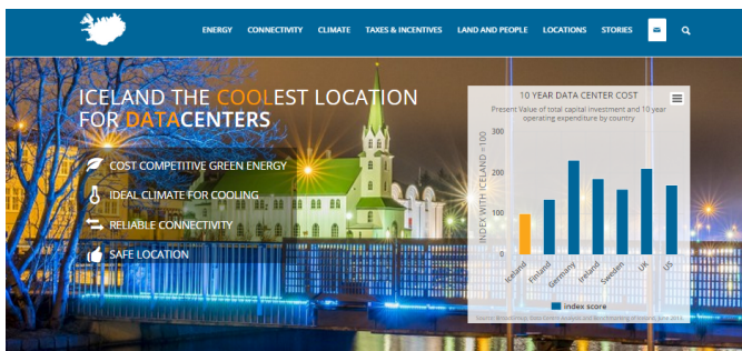
( http://datacenter.invest.is/ )

Visit Invest in Iceland's new dedicated Data Center website , outlining Iceland's value proposition for data centers . ( http://datacenter.invest.is/ )