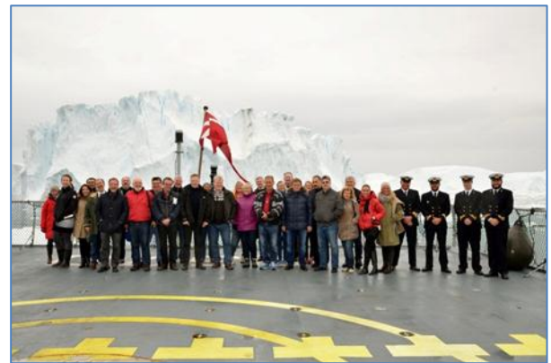
Atlantikup Avannaani aalisarnermut ministerit aallartitaallu, Ilulissat 2014.

agguarnerinut kinguaassiorsinnaanerannullu, taamaattoqarneralu nunarsuup ilaani aalisarnermik aqutsinermit annertuumik kinguneqartussaassasoq. Ilisimatusarnermi nakkutilliinermit suliniutit ataqatigiissarneqartut piffissap ingerlanerani imaani avatangiisini allanngornerit paasineqarnissaanut pingaaruteqassapput taakkulu kinguneqarluartumik qisuariafigalugit.