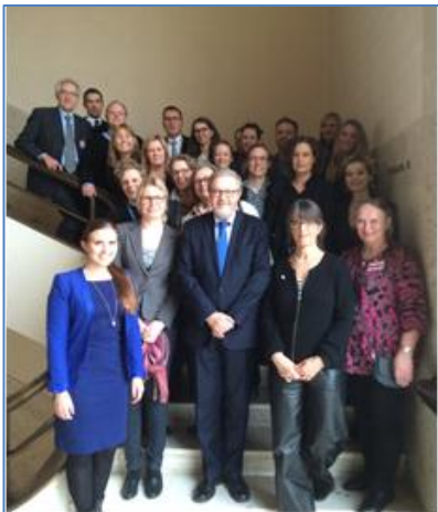
CEDAW misilitsinneq, februar 2015.

Naalackersuisoqarfik danskit aallartitaasa ilaattut atorfilittanik marlunnik peqataatitaqarpoq. Misilitsilluni soraarummeernermi aallaaviuvoq nalunaarusiaq suliaqarfimmi sammisanik, kisitsisitigut paasissutissanik, inatsisunik il. il. saqqummiussaartoq aamma 2009-mi kingullermik misilitsittoqarmalli arnat pisinnaatitaaffiinik, soorlu suliffeqarnermut ilinniagaqarnermullu tunngatillugit qanoq iliuuseqartoqarsimaneranik nassuiaasoq.