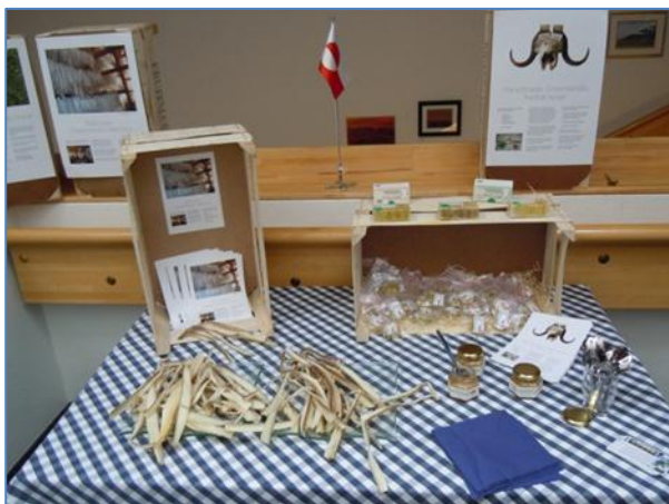
Kalaallit tunisassiaat Selfossimi ministerit ataatsimiinnerinut atatillugu ataatsimeersuarnermi

Nunani Avannarlerni Ministerit Siunnersuisoqatigiinnut allattaaneq nutarterineq pillugu nalunaarusiami pingaarnernik MR-SAM-ip akuersisimanera pillugu ilisimatitsivoq aamma nunani avannarlerni suleqatigiinnerup nutarterneqarnera pillugu sulineq naatsumik ilisimatitsissutigalugu. Allattaanerup naggasiinera nakorsaatinut bakterianut toqoraatinut sunnerneqarsinnaannginneq aamma Nordic branding pillugu isiginninniarnermut tunngasuupput.