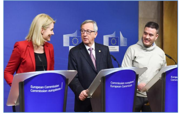
Saamerlermiit: Helle Thorning-Schmidt, Jean-Claude Juncker aamma Kim Kielsen.

Naalackersuisunut pingaaruteqarsimavoq uparuassallugu Namminersorlutik Oqartussat EU-mik isumaqatigiissutitigut tunngavigisaannut tamanut atsioqataanissaq. Aammattaaq Danmarkimi naalackersuisut atsioqataanissaat naleqqulluni, tassa EU-mik isumaqatigiissutitigut attuumassutit aamma EU-mi siunnersuisoqatigiit aalajangiinerannut tunngaveqarmata taamaalillutillu danskit piginnaasaannut. Namminersorneq pillugu isumaqatigiissut 2009-meersoq Namminersorlutik Oqartussanut annertunerusumik piginnaatitsilerneramik imaqarpoq tasanilu kissaatigineqarluni EU-mi suleqateqarnermut pissutsit immikkut ingerlateqqinneqassasut.