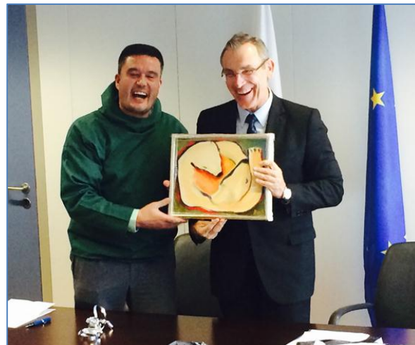
Naalackersuisut Siulittaasuat Kim Kielsen taamanikkut EU-Kommissæri Andris Piebalgs peqatigalugu.

EU-p aamma Kalaallit Nunaata akornanni attuumassutit pillugit siunnersuisoqatigiit 12. marts 2014-imi aalajangiinerisigut piffissami ukiuni arfineq marlunni katillugit 1,6 mia. kr.-inik isertitaqarnissaq Kalaallit Nunaannit qulakkeerneqarpoq, ilinniartitaanermut tunngasut isiginiarlugit suliniutini allattorneqarsimasut anguniakkat nalunaarutigisassallugit.