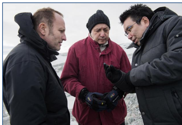
Franskit nunanut allanut ministeriat, Laurent Fabius, nunanut allanut naalakkeruisoq, Vittus Qujakitsoq, aamma danskit nunanut allanut ministeriat, Martin Lidegaard peqatigalugit ilulissanut tikeraaqqammerpoq.

oqaasertanik aallaaveqarput, malunnaatilimillik angusaqarfiunani. Taamaattumik naliliisoqarpoq COP21-mi akuerineqarsinnaasunik aamma 2020-mi atuutilersinnaasunik nunarsuarmioqatigiinnut pituttuisumik isumaqatigiissuteqarnissaq ungasittoq. UNFCCC-mi katersuunnerit arlallit aggustimi/septembarimi kiisalu kingumut oktoberimi ingerlanneqassapput. Oktoberimi katersuunnermi COP21-mi Parisimi akuerineqarsinnaasunik nunarsuarmioqatigiit isumaqatigiissuteqarnissaasa qanillinnissaa ministeritigut naatsorsuutigineqarpoq.