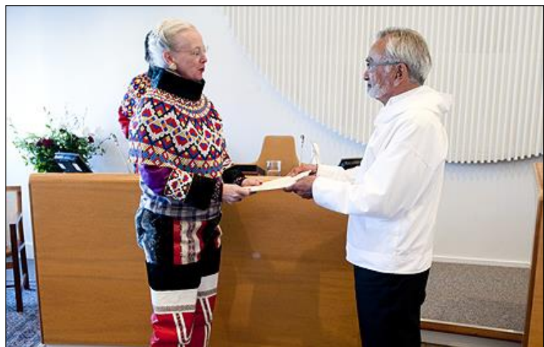
Saamerlerniit: Ataqqinartorsuaq Dronning Margrethe II aamma taamanikkut Inatsisartuni Siulittaasusoq Josef Motzfeldt Namminersorneq pillugu inatsisip tunniunneqarnerani

Tunngaviatigut oqaasertanut siunnersuut 2.b+ ajornanngitsumik oqaasertanut siunnersuut 2.a-mut aamma 2.a+-imut ataqatigiissinneqarsinnaavoq.