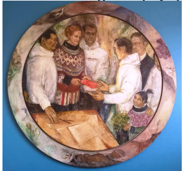
Dronning Margrethe-ip Namminersornerullutik oqartussat inatsisaat landsrådip siulittaasuanut Lars Chemnitz-imut tunniuppaa 1. maj 1979 Kalaallit Nunaanni Namminersornerullutik Oqartussat pilersinneqarnerannut atatillugu nalliuttorsiorpalaartumik katerisimaarnermi

inatsisinut tunngaviusussanut isumalioqatigiissitami ingerlanneqartariaqartoq – aalajangiineq 2015-imi Inatsisartunit uppersararneqarqittoq. Taamaalilluni nassuiaammi matumani tunngavittut piunasaqaataavoq inatsisinut tunngaviusussanut kalaallit isumalioqatigiissitaat qanoq pilersinneqarsinnaanersoq nassuiarneqassasoq. Taamatut isumalioqatigiissitami ilaasortassanik toqqaanissamut qinersinissamulluunniit piunasaqaatit pillugit, nunap aqqissuussaananut aqunneqarneranullu maleruagassanik tunngaviusussanik suliaqarnissamut piffissat atugassarititaasut imaluunniit nunap aqqissuussaananut aqunneqarneranullu maleruagassanik tunngaviusussanik allataqarneq pillugu namminermi erseqqittuliortoqanngilaq.