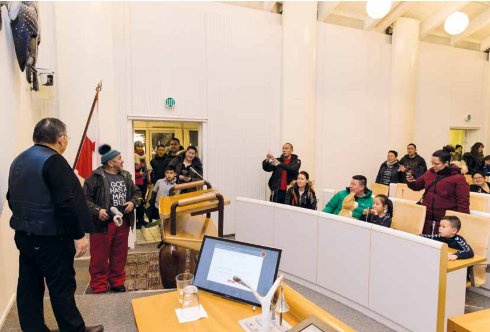
Pulaartut amerlasuut oqaluttarfimmik misileerusupput.