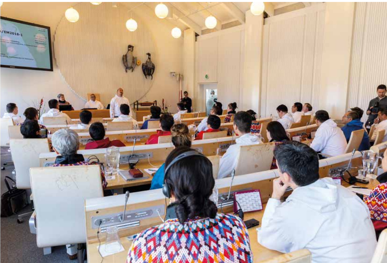
Jens Gustav Levisenip ammaansiornermut atatillugu "Ulloq qaavoq" erinarsorpaq.