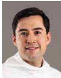
Múte Bourup Egede