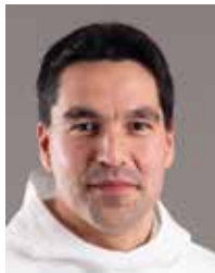
Aqqaluaq B. Egede