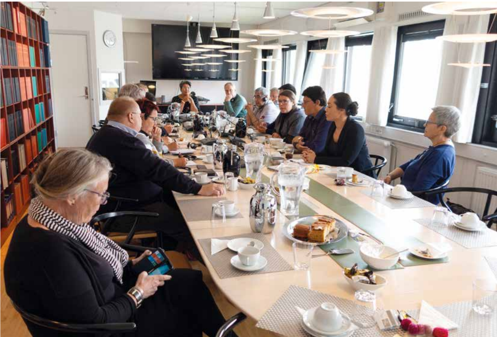
Folketingip Kalaallit Nunaannut tunngassutillit pillugit ataatsimiititaliaa ilaasortanik ataatsimeeqateqariartorluni ulloq 15. august Inatsisartunut tikeraarpoq.