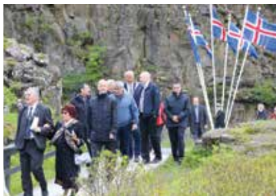
Islandip namminersulerneranit immi- nullu oqartussaaffigilerneranit ukiut 100-nngortorsiorlugit nalliuttorsiuti- ginninnermi peqataaneq