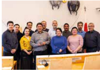
Nunat Avannarliit Siunnersuisoqatigiif- fiata Avatangiisit pillugit Nersornaa- siuttagaanik 2018-imi tunineqartut Attumeersut pulaartut