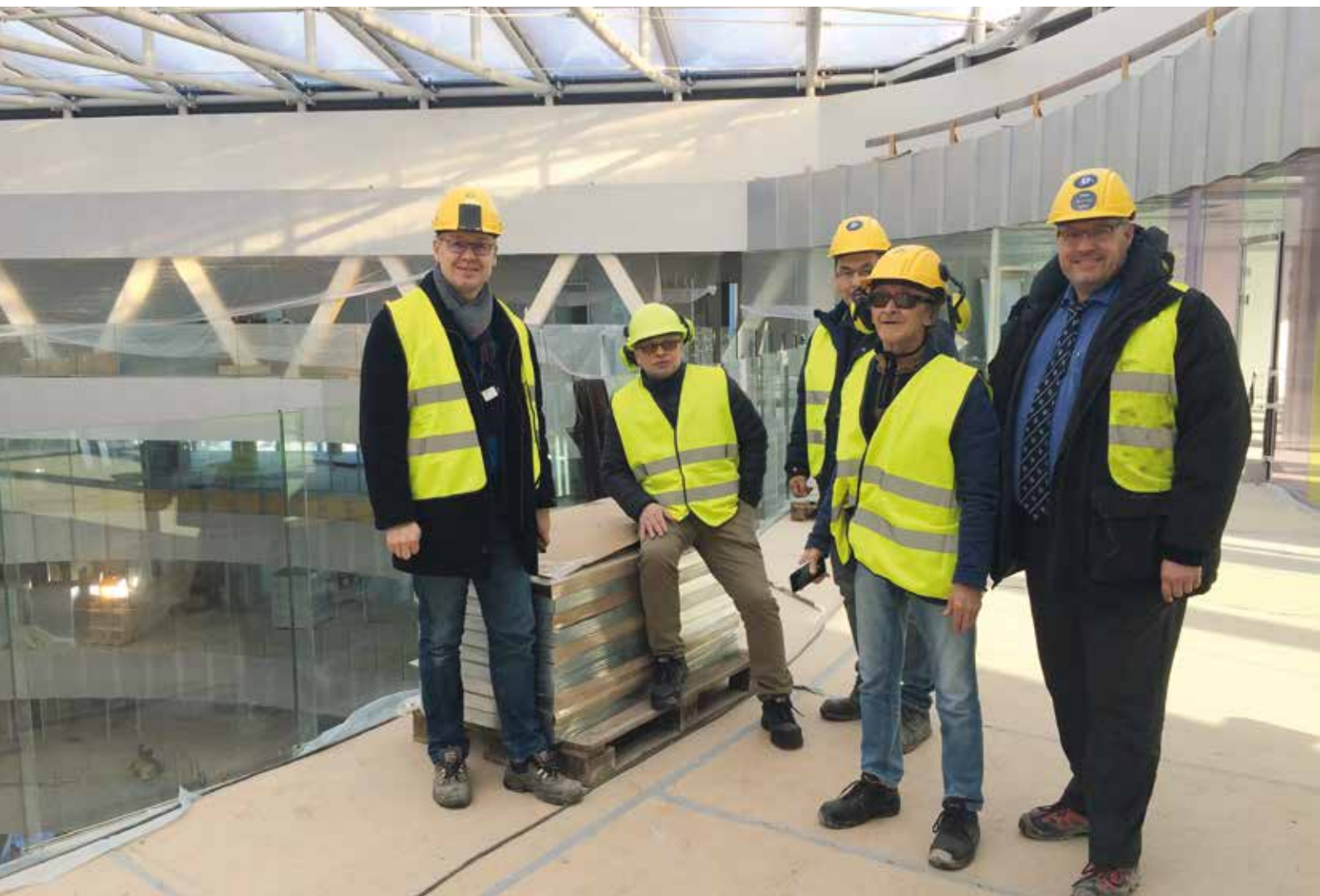
Sanaartornermut Ataatsimiititaliamit aallartitat ulloq 6. marts Glasirimit takornariartinneqarput, taanna siunissami Savalimmiuni Niuernermut Teknikimullu ilinniarfiullunilu ilinniarnertuunngorniarfiussaaq.