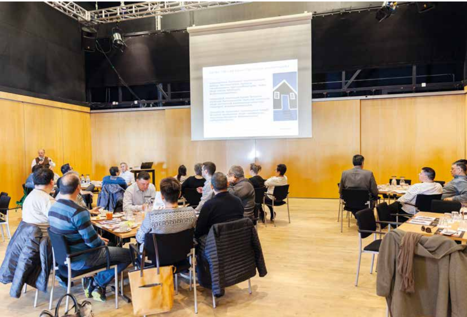
Qinersinerup kingorna Inatsisartunut ilaasortat isumasoaqatigiipput. Isumasioqatigiinneq 17. maj ingerlanneqarpoq.