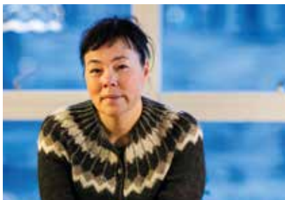
Inatsisartut Siulittaasuat Vivan Motzfeldt