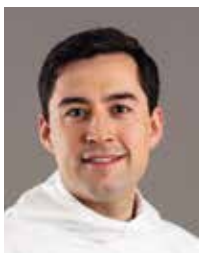
Múte Bourup Egede