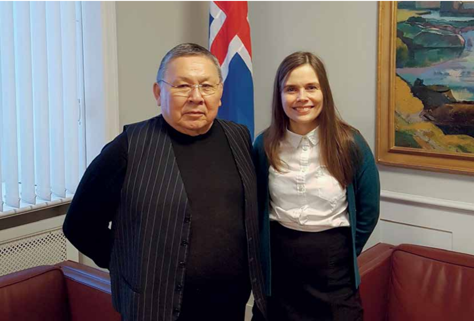
Siulittaasup tamatuma saniatigut Islandip statsministeria Katrin Jakobsdottir naapippaa.