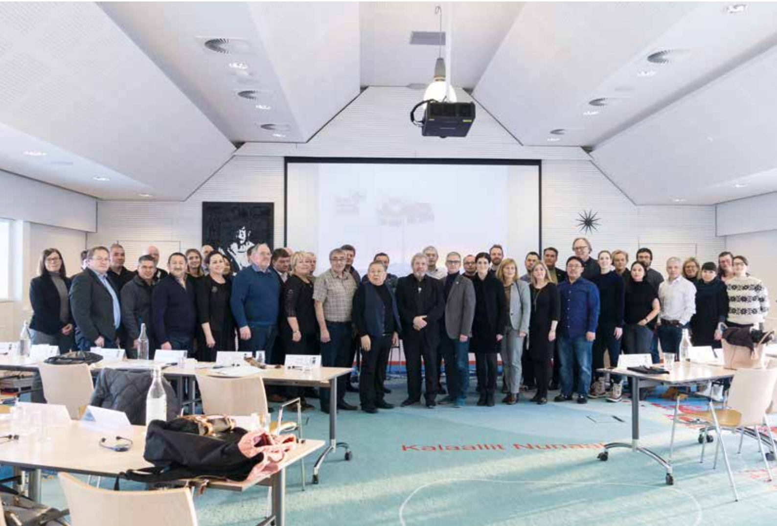
Quleqtaqartitsilluni ataatsimeersuarnermi nunani avannarlerni killerni takornariaqarnermi sullissisut unammilligassaat periarfissaallu sammineqarput.