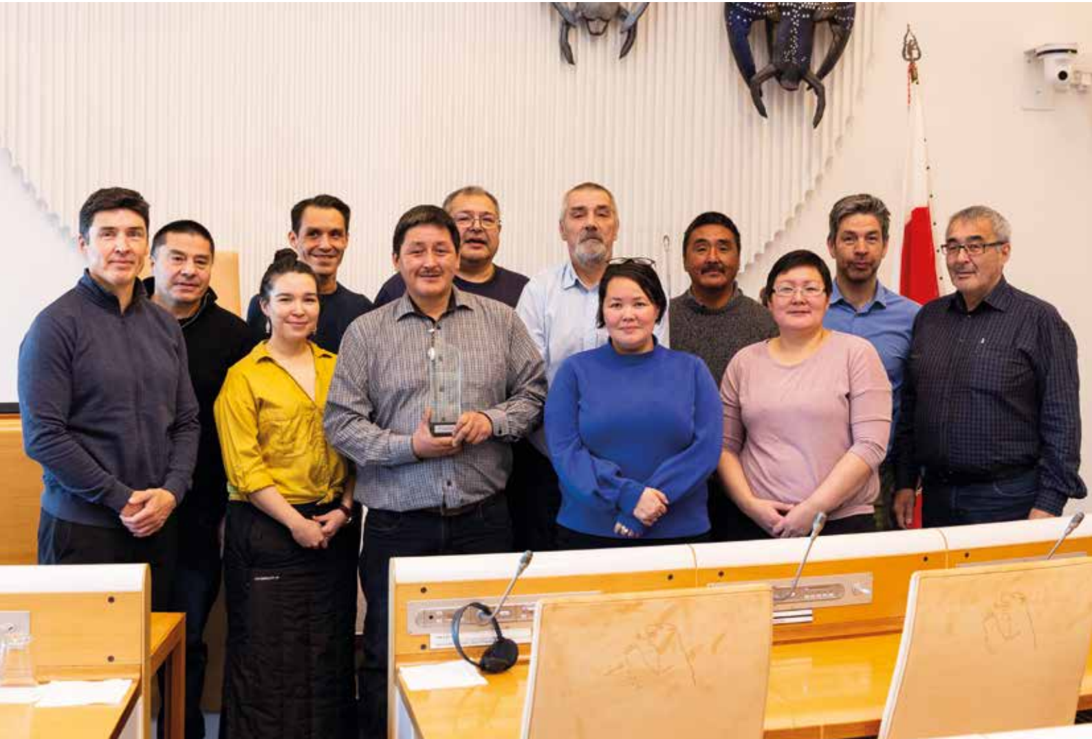
Nunat Avannarliit Siunnersuisoqatigiiffiata avatangiisit pillugit suliniuteqartunut nersornaasiuttagaanik 2018-imi nersornaasereqartut ataatsimiititaliamit kiisalu Aalisarnermut, Piniarnermut Nunalerinermullu Ataatsimiititaliamit ulloq 8. november ataatsimeeqatigineqarput.