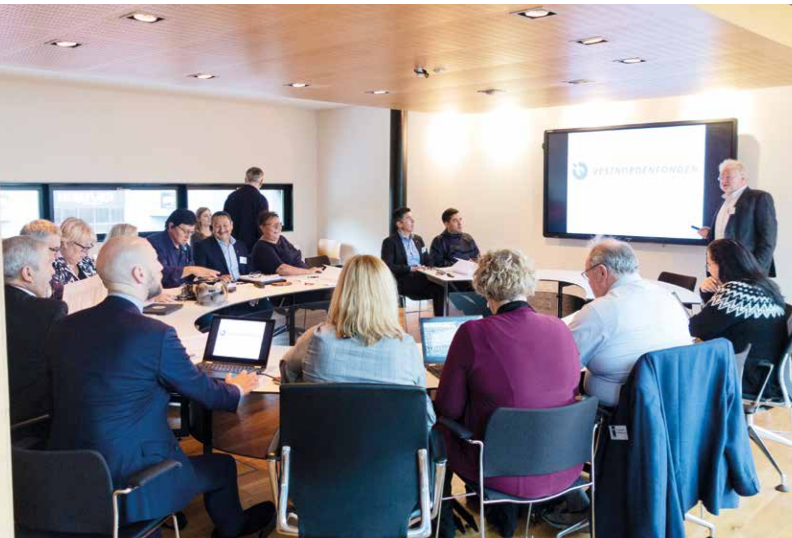
Ukiumoortumik ataatsiminneg aamma NORA, Arctic Circle kiisalu Vestnordenfond pillugit ilisimasanik katersiffittut atorneqarpoq. Pisortaq Sverri Hansen Vestnordenfondimeersoq suliatik pillugit saqqummiussisoq assimi takuneqarsinnaavoq.