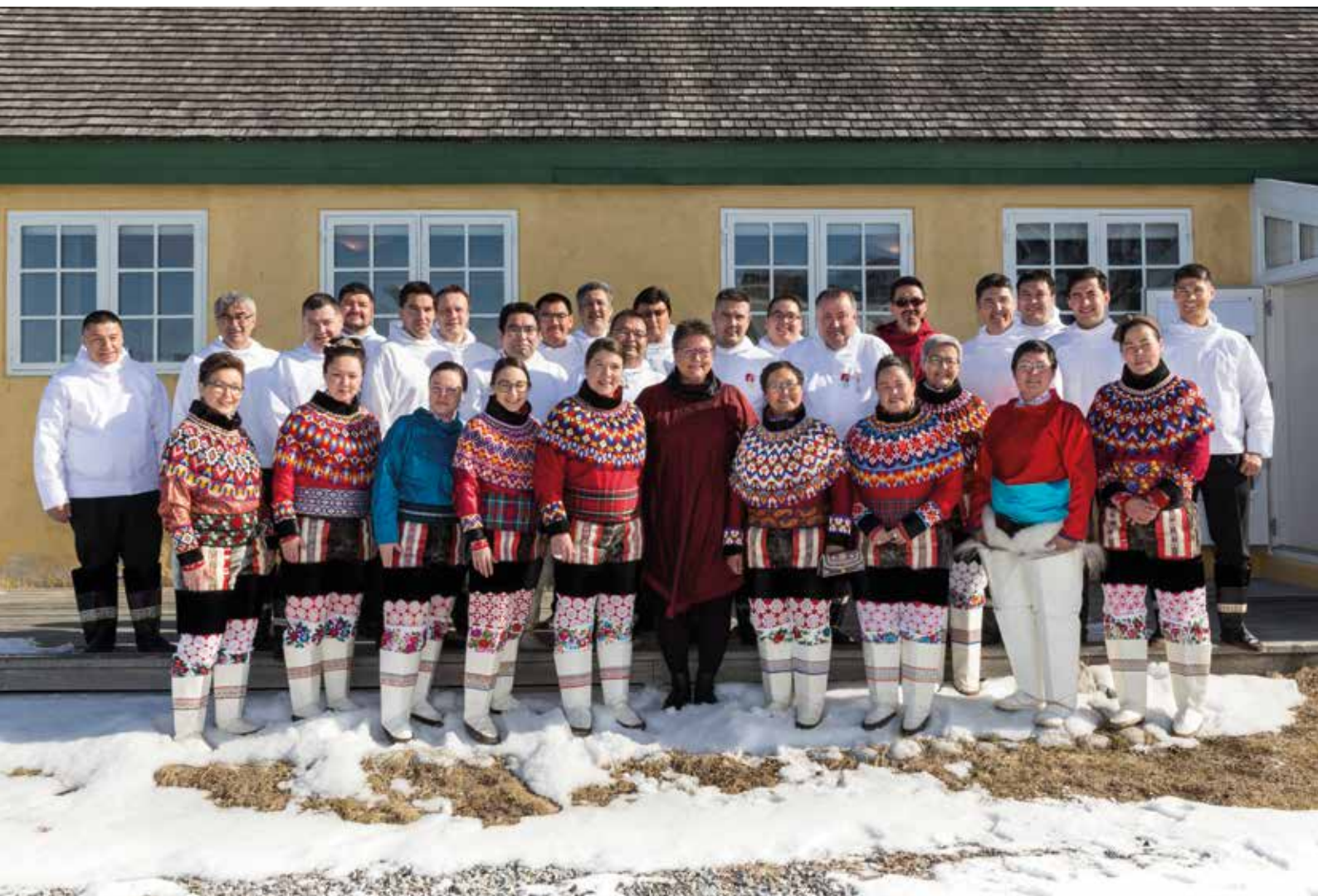
Inissitsiterfiusumik ataatsiminnq ulloq 15. maj.