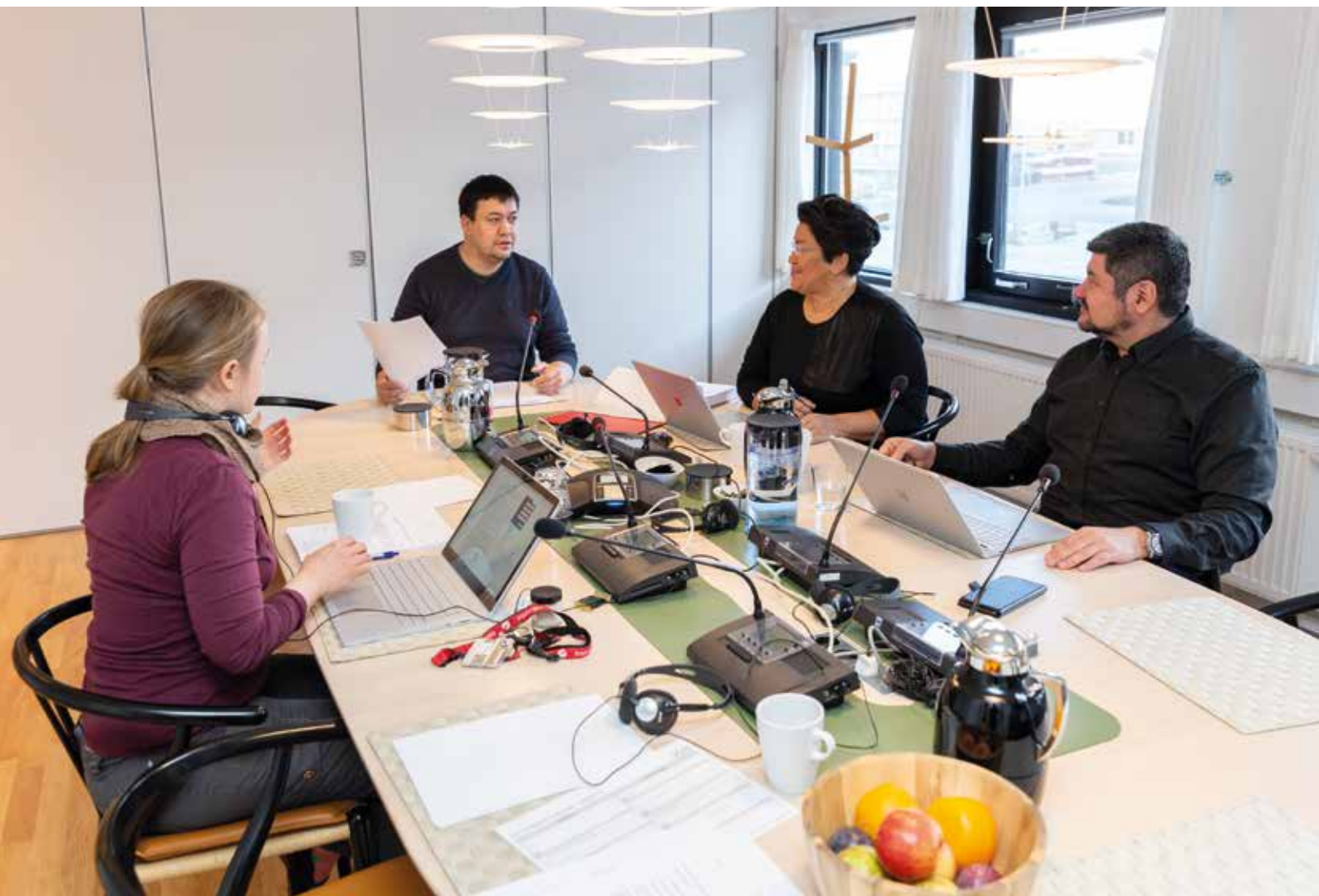
Inatsisinut Ataatsimiititaliami ulloq 9. november ataatsimiinseq.