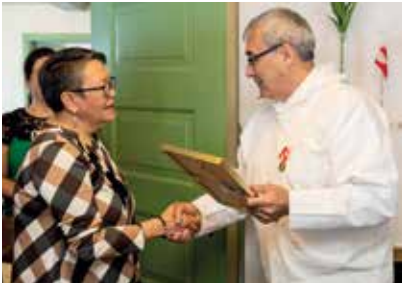
Inatsisartut Ombudsmandiat Vera Leth Kuultiusumik Nersornaaserneqartoq