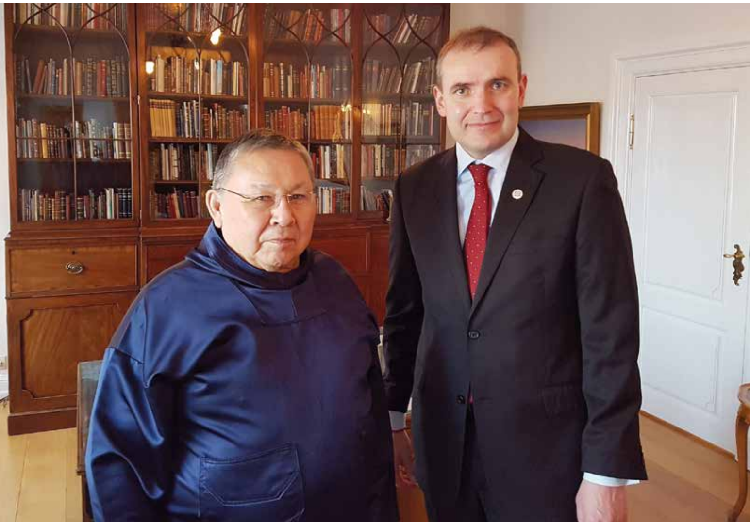
Inatsisartut Siulittaasuat Lars-Emil Johansen islandip præresidentianik Gudni Th. Jóhannessonimik ulloq 20. februar naapitsivoq.