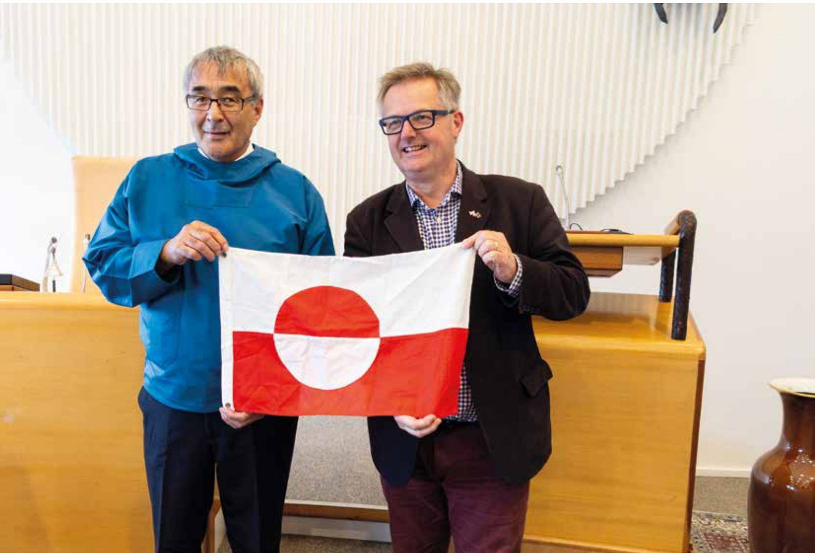
Inatsisartut Siulittaasuata Hans Enoksenip Tuluit Nunaannit aallartitat Inatsisartut ataatsimiittarfiannut takornarniartippai.