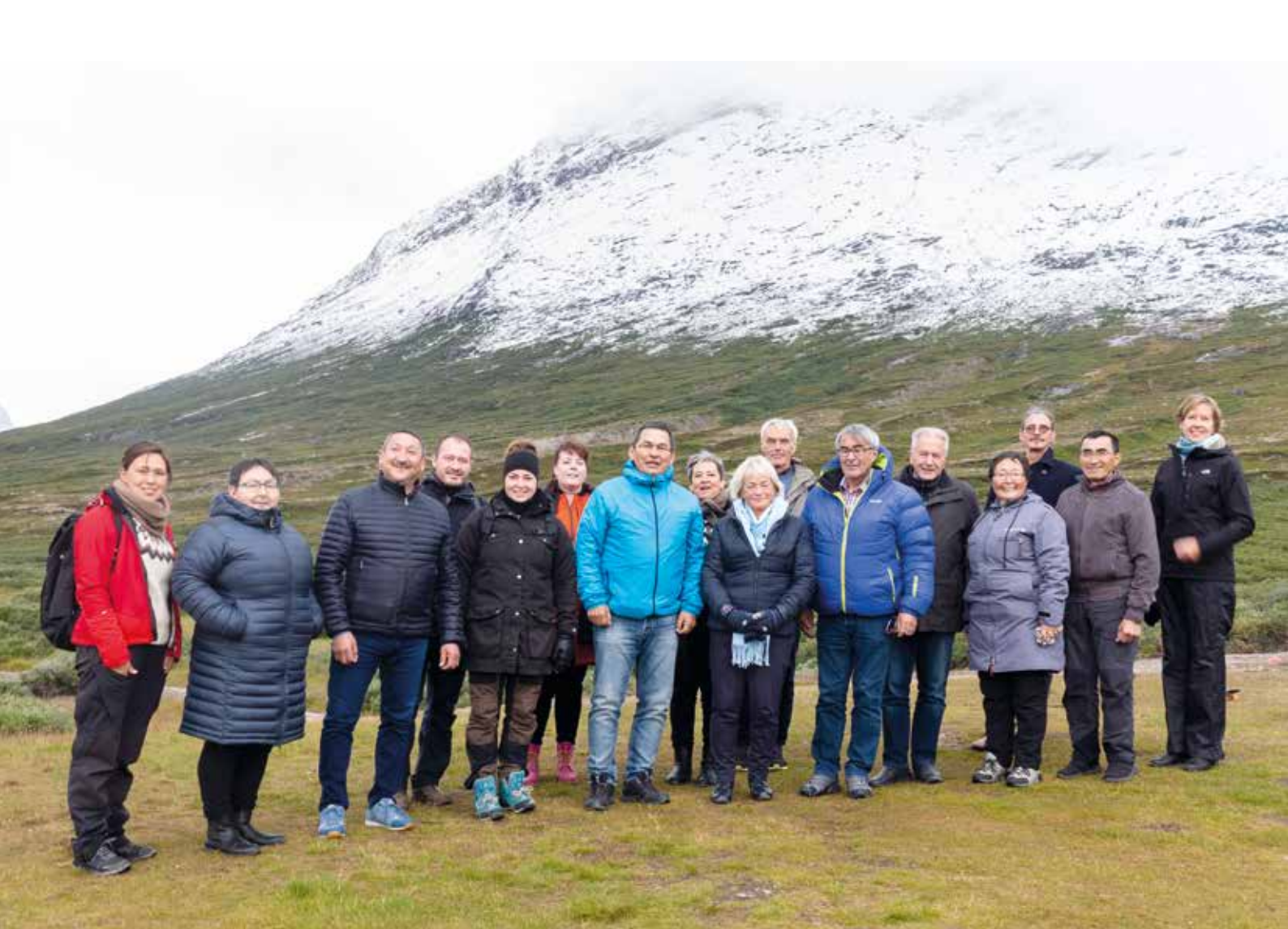
Folketingip Siulittaasoqarfia Inatsisartullu Siulittaasoqarfia aamma Nuup kangerluani angalaarunneqarput.