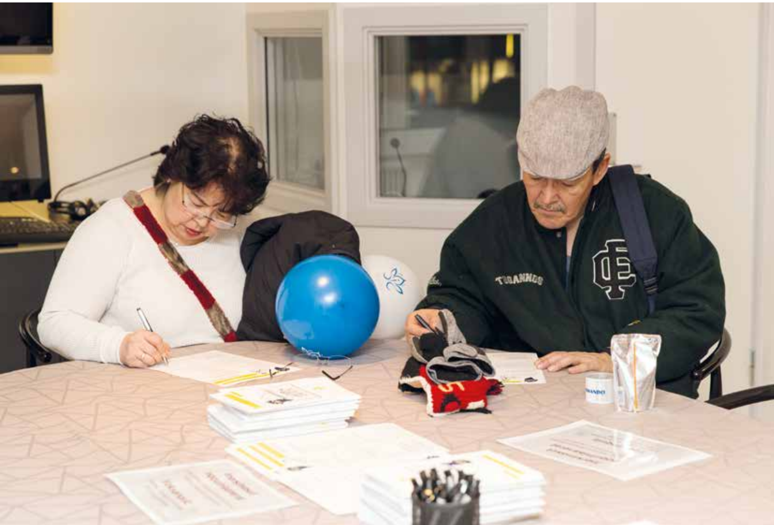
Inuit katillugit 136-it unnuk kulturisiofimmi nalorsitsaarinermut peqataapput.