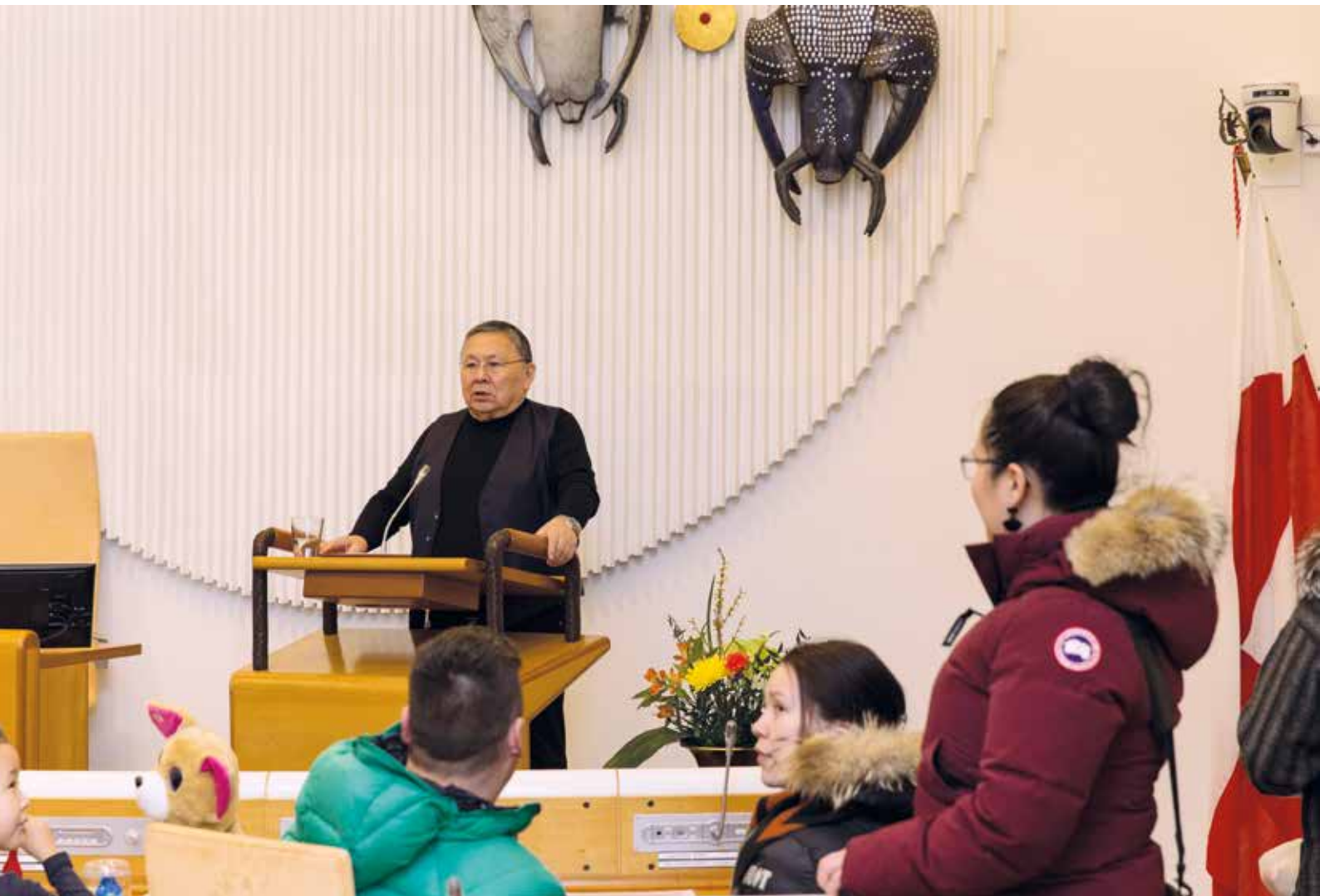
Inatsisartut Siulittaasuat inatsisartuni sulineq pillugu ilisimatitsivoq.