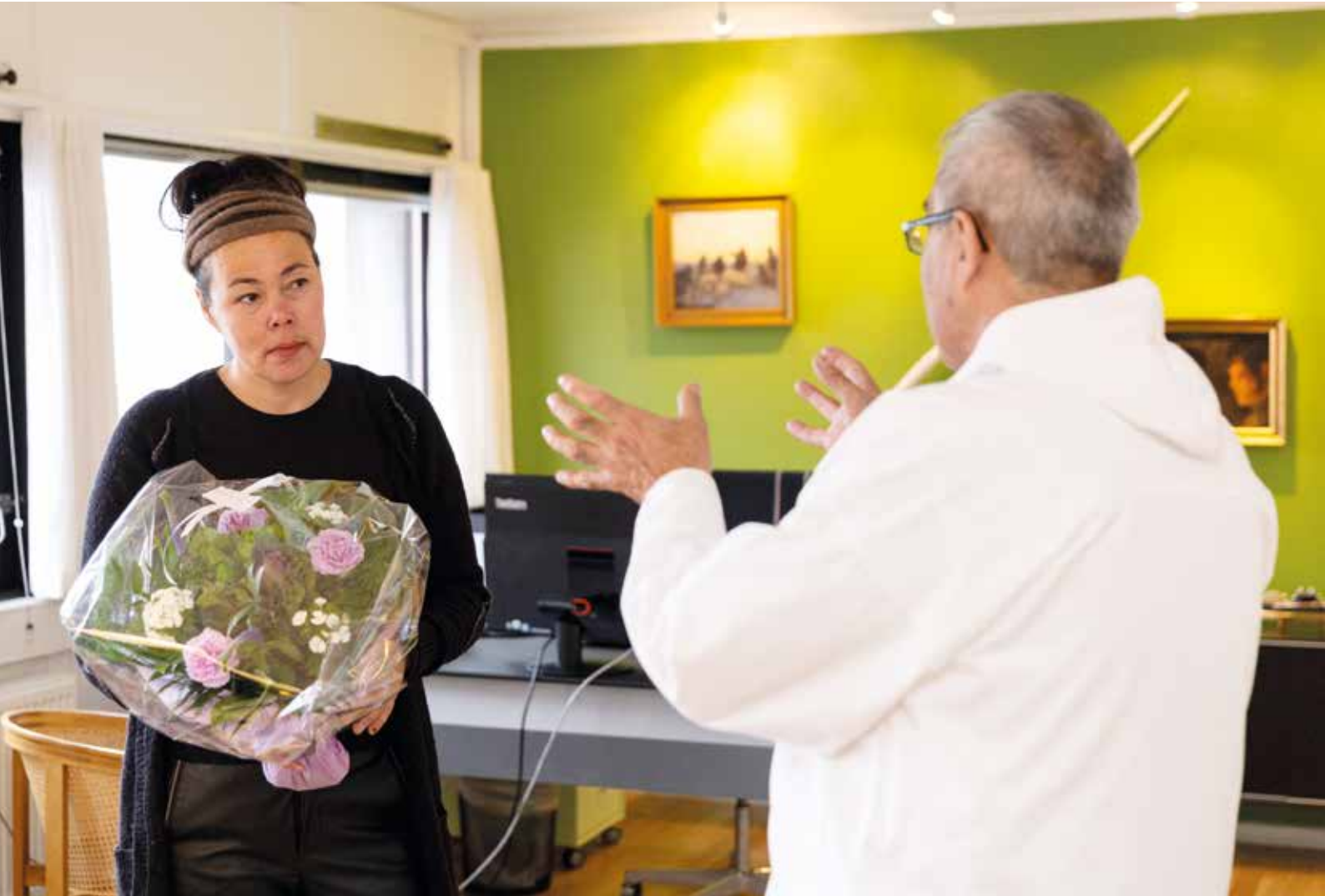
Ulloq 3. oktober Vivian Motzfeldt (S) Inatsisartut Siulittaasuattut nutaatut qinerneqarpoq. Inatsisartut Siulittaasuattut tunuartumit Hans Enoksenimit (PN) tikilluaqquneqarlunilu pilluaqquneqarpoq.