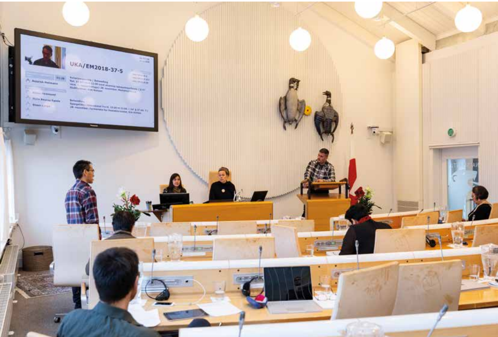
Ukiaanerani ataatsiminnermi ulloq 28. november, ullut ataatsimiiffiit 35-issaanni nalunaquttap akkunera Naalackersuisumik apersuiffik.