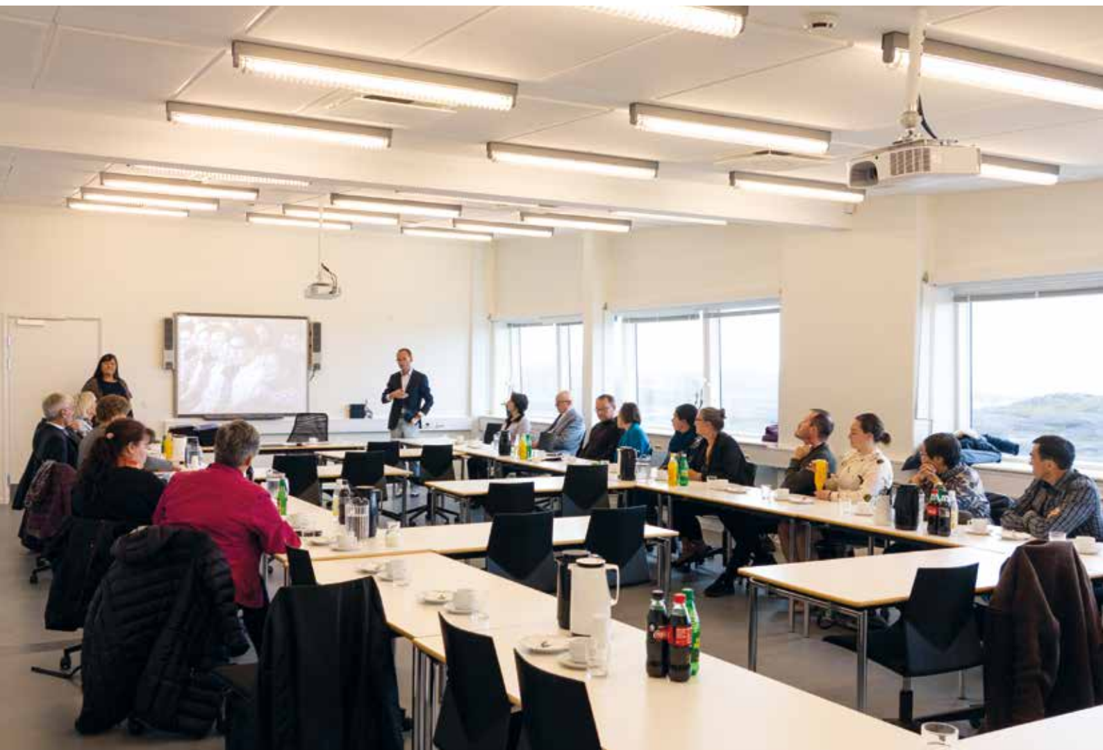
Attaveqatigiinnermut Ataatsimiititaliaq Ilisimatusarfimmut pulaartoq.