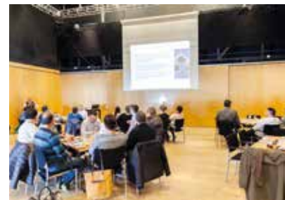
Qinersinerup kingorna Inatsisartunut ilaasortat isumasioqatigiinnerat