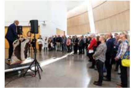
Nunat Avannarliit Siunnersuisoqatigiif- fiat tamarmiusoq septembarimi ataatsi- simiinnerminik Nuummi ingerlatsisoq