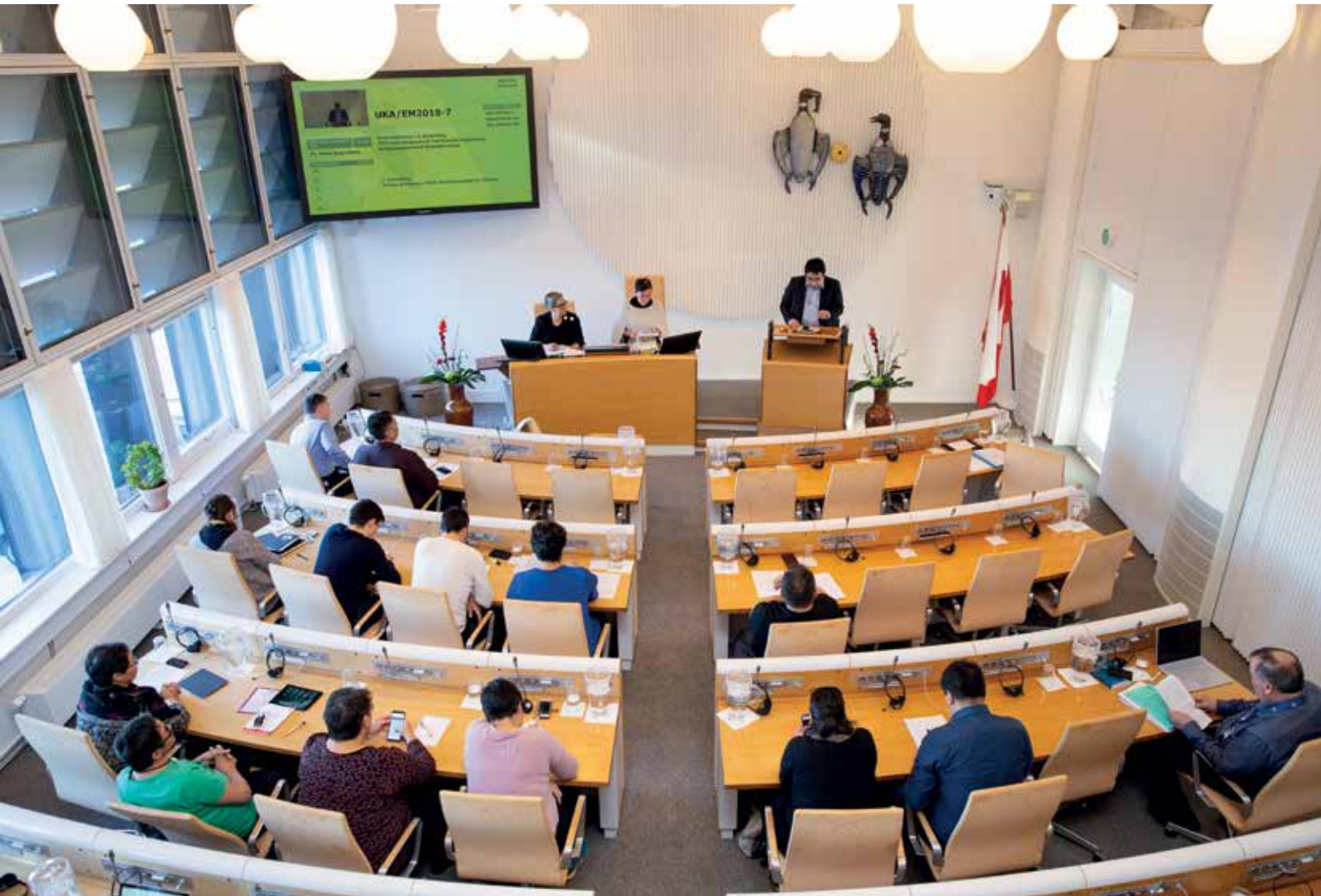
Ukiakkut ataatsiminnermi ullut ataatsimiiffiit aappaat 4. oktober 2018.