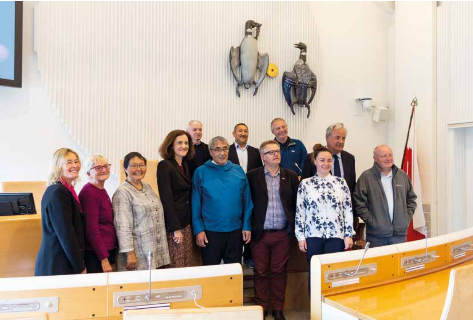
Tuluit Nunaata Inatsisartuinit aallartitat ulloq 25. august tikeraartut Inatsisartut Siulittaasoqarfiata ataatsimeeqatigai.