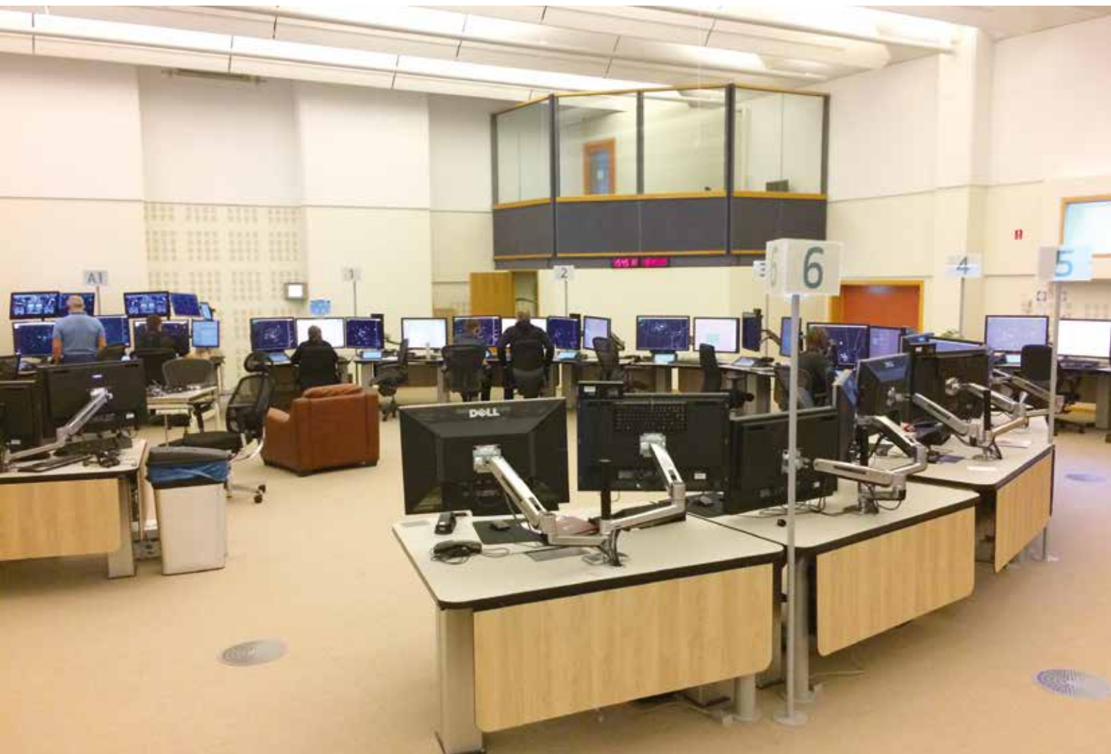
Ulloq 4. marts Sanaartornermut ataatsimiititaliamit aallartitat Reykavikimi ISAVIA-mut pulaarput. tassangaanniit Kalaallit Nunaata kiisalu atlandikup avannaata silaannartaata ilaa nakkutigineqarpoq timmisartornerlu aqutsivigineqarluni.