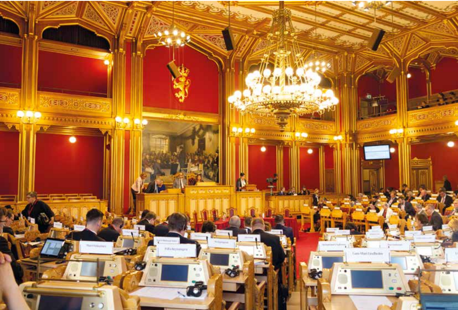
Inatsisartut Siulittaasuat Vivian Motzfeldt Nunat Avannarliit Siunnersuisoqatigiiffiata ulluni 29.-31. oktober ingerlanneqartumik katersuunneranut atatillugu Nunat Avannarliit Killiit Siunnersuisoqatigiiffiat sinnerlugu Stortingimi oqalugiarpq.