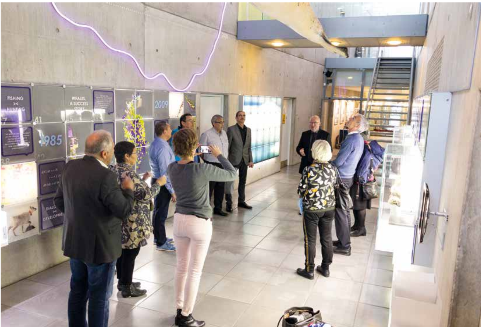
Attaveqatigiinnermut Ataatsimiititaliaq suliffeqarfinnik assigiingitsunik alakkarterinnermut aamma atorneqarpoq. Assimi takuneqarsinnaapput attaveqatigiinnermut Ataatsimiititaliamut ilaasortat Pinngortitaleriffimmut pulaartut.