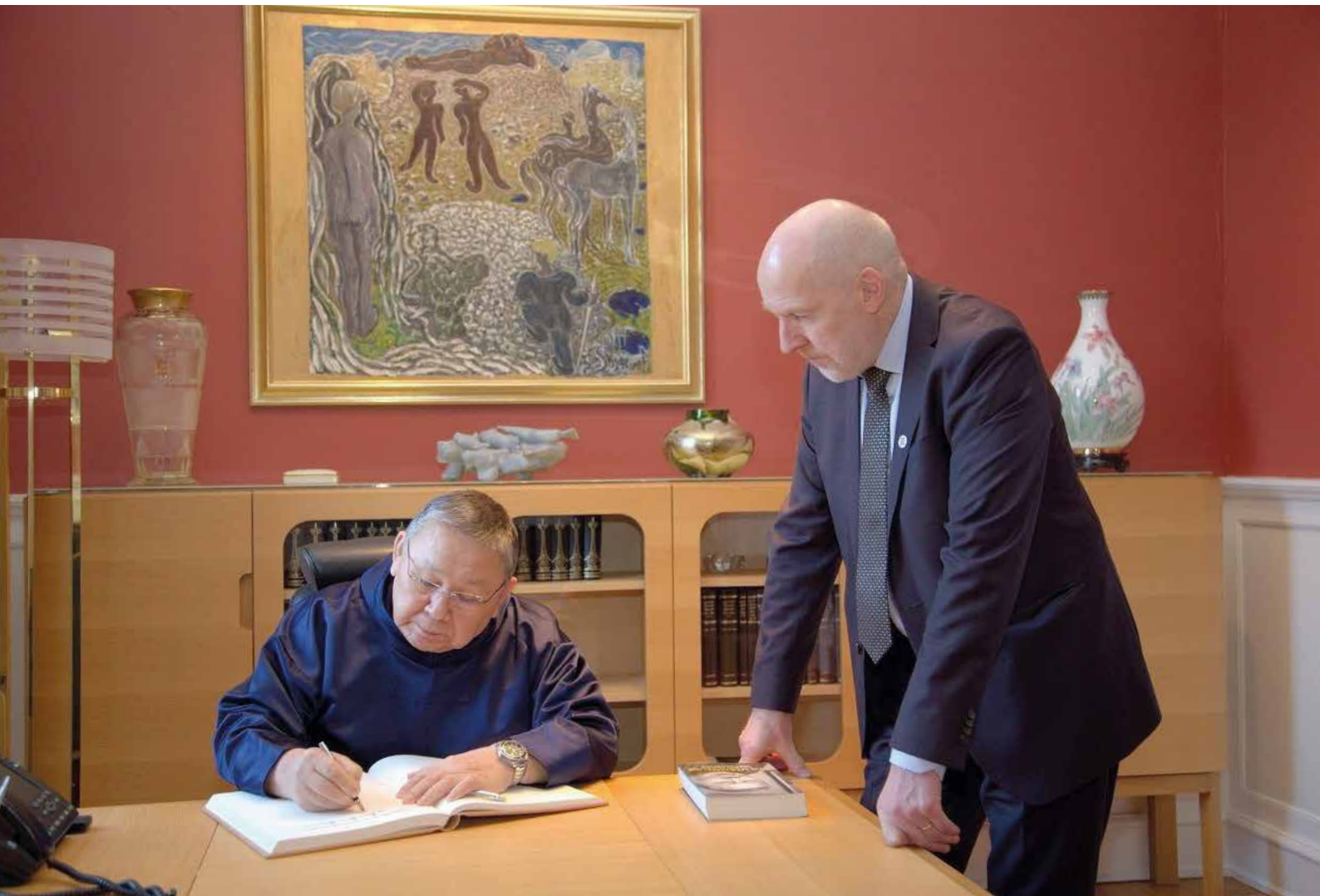
Siulittaasoq Lars-Emil Johansen aamma Altingip siulittaasua Steingrímur J. Sigfússon.