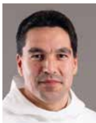
Aqqaluaq B. Egede