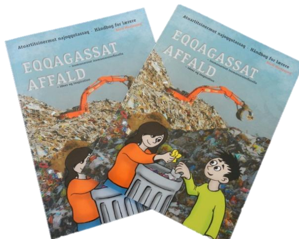
Figur 5, i juni 2013 udkom Naalackersuisut med undervisningsmaterialet "Affald – ideer og inspiration".

Endvidere har Miljøafdelingen i 2012 samarbejdet med Det Europæiske Miljøagentur og Inerisaavik om udarbejdelse af undervisningsmateriale med fokus på affald. Formålet med disse informationsindsatser er at opnå en større miljøbevidsthed.