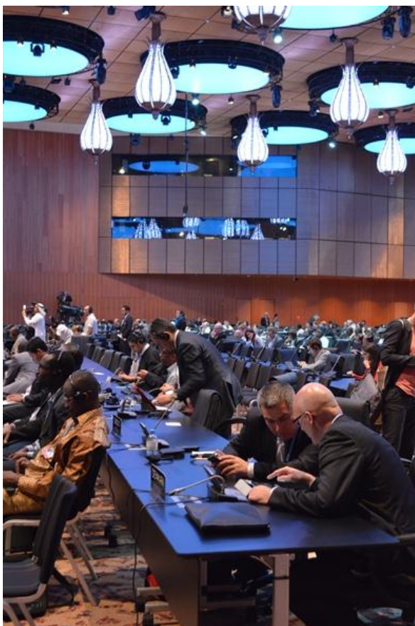
Figur 4, daværende Naalakkersuisoq Jens B. Frederiksen i samtale med Thomas Egebo, departementschef i Klima-, Energi- og Bygningsministeriet

De internationale klimaforhandlinger COP18 under FN's klimakonvention blev afholdt i Doha, Qatar, fra d. 23. november til 8. december 2012. Resultatet var en beskeden pakke af beslutninger under overskriften " The Doha Climate Gateway ".