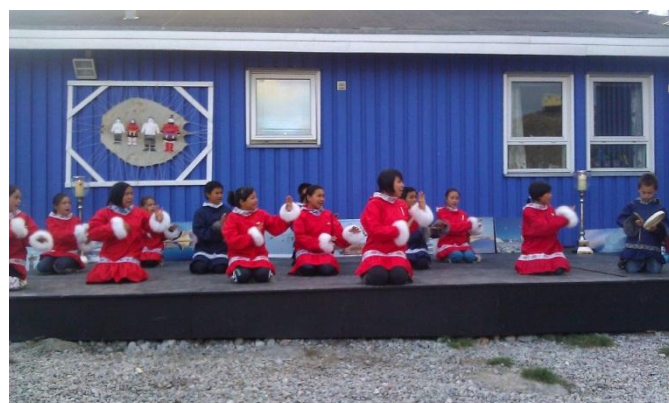
Figur 3, børn fra Børnehjemmet i Uummannaq gjorde et stort indtryk på deltagerne ved PMC mødet i Uummannaq

Det vurderes, at der var stor succes med at påvirke beslutningstagerne på mødet i Uummannaq.