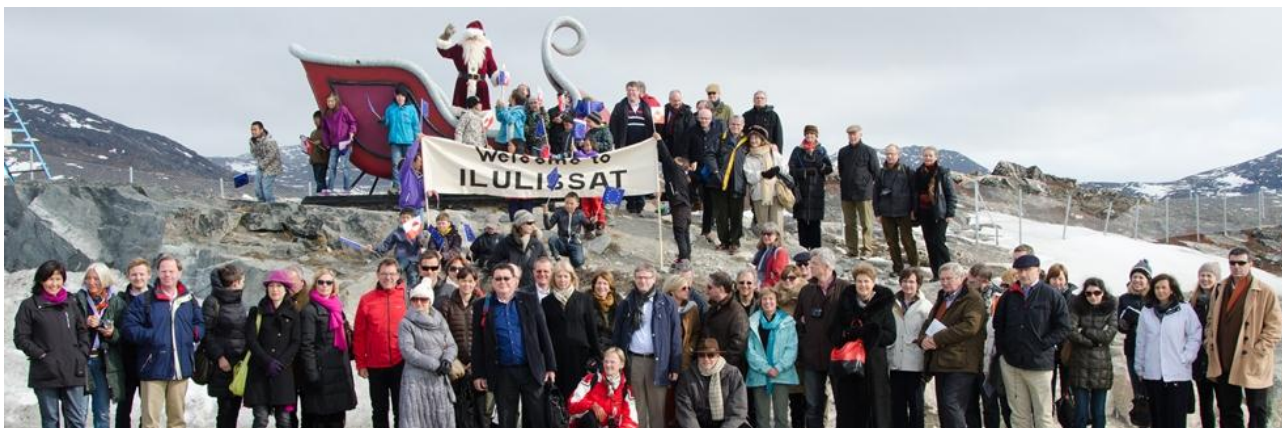
Figur 2, EU ambassadørerne sammen med Julemanden i Ilulissat

Grønland har siden sin udmeldelse af de europæiske fællesskaber i 1985 haft en række aftalemæssige relationer til EU, som i dag udgøres af: