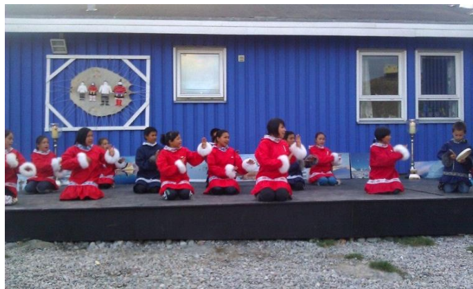
Takussutissiaq: Uummannami Børnehjem-imi meeqqat Uummannami PMC-p ataatsimiinnerani peqataasunut annertuumik misigisaqartitsipput

Naliliisoqarpoq Uummannami ataatsimiinnermi aalajangiisartunik sunniiniarneq annertuumik iluatsinneqarsimasoq.