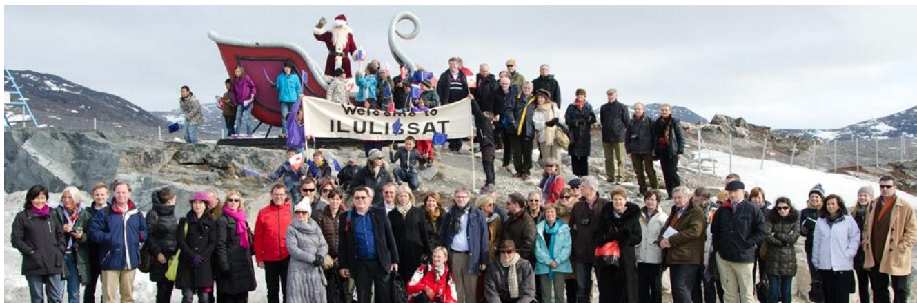
Takussutissiaq: EU-mi aallartitat Ilulissani - Juulimaap eqqaani

Nunarput 1985-mi Europamiut peqatigiiffiannit animmalli EU-mut atatillugu arlalinnik isumaqatigiissuteqartoqarsimavoq, ullumikkullu tassaallutik: