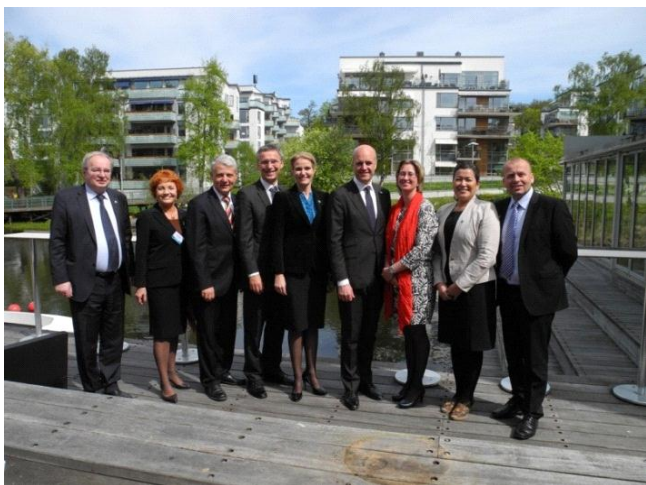
Takussutissiaq: Nunani Avannarlerni naalakkersuisut siuttuisa naapinnerat, ulloq 16. maj 2013 Stockholm-imi

Nunatta nunanut allanut tunngasutigut nutaamik ineriartorfiusoq pingaarutilik tassaasimavoq Nunani Avannarlerni Suleqatigiiffiusup ukioq kingulleq oktober-imi atsiorneqarnera. Nunani Avannarlerni Suleqatigiiffiusumi Savalimmiut, nunarput aamma Åland ataatsimoorlutik nalunaarut atsiorpaat, tamatumalu kingunerisaanik siunissami nunani avannarlerni suleqatigiinnerit ataatsimoortumik aaqqiineri aamma tapersersoqatigiinnissaq anguniarneqassallutik. Nalunaarut taanna nunani taakkunani pingasuni naalakkersuisuni aquttunit aamma Nunat Avannarliit Siunnersuisoqatigiivianni nunat aallartitaannit atsiorneqarnermigut immikkoortuuvoq.