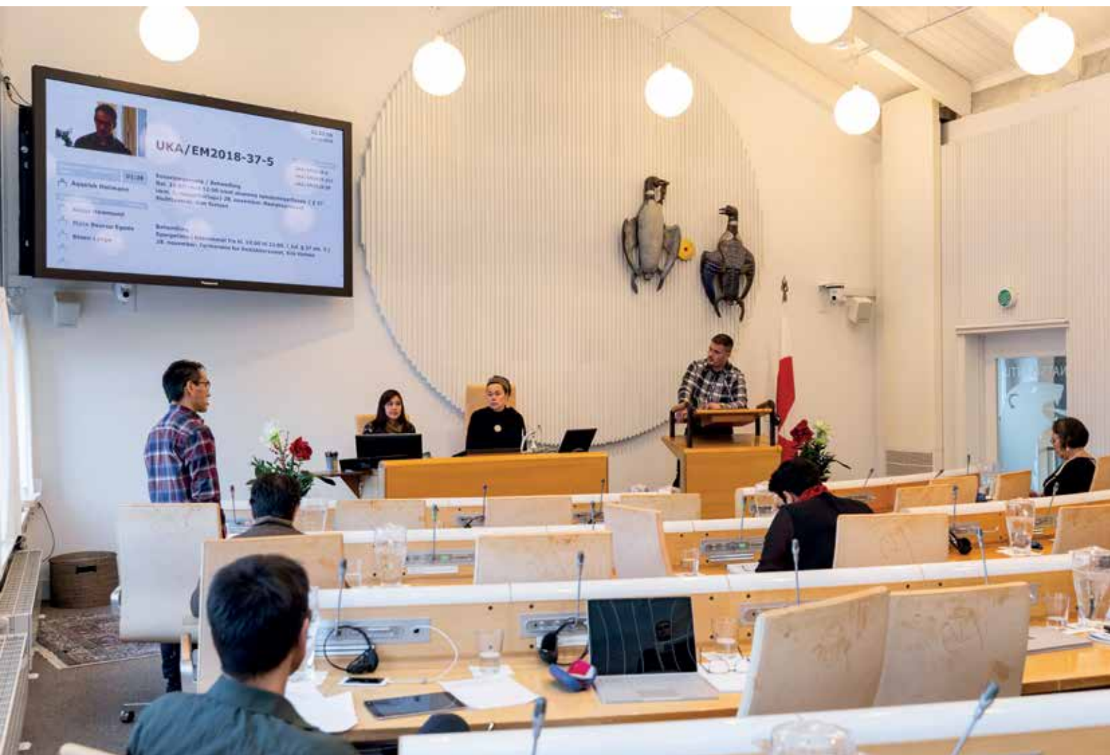
Spørgetimen på efterårssamlingens 35. mødedag den 28. november.