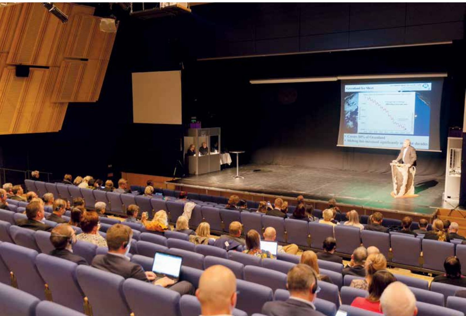
For første gang holdt Nordisk Råd sine septembermøder i Nuuk, hvor hele rådet var samlet fra den 12. til den 13. september.