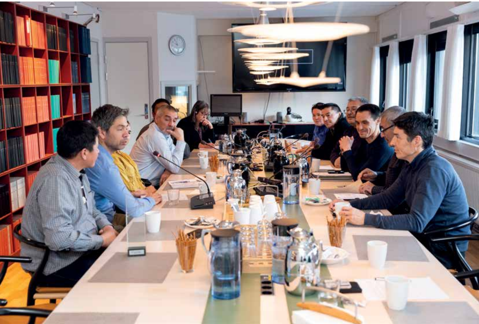
Udvalget holdt sammen med Frednings- og Miljøudvalget møde med modtagerne af Nordisk Råds miljøpris 2018 den 8. november.