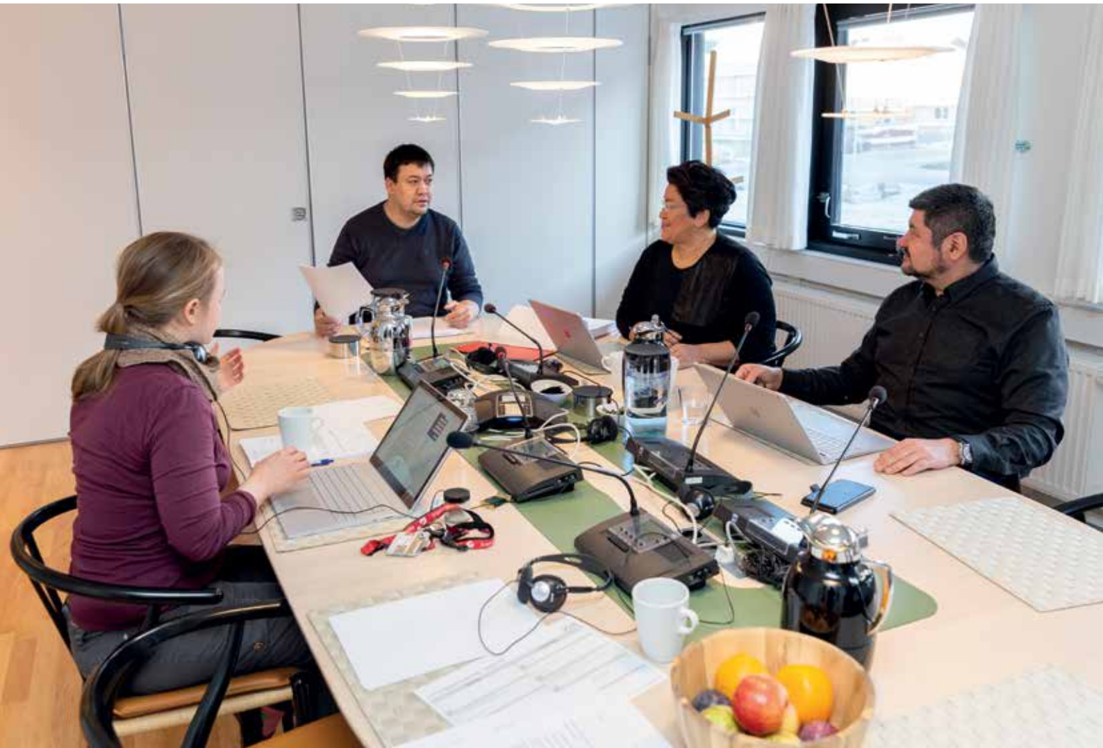
Møde i Lovudvalget den 9. november.