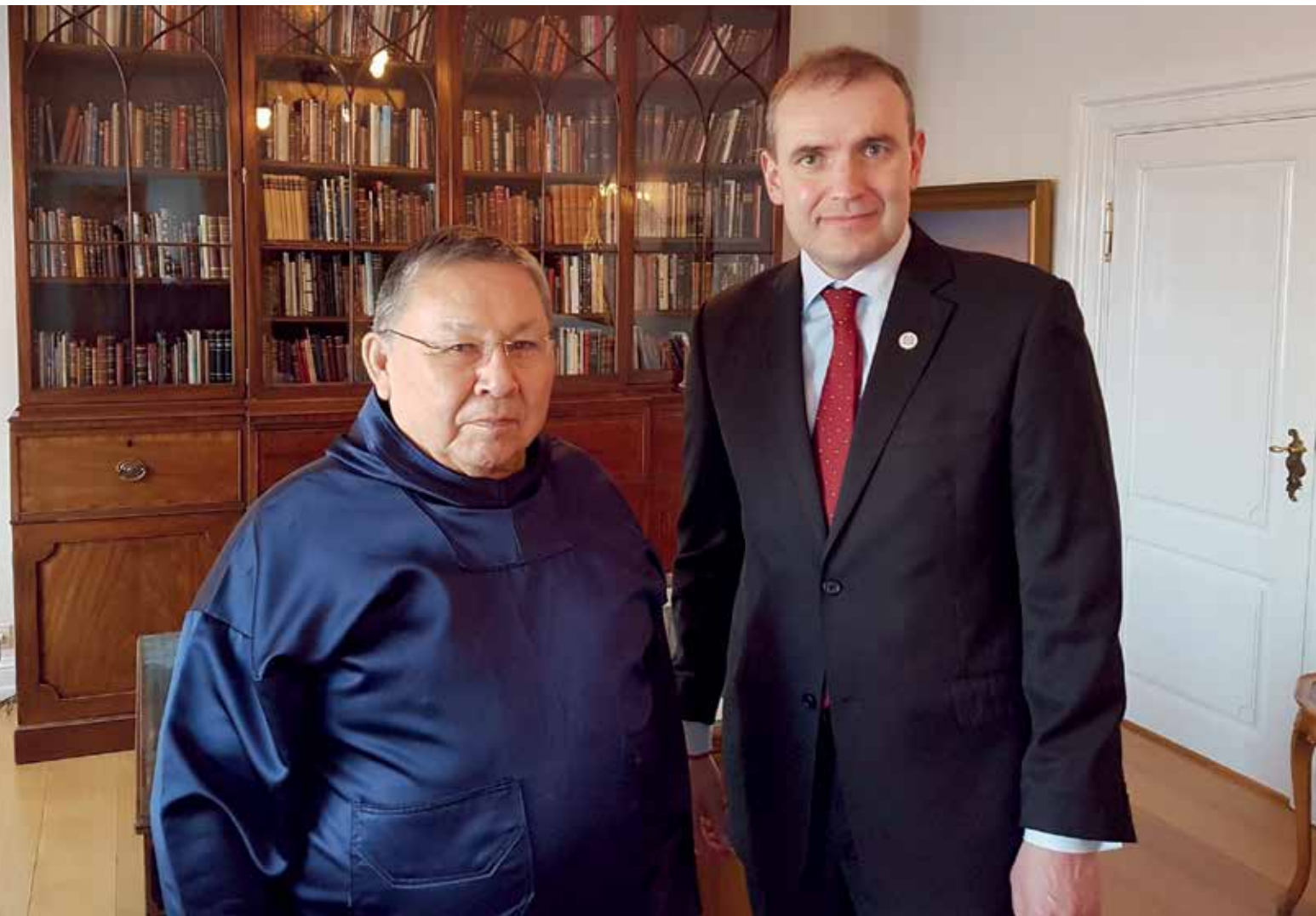
Formanden Lars-Emil Johansen mødtes med den islandske præsident Gudni Th. Jóhannesson den 20. februar.