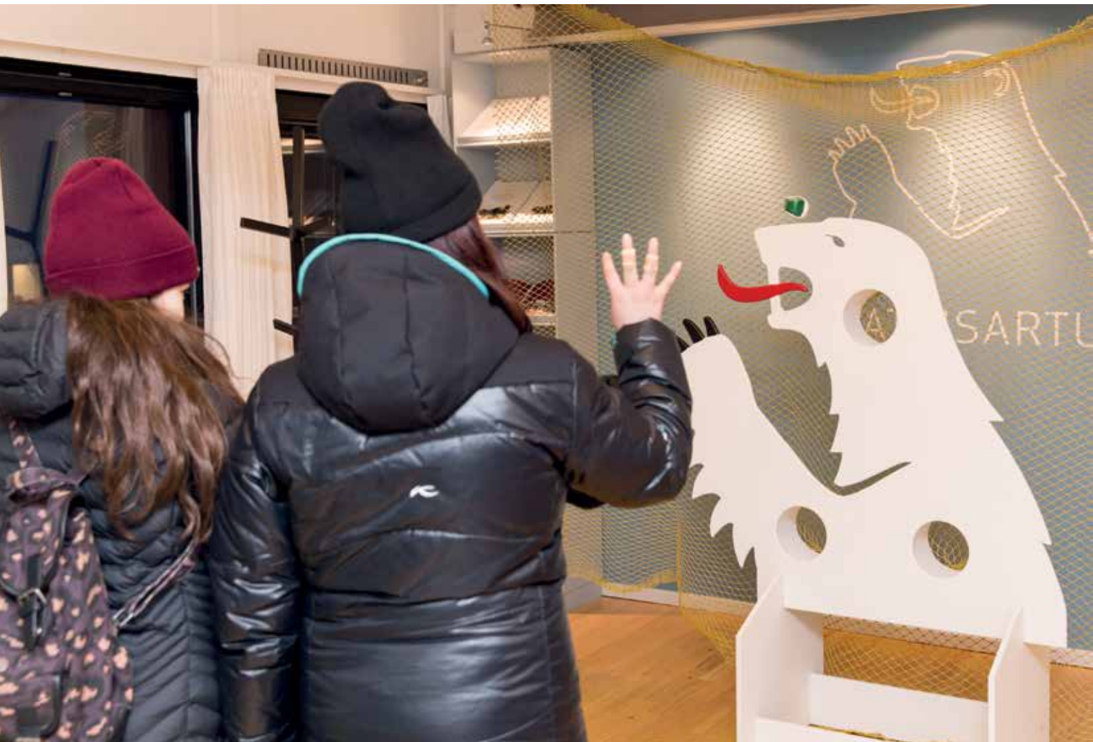
Den 20. januar holdt Inatsisartut åbent hus i anledning af kulturnatten.