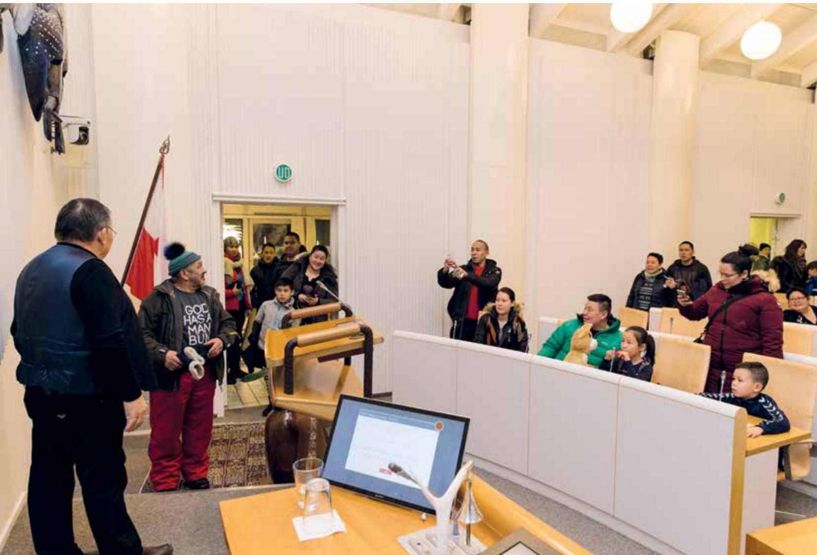
Mange besøgende ville gerne prøve at stå på talerstolen.