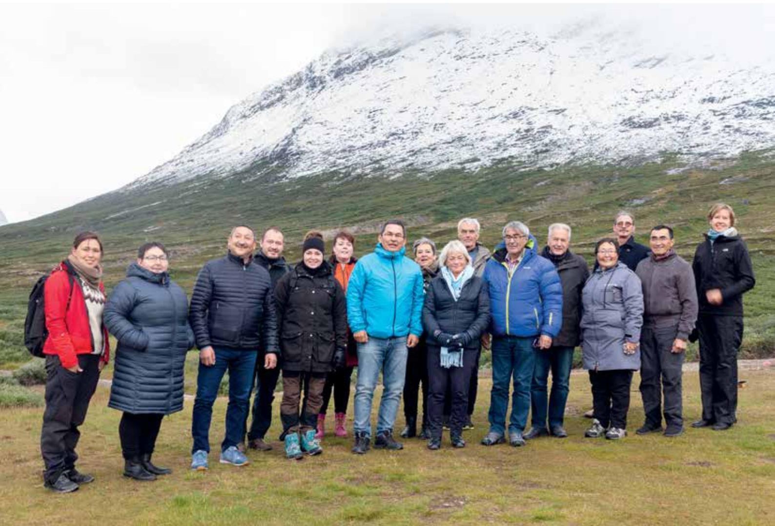
Folketingets Præsidium og Formandskabet for Inatsisartut på udflugt i Nuukfjorden.