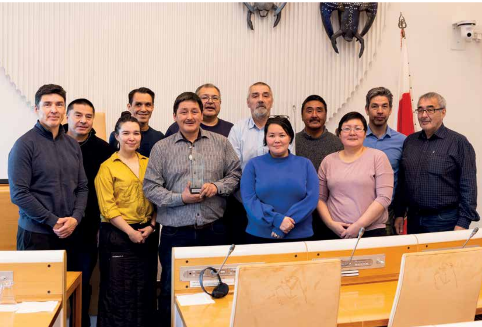
Udvalget holdt sammen med Fiskeri-, Fangst- og Landbrugsudvalget møde med modtagerne af Nordisk Råds miljøpris 2018 den 8. november.