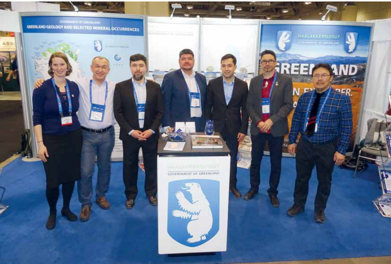
En delegation fra udvalget deltog, sammen med Naalakkersuisoq for Råstoffer og dennes delegation, på verdens største messe for mineralområdet, PDAC messen i Toronto, i dagene 1.-7. marts.