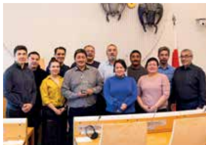
Modtagere for Nordisk Råds miljøpris 2018 fra Attu på besøg