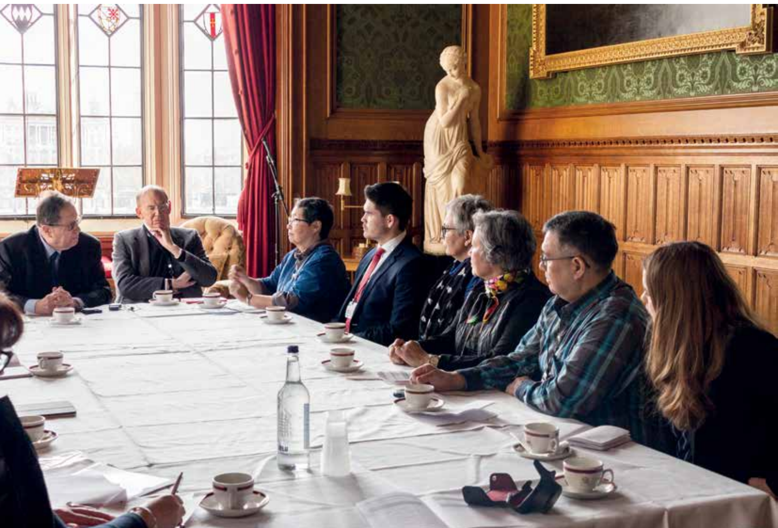
Formandskabet holdt møde med blandt andre Lord Boswell af Aynho, som er medlem af Overhuset og Formand for Overhusets Udvalg for den Europæiske Union.