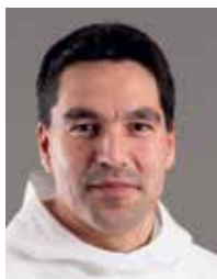
Aqaluaq B. Egede