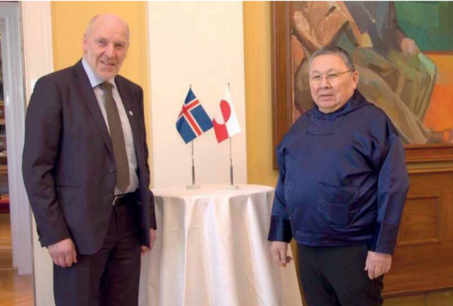
Formanden mødtes ligeledes med Altingets formand Steingrímur J. Sigfússon.