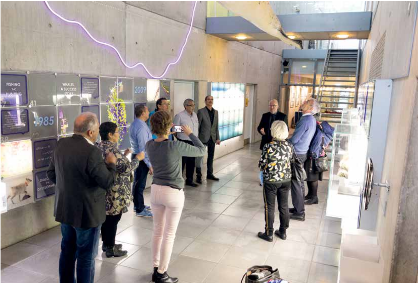
Kontaktudvalgsrådet blev også brugt til at besøge forskellige institutioner. På billedet ses kontaktudvalget på besøg hos Naturinstituttet.