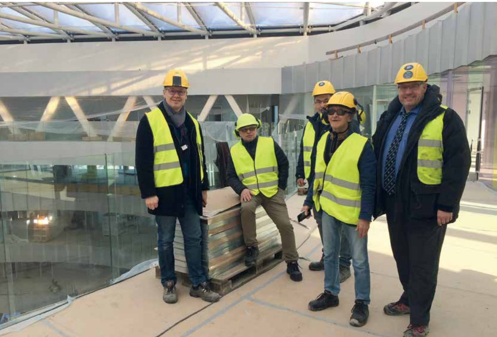
Repræsentanter fra Anlægsudvalget fik en rundvisning på Glasir den 6. marts, som fremover skal fungere som Færøernes kombineret handelsskole, teknisk skole og gymnasium.