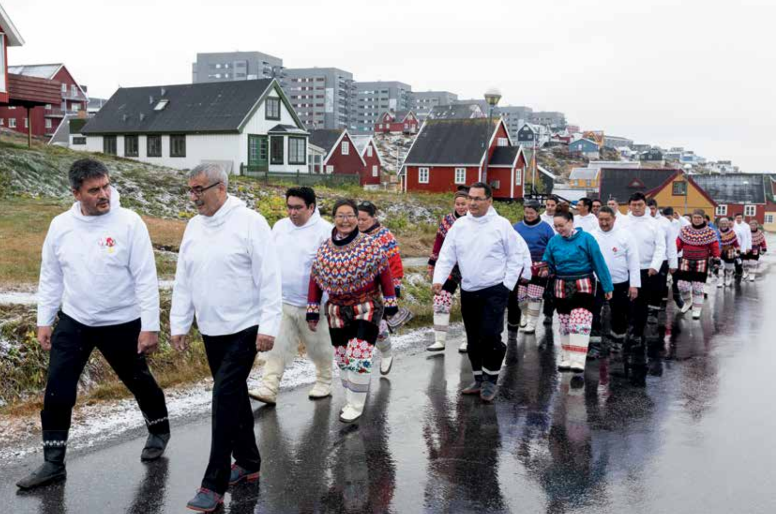
Efterårssamlingens start den 3. oktober.