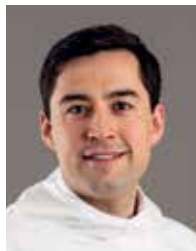
Múte Bourup Egede