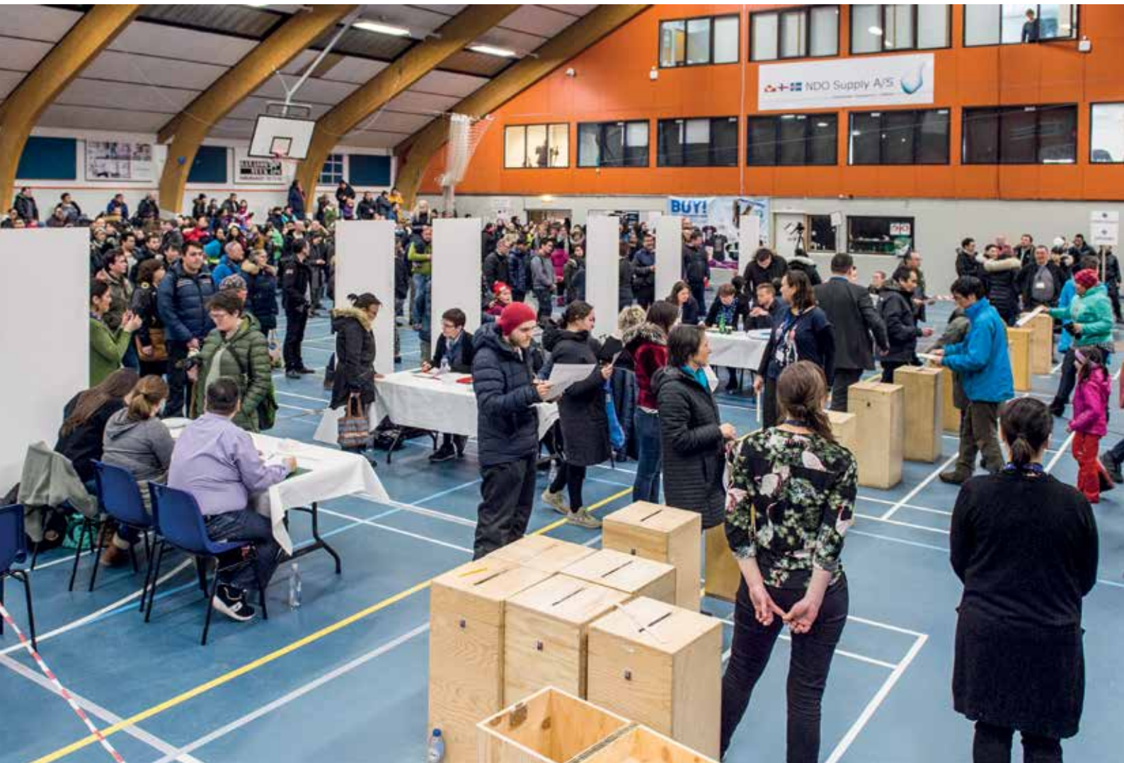
Valget til Inatsisartut fandt sted den 24. april.