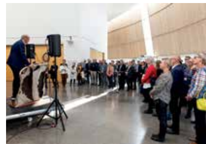
Det samlede Nordisk Råd holder sine septembermøder i Nuuk