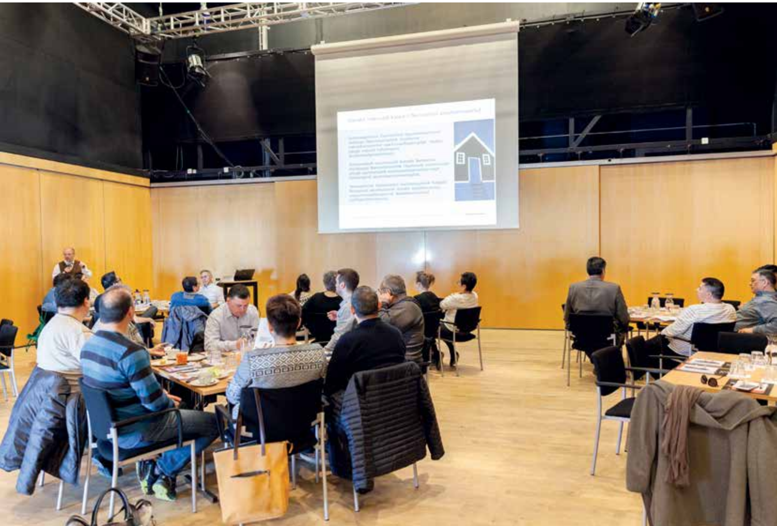
Seminar for medlemmer af Inatsisartut efter valget. Seminaret blev afholdt den 17. maj.