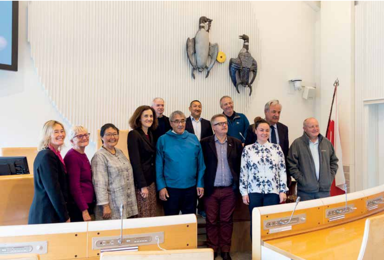
Formandskabet for Inatsisartut mødtes med en delegation fra det britiske parlament, som var på besøg i Nuuk den 25. august.