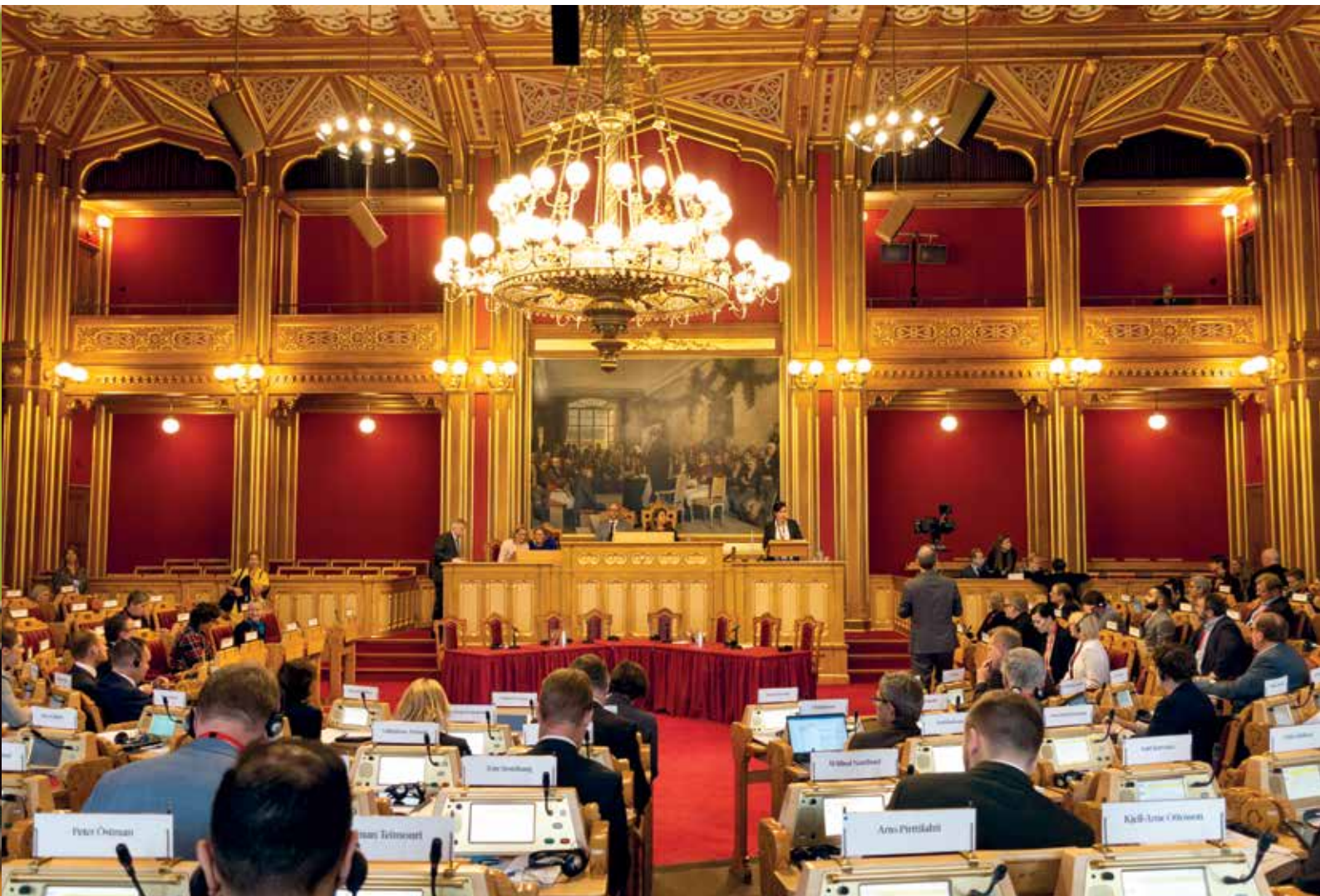
Formanden for Inatsisartut Vivian Motzfeldt talte på vegne af Vestnordisk Råd i Stortinget i forbindelse med Nordisk Råds session, som blev afholdt fra den 29. til den 31. oktober.