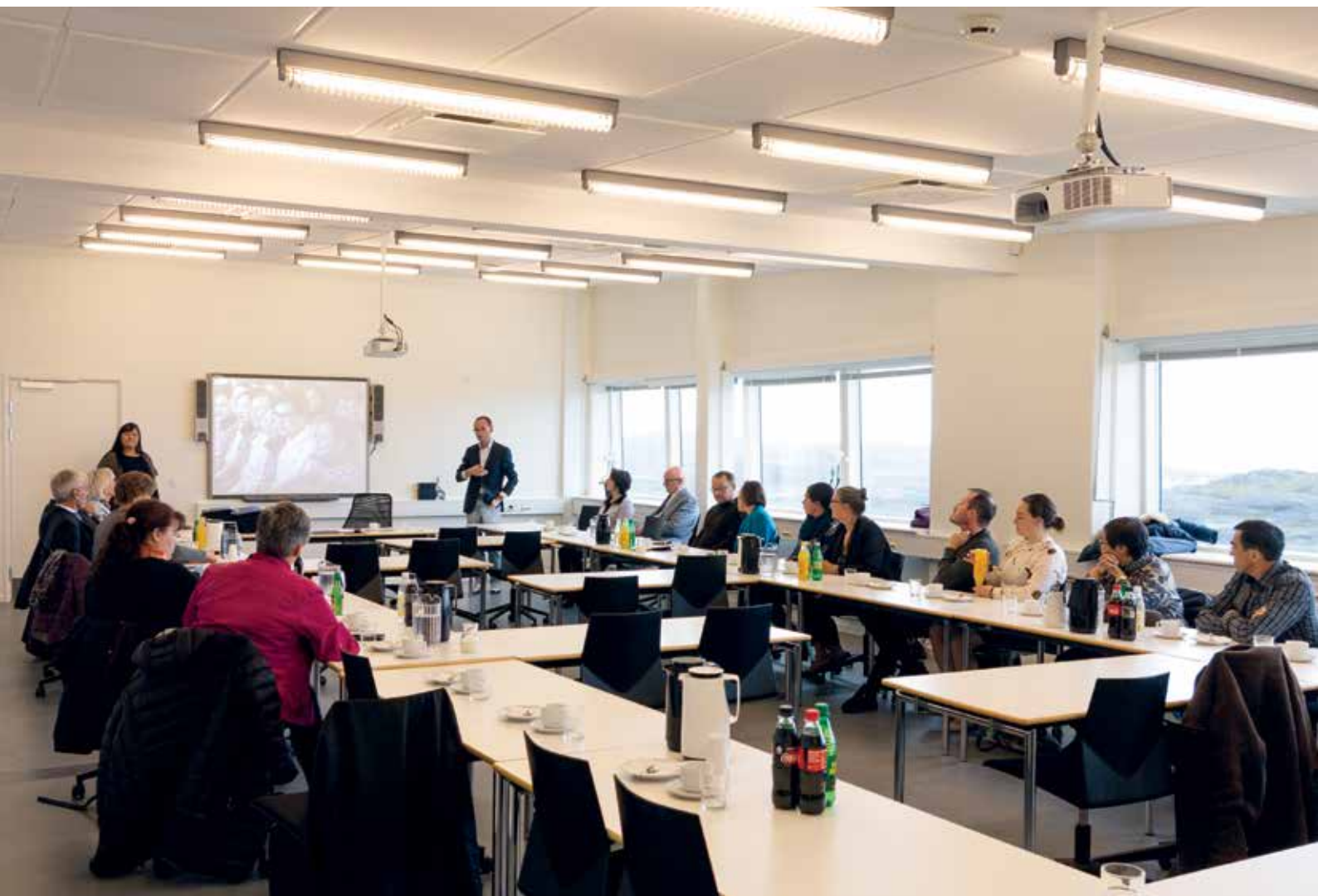
Kontaktudvalget på besøg på Ilisimatusarfik.