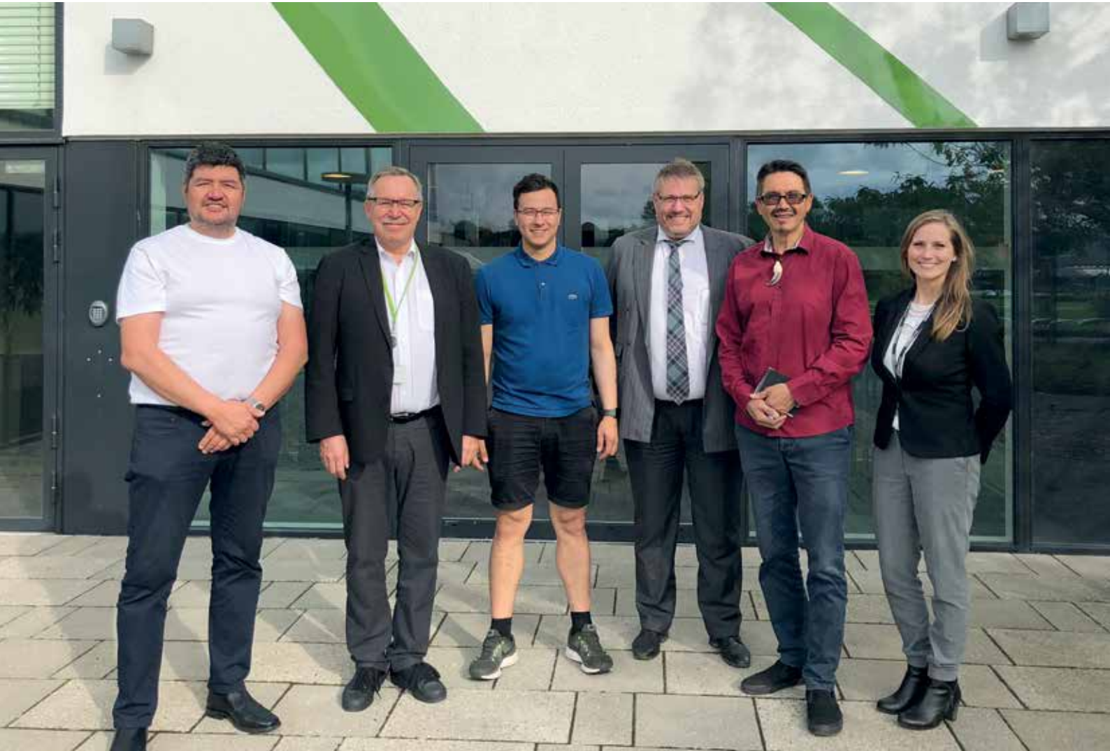
Repræsentanter fra Anlægsudvalget besøgte GOMspace i Aalborg den 10. september for at få en præsentation af virksomheden og fremtidens satellitbårne kommunikation.