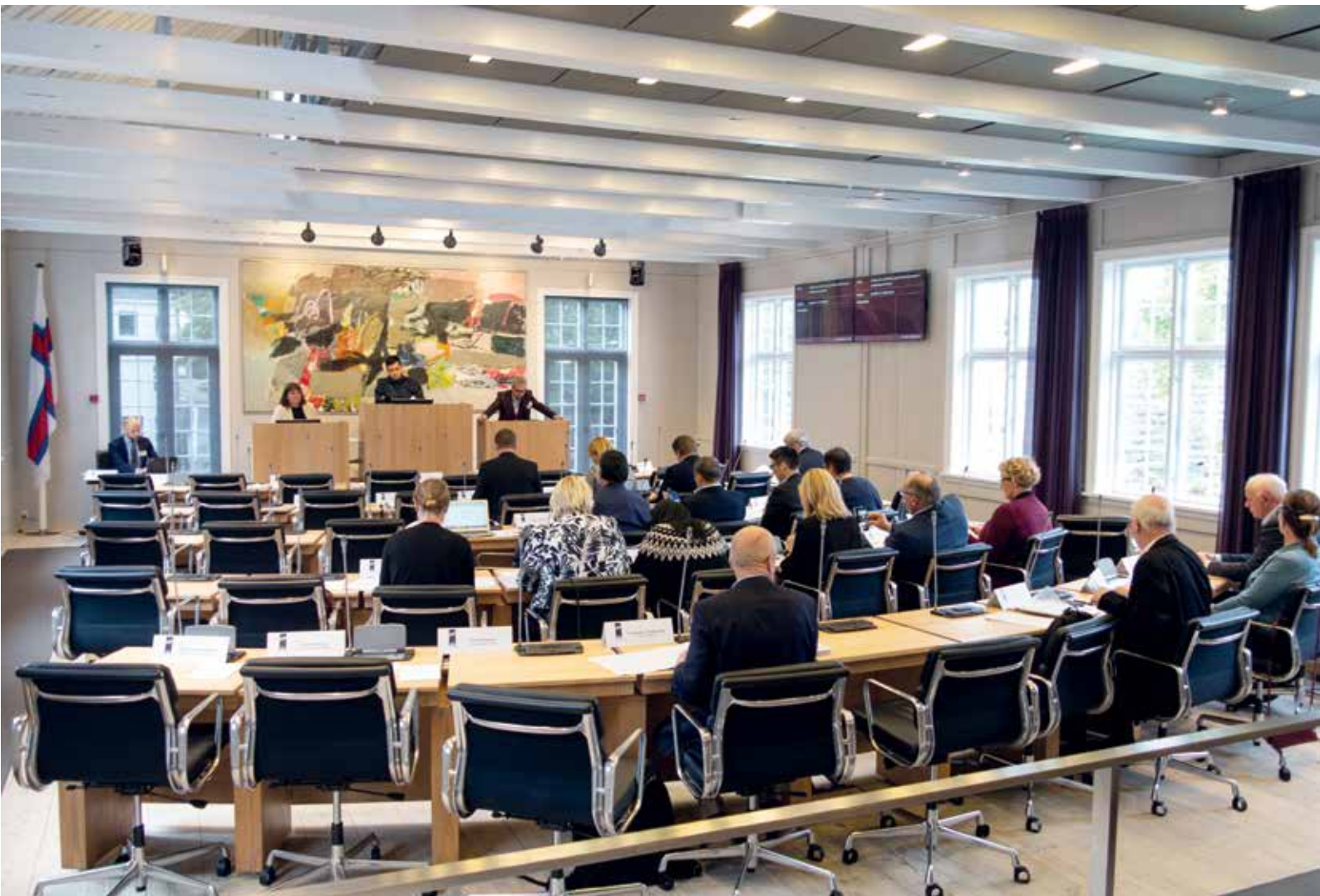
Vestnordisk Råds årsmøde fra den 5. til den 6. september blev holdt i Lagtinget på Færøerne.