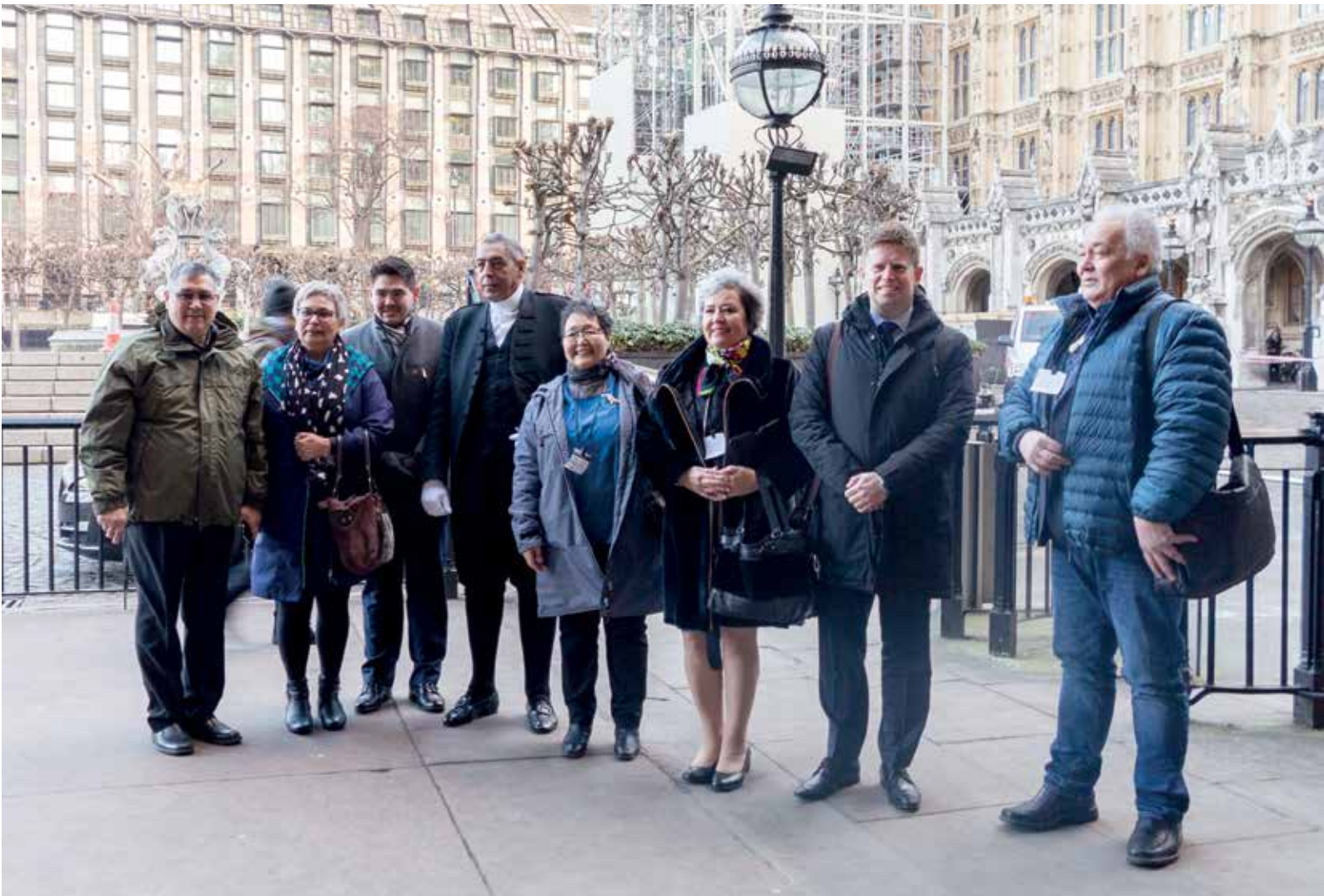
Fra den 26. til den 27. februar var formandskabet på en orienteringsrejse til det engelske parlament i London.