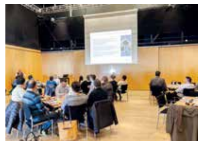
Seminar for medlemmer af Inatsisar- tut efter valget