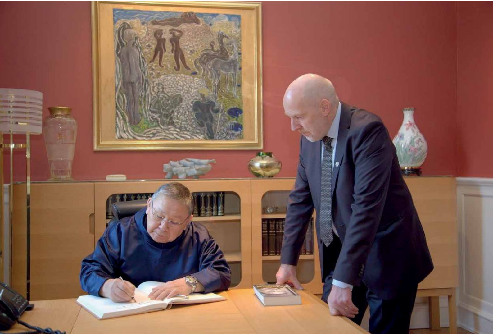
Formanden Lars-Emil Johansen og Altingets formand Steingrímur J. Sigfússon.