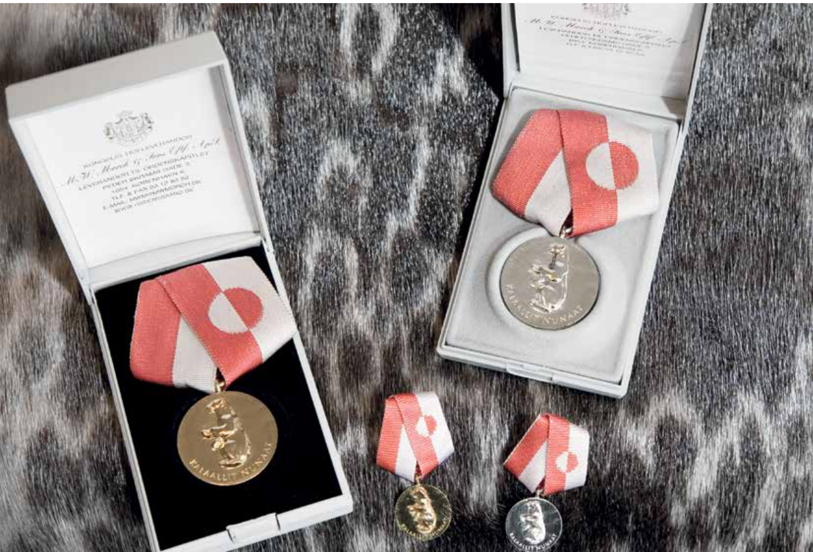
Nersornaat i guld og sølv.