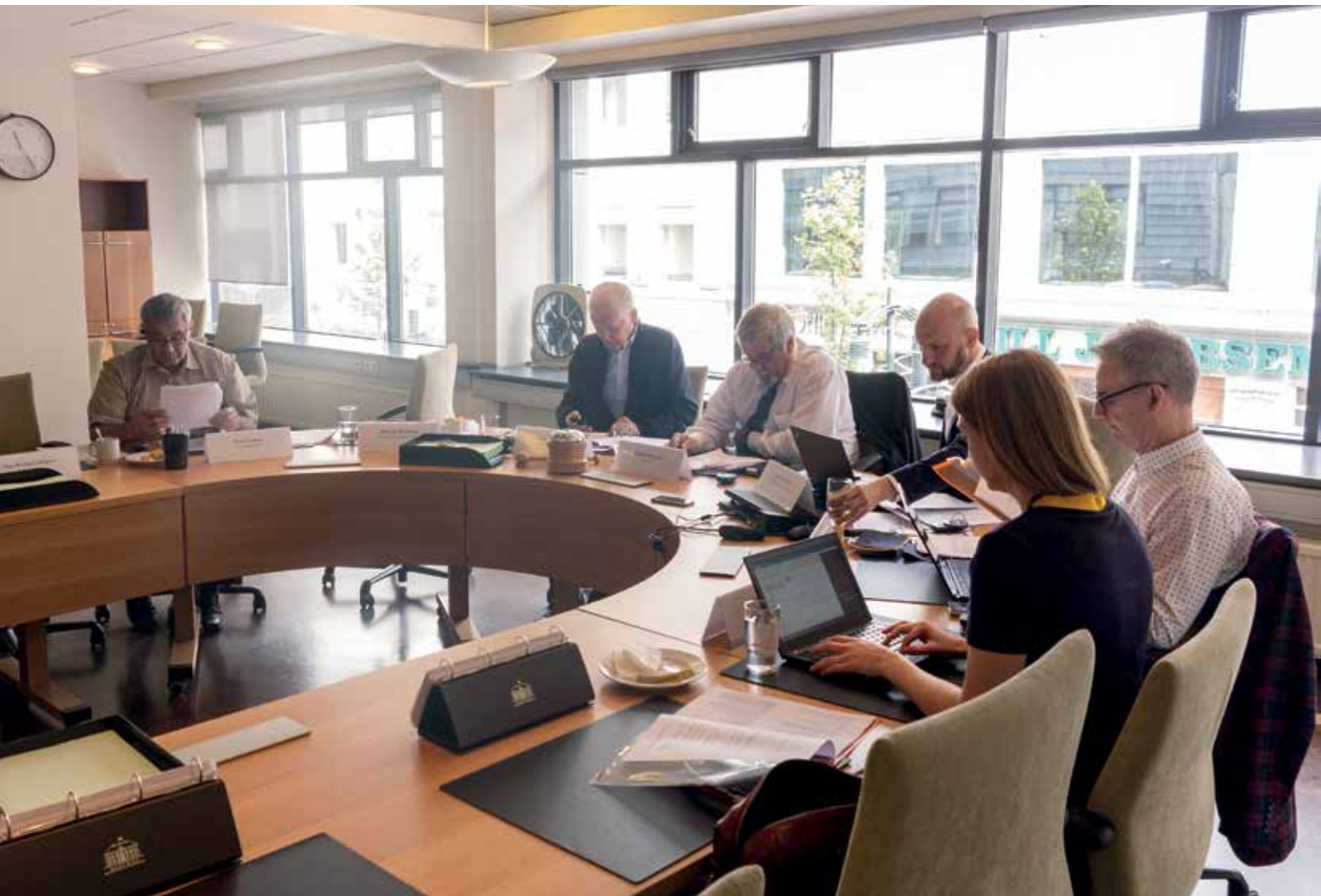
Vestnordisk Råds præsidiemøde i Reykjavik den 14. juni.