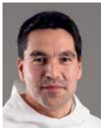
Aqqaluaq B. Egede