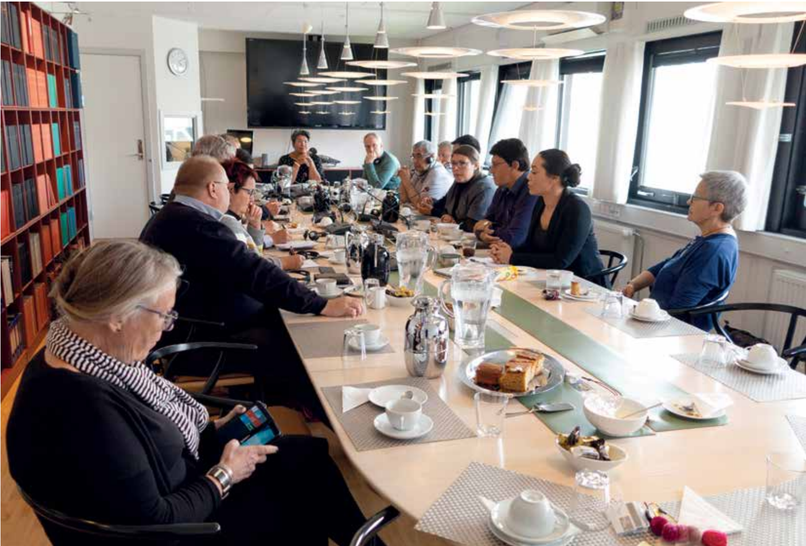
Folketingets Grønlandsudvalgs besøg i Inatsisartut og møde med medlemmer den 15. august.