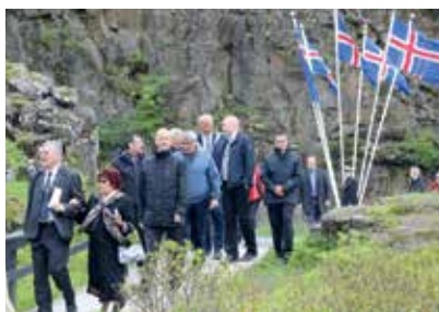
Deltagelse i fejringen af 100-års dagen for Islands selvstændighed og suverænitet