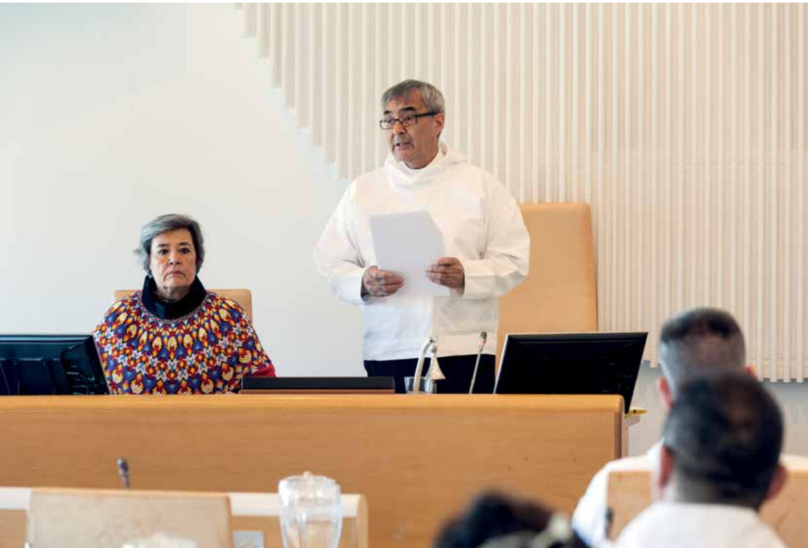
Den 15. maj blev Hans Enoksen (PN) valgt som ny formand for Inatsisartut.