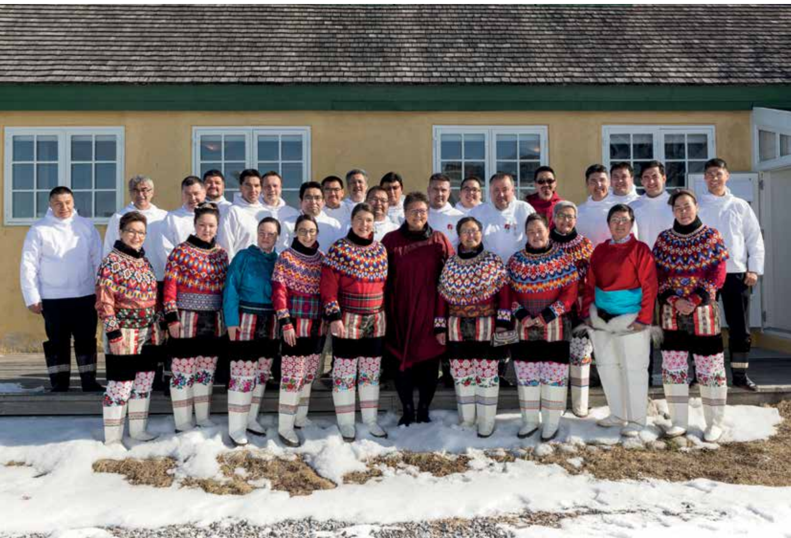
Konstituerende samling den 15. maj.