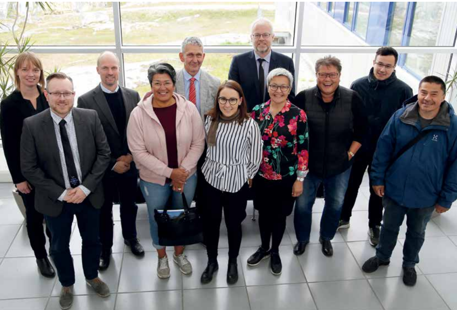
Revisionsudvalget på orienteringsbesøg hos Nukissiorfiit den 31. august.