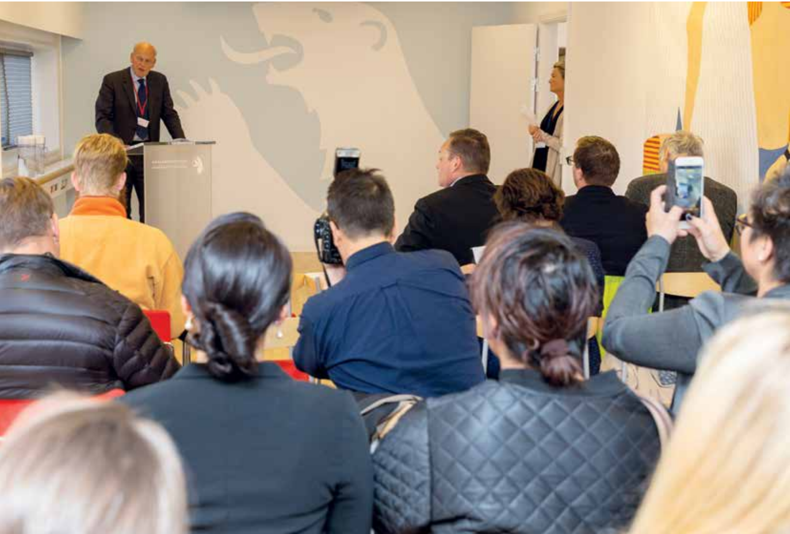
Præsident for Nordisk Råd Michael Tetzschner på pressemødet den 13. september.