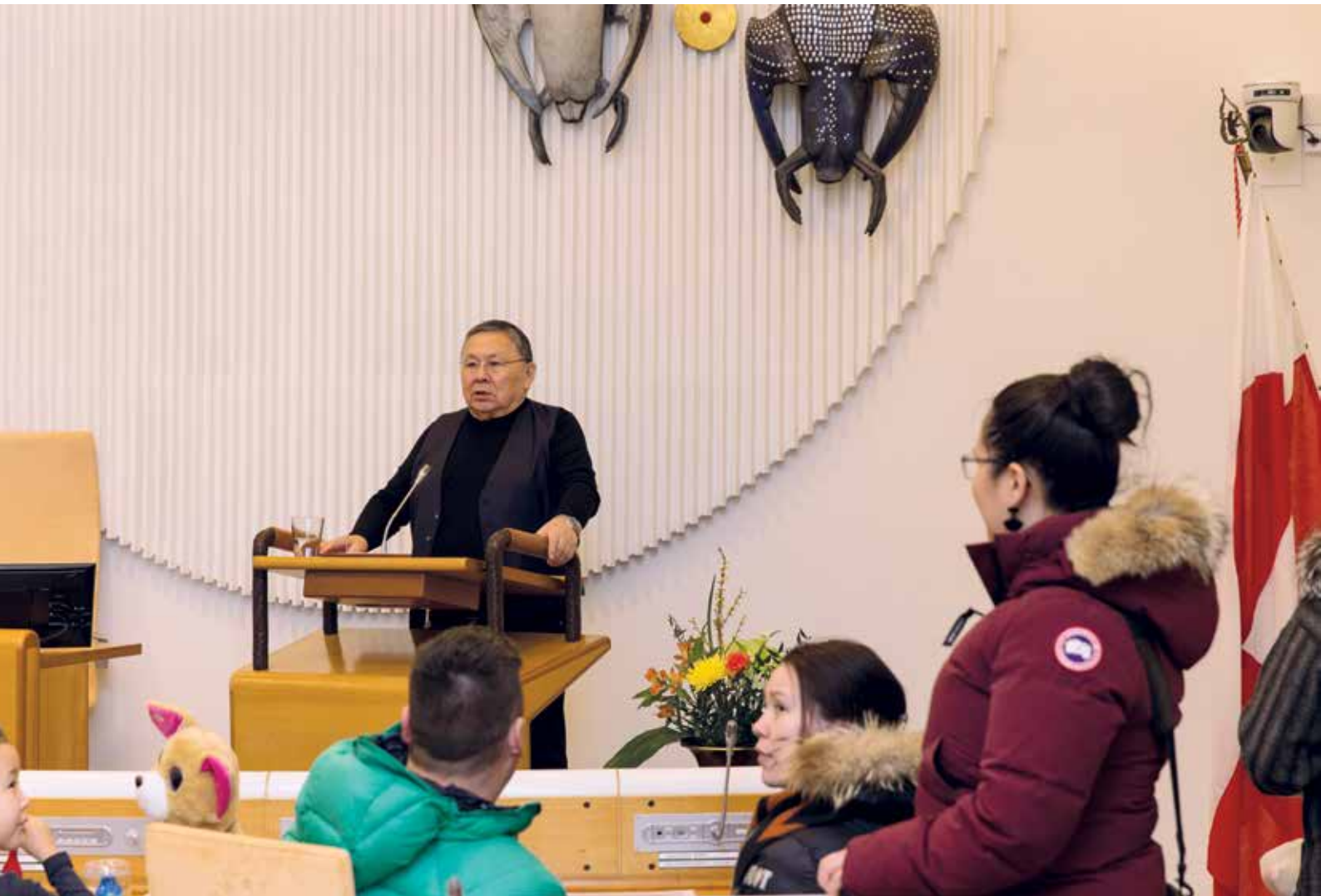
Formanden for Inatsisartut informerede om Inatsisartuts arbejde.