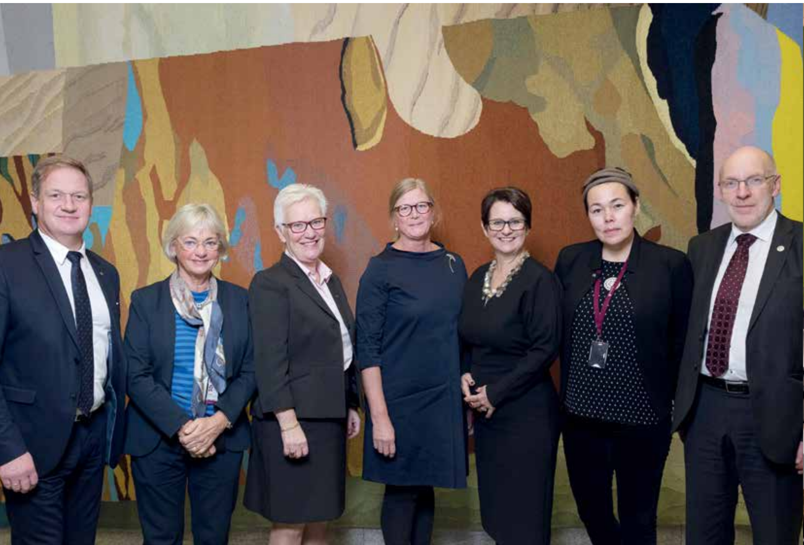
Møde mellem de nordiske parlamentsformænd ved Nordisk Råds session i Oslo den 30. oktober. Fra venstre til højre: Formand for Lagtinget Páll á Reynatúgvu, Formand for Folketinget Pia Kjaersgaard, Formand for Sveriges Riksdag Åsa Lindestam, Formand for Ålands Lagting Gun-Mari Lindholm, Formand for Stortinget Tone Wilhelmsen Trøen, Formand for Inatsisartut Vivian Motzfeldt, Formand for Altinget Steingrímur J. Sigfússon.