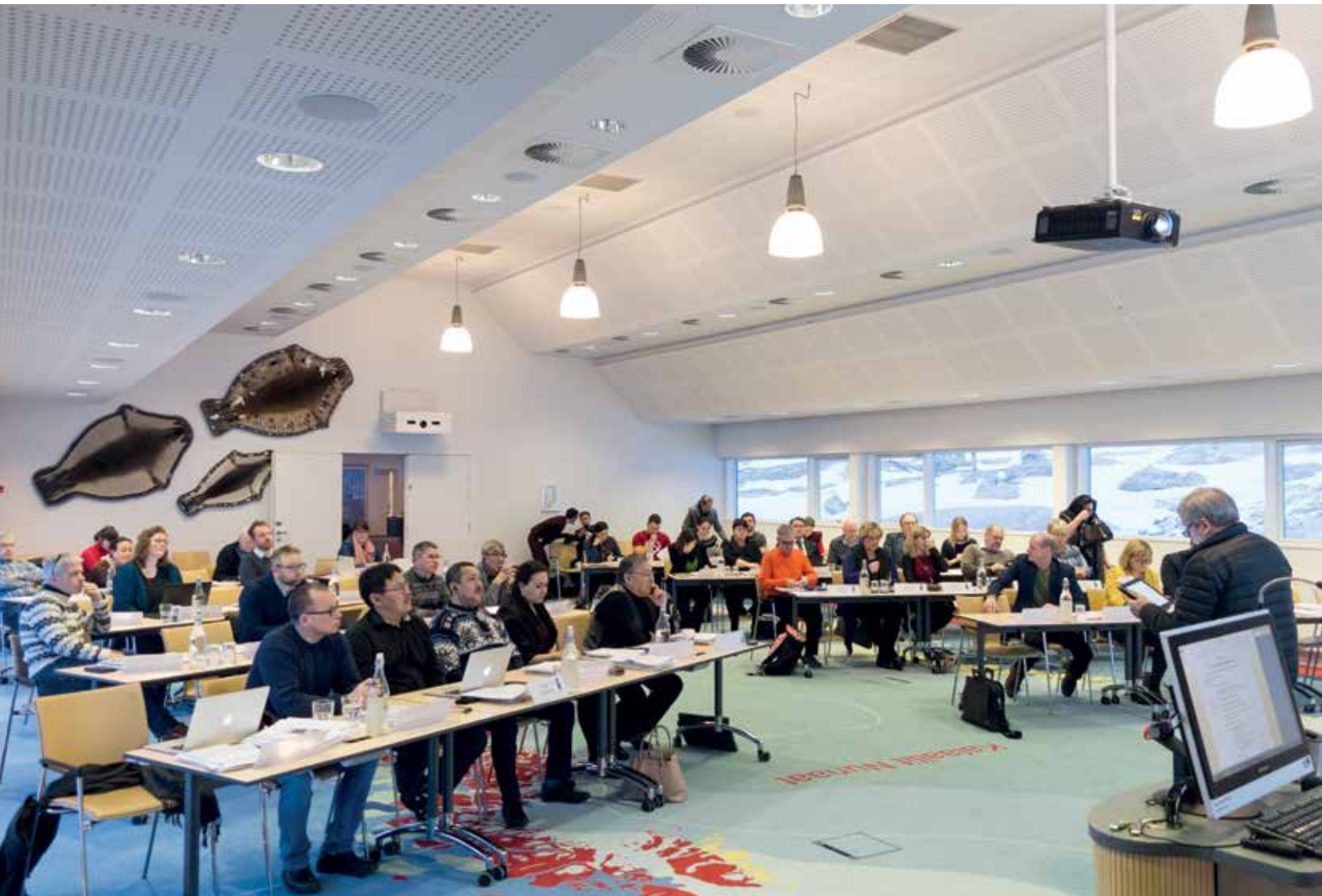
Vestnordisk Råds temakonference blev holdt fra den 30. til den 31. januar i Ilulissat.