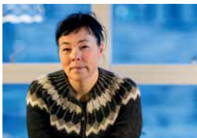
Formand for Inatsisartut Vivan Motzfeldt