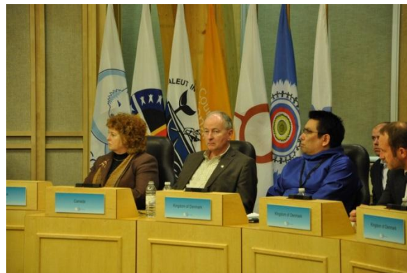
Fra venstre: Canadas udenrigsminister Rob Nicholson, Vittus Qujaukitsoq og Martin Lidegaard.

Under mødet fremhævede Naalakkersuisut behovet for øgede investeringer i Arktis, samt at levende ressourcer er nøglen til den arktiske befolknings identitet og kultur, og at deres livsgrundlag altid vil være baseret på en bæredygtig udnyttelse af disse ressourcer.