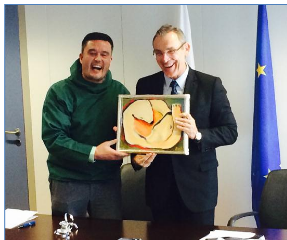
Formand for Naalakkersuisut Kim Kielsen sammen med daværende EU-Kommissær Andris Piebalgs.

Grønland har med rådsbeslutning af den 12. marts 2014 om relationerne mellem EU og Grønland sikret en konstant indtægt fra EU i en 7-årig periode, på i alt 1,6 mia. DKK, mod at skulle afrapportere for de opstillede mål i programmeringsdokumentet.