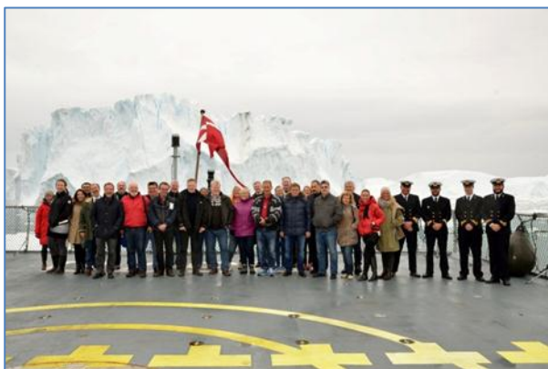
De nordatlantiske fiskeriministre med delegationer, Ilulissat 2014.

De nordatlantiske fiskeriministre udsendte et fælles communiqué efter mødet, hvor ministrene erkender, at klimaændringerne i Nordatlanten har indvirkning på fiskebestandene, navnlig deres geografiske fordeling og produktivitet, og at dette fænomen har betydelige konsekvenser for fiskeriforvaltningen i regionen. Koordinerede indsats i forskning og overvågning vil være afgørende for at forstå forandringer i havmiljøet over tid og reagere effektivt på disse.