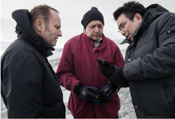
Den franske udenrigsminister Laurent Fabius har besøgt Ilulissat sammen med naalakkersuisoq for udenrigsanliggender, Vittus Qujaukitsoq, og den danske udenrigsminister, Martin Lidegaard.

På COP21 planlægger det franske formandskab eventuelt at indlede COP'en med involvering af statsledere udover det normale ministersegment i slutningen af COP'en.