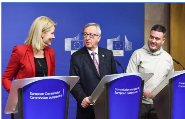
Fra venstre: Helle Thorning-Schmidt, Jean-Claude Juncker og Kim Kielsen.

øget kompetence til Selvstyret og dette signal er videreført i forhold til samarbejdet med EU.