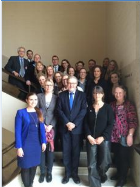
CEDAW eksaminationen, februar 2015.

Eksaminationen tog udgangspunkt i afrapporteringen, der præsenterer aktiviteter, statistikker, lovgivning mv. på området og som redegør for, hvad man siden sidste eksamen i 2009 har gjort for at fremme kvinders rettigheder, for eksempel på arbejdsmarkedet og i uddannelsessystemet.