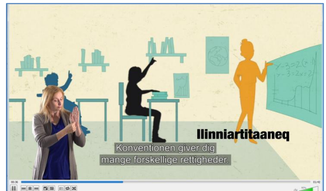
Illustration fra den animationsfilm Grønlands Råd for Menneskerettigheder har lavet om menneskerettigheder.

Nedenstående billede er fra den animationsfilm, Rådet har lavet om menneskerettigheder.