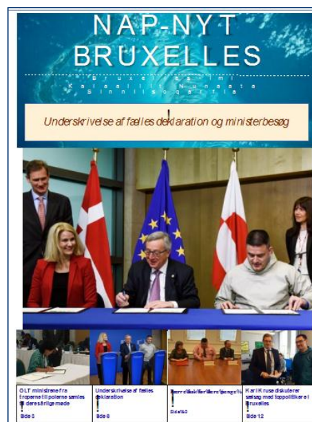
Eksempel på en NAP-NYT forside.

I 2009 begyndte Grønlands Repræsentation at udsende et nyhedsbrev, "NAP-NYT, Bruxelles". Nyhedsbrevet indeholder korte nyhedsartikler om repræsentationens arbejde, evt. besøg, synligheden i Bruxelles og nyheder om begivenheder i EU med relevans for Grønlands aftaler med EU. Ideen til nyhedsbrevet kommer fra København, hvor den nordiske enhed har et lignende nyhedsbrev for de nordiske aktiviteter. Nyhedsbrevet bliver godt modtaget og bliver rundsendt til interesserede i Selvstyret, såvel som til repræsentationens andre samarbejdspartner i Grønland og i EU institutionerne, herunder Kommissionen, Rådet, og Europa-Parlamentet. Nyhedsbrevet kan læses og hentes på Naalakkersuisuts hjemmeside.